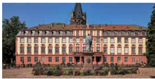
Erbach Sicherungsarbeiten im Schloss Erbach Seite 6