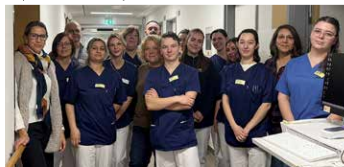
Das Bild zeigt die Pflegeschüler mit ihren Lehrern der Pflegeschule, sowie die Praxisanleiter.

des Odenwaldkreises moderne und praxisnahe Ausbildungswege aufzeigen und ein Signal für die Zukunft der Pflege setzen: gut ausgebildete Fachkräfte, die selbstbewusst Verantwortung übernehmen. red