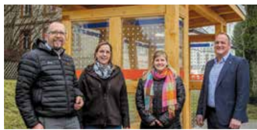
Oberzent-Beerfelden Neue Werkhalle am Bahnhof Beerfelden Seite 2

Telefon 06165/93090 - info@odw-journal.de - www.odw-journal.de