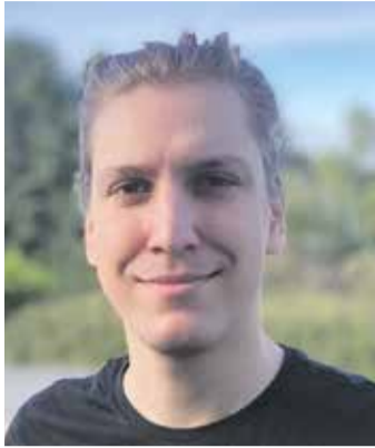
von Aleksandar Kerošević, Redaktionsleiter

Es ist wieder so weit: Heute ist der 14. Februar. Während die einen diesen Tag als eine reine Erfindung der Floristen abtun, spüren die anderen – vielleicht beflügelt durch die ersten Vorboten des Frühlings – Schmetterlinge im Bauch. Doch warum gibt es den Valentinstag überhaupt?