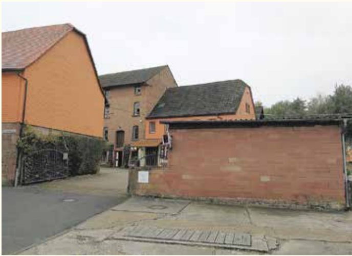
Die Stockheimer Mühle von außen. Auf dem Grundstück soll bereits im neunten Jahrhundert Korn gemahlen worden sein.

Stockheim „klein“ zu nennen, ist keine Herabsetzung – bei diesem Stadtteil handelt es sich um die kleinste Gemarkung Michelstadts. Stockheim befindet sich an der Grenze zu Erbach am nordöstlichen Ufer des Erdbachs. Mit einer Fläche von 1,03 Quadratkilometern ist es ein übersichtlicher Ort, aber mit einer langen Geschichte. Man könnte diese Geschichte vor 200 Millionen Jahren beginnen lassen, als die Region noch von einem Flachmeer bedeckt war. Die zahlreichsten Einwohner waren wohl Ammoniten, Schnecken und Muscheln, wie Bodenfunde belegen. Einen Einblick in diese Zeit bietet die Schautafel am östlichen Rand von Stockheim. Die älteste erhaltene Überlieferung des Ortes als „Stocheim“ findet sich im Lorscher Codex