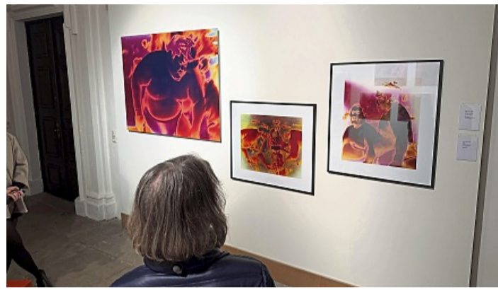
Echte Hingucker: Die farblich verfremdeten Sumoringe eröffnen einen neuen Blick auf die Wirklichkeit.

So entstehen Bilder mit großer Leuchtkraft, die irgendwie unreal, nicht von dieser Welt wirken. Und doch stellen sie ein Stück Wirklichkeit dar, nämlich jene Realität, die die Künstlerin selbst geschaffen hat. Mal sind es Kröten aus einem Kit-