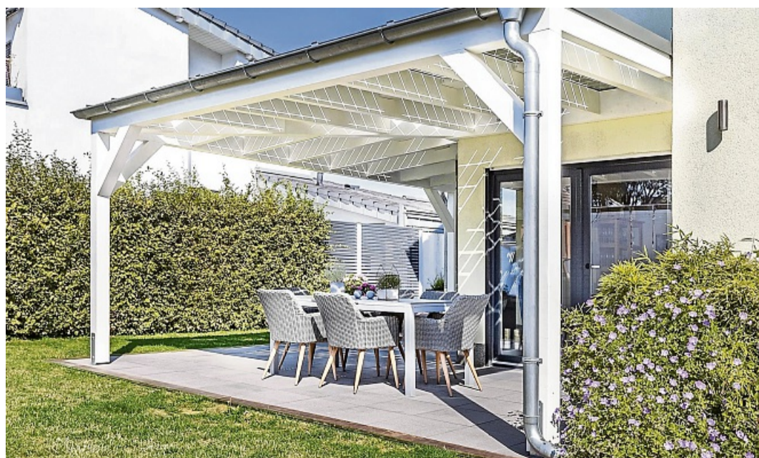
Jedes Solar-Terrassendach wird nach Maß geplant und passend zum Architekturstil des Eigenheims gefertigt

Noch ein Tipp: Die Idee der eigenen, eleganten Stromgewinnung hört nicht an der Terrasse auf. Die gleiche Technik, die das Freiluft-Wohnzimmer aufwertet, eignet sich ebenfalls als Carport oder zum Beispiel als Poolüberdachung. Gerade bei einem Pool ist der Nutzen hoch. Die Überdachung hält das Wasser sauber, verlängert die Badesaison und liefert den kostenfreien Ökostrom für die Umwälzpumpe gleich mit.