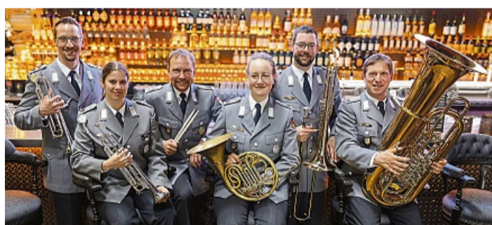
Das Brass 6'tett ist eines der Kammerensembles des Heeresmusikkorps der Bundeswehr aus Kassel, die am 21. April in Dalwigkthal zu erleben sind.

Lichtenfels-Dalwigkthal – Zum wiederholten Mal ist das Kammerensemble des Heeresmusikkorps Kassel live in Dalwigkthal zu erleben: Das Ensemble gibt am Dienstag, 21. April, um 19 Uhr im Marstall auf Hof Campf der Familie von Dalwigk in Dalwigkthal ein Benefizkonzert zugunsten der Kinderkrebshilfe Waldeck-Frankenberg. Die Schirmherrschaft hat Bürgermeister Henning Scheele. Das Repertoire um-