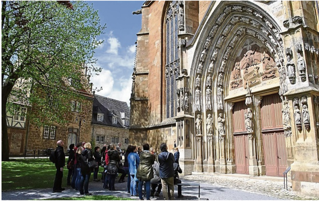
Die Kiliankirche mit ihrem imposanten Südportal ist eine der zahlreichen Stationen bei einer Führung durch die historische Altstadt in Korbach.

Die Altstadtführungen finden jeden Dienstag um 14.30 Uhr und jeden Samstag um 10.30 Uhr statt, in den Sommermonaten Juli und August zusätzlich jeden Donnerstag um 14.30 Uhr. Treffpunkt ist die Korbach-Information in der Prof.-Bier-Straße 15, hier werden auch die Tickets verkauft. Die Führungen an der Korbacher Spalte beginnen immer sonntags um 11.15 Uhr direkt im Steinbruch in der Frankenger Landstraße 22. Auch hier gibt es in Juli und Au-