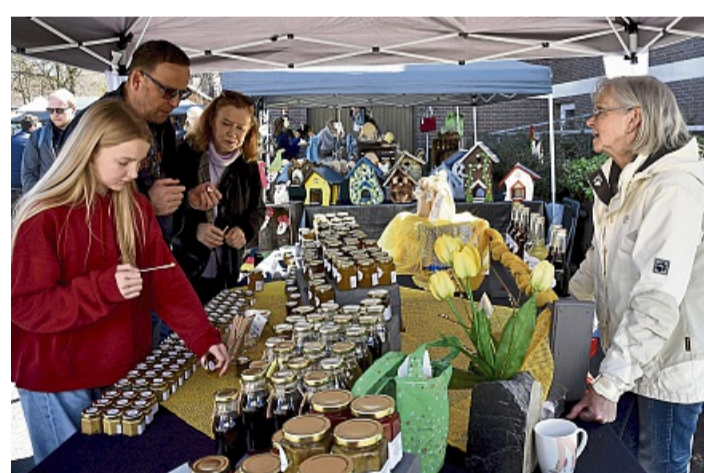
Viele regionale Köstlichkeiten gibt es an den Ständen des Ostermarktes in Adorf zu entdecken.

Auch für die kleinen Gäste ist bestens gesorgt: Ein hinreißendes Kinderkarussell zaubert strahlende Augen, während die Freiwillige Feuerwehr Diemelsee spannende Spiele und Aktionen rund um das Thema Feuerwehr anbietet. Und natürlich darf der Osterhase nicht fehlen – er schaut am frühen Nachmittag vorbei und überrascht die Kinder mit süßen Versteckspielen und kleinen Geschenken. Doch eigentlich ist der Osterha-