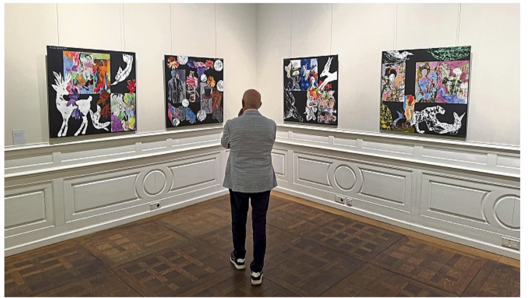
Da steht der Betrachter und staunt: Unter dem Titel „Magische Momente“ zeigt das Museum Bad Arolsen in den Ausstellungsräumen des Residenzschlusses ganz ungewöhnliche Fotokunst aus dem Labor von Renate Olbrich.