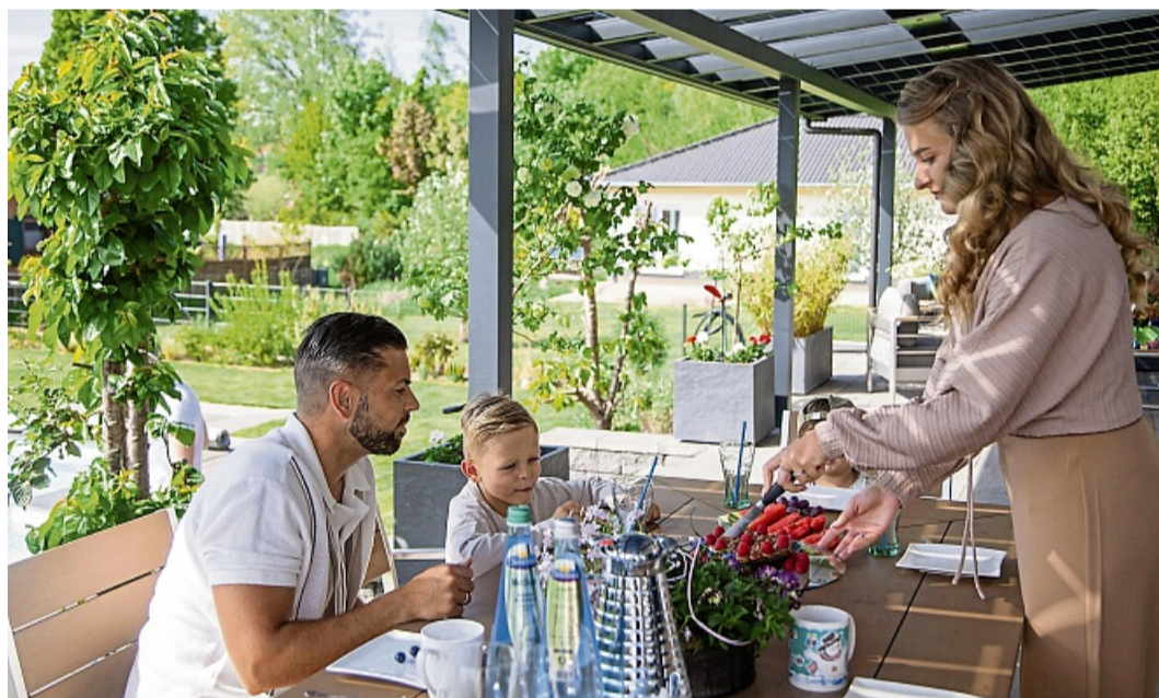
Garten-Luxus in vollen Zügen genießen: Ein Solardach für die Terrasse spendet den gewünschten Schatten und liefert gleichzeitig Ökostrom frei Haus.

Ein Terrassendach, das sich die Hausbewohner ohnehin wünschen, erhält mit Solarmodulen einen Mehrfachnutzen. Als Ökokraftwerk gewinnt es kostenlosen Strom, der sich direkt im Haushalt nutzen oder für später speichern lässt. Das senkt dauerhaft die Energiekosten, sodass sich das Dach mit der Zeit von selbst finanziert. Jede Sonnenstunde, welche die Familie entspannt rund um den