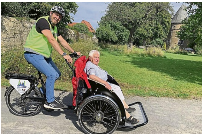
Auch mit einer Rikscha könnendie schönen Seite von Korbach erlegt werden.

Außerdem finden auch in diesem Jahr immer am ersten Donnerstag im Monat um 15 Uhr (Ausnahme: 9. Juli 2026) wieder inklusive Stadtführungen mit bis zu drei Fahrrad-Rikschas statt. Diese richten sich an Menschen mit körperlichen Einschränkungen, die einen „üblichen Stadtrundgang“ nicht bewältigen können. Korbach geht hier mit gutem Beispiel voran, denn Stadtführungen mit einer Rikscha für Rollstuhlfahrer sind in Nordhessen bislang einzigartig.