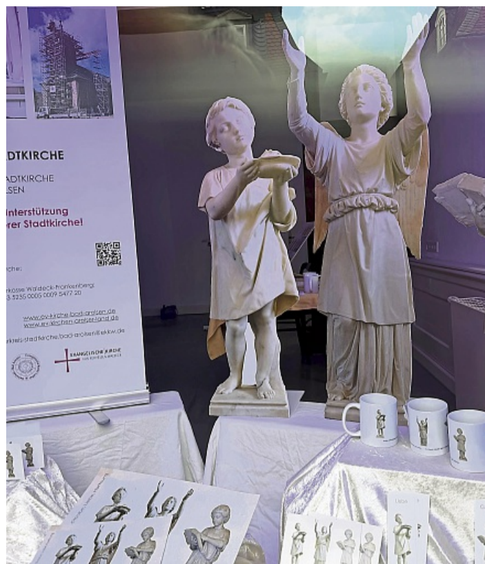
Die aus Pappe nachgebildeten Rauch-Statuen Glaube, Liebe, Hoffnung wirken in dem Schaufenster als Hingucker, der auf die Sanierungs-Problematik hinweisen soll.

Die Statuen sind zum Schutz vor Beschädigungen ins Christan-Daniel-Rauch-Museum im Marstall ausquartiert. Nachbildungen aus Pappe nehmen ihre Plätze in der Kirche ein. Ein zweiter Satz dieser Papp-Nachbildungen ist nun auch im Schaufenster in der Schlosstraße zu sehen. Zur feierlichen Er-