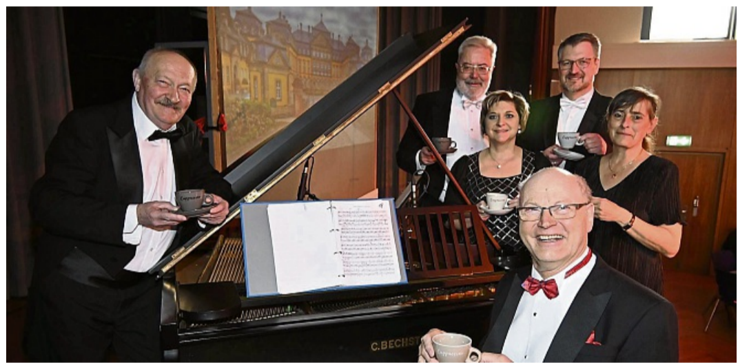
Kaffeestunde mit dem Waldeckischen Salonorchester.

Eintrittskarten sind ab sofort im Touristik-Service im Bürgerhaus (Tel.: 05691/801240) erhältlich. red