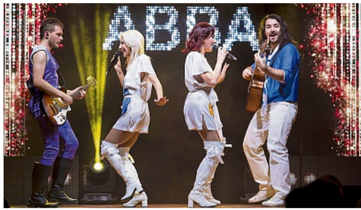
Mit „ABBA – The Concert“ kehrt der Sound der erfolgreichen Popgruppe auf die Bühne zurück.

Mit „ABBA – The Concert“ kehrt am Sonntag, 1. November, der Sound einer der erfolgreichsten Popgruppen aller Zeiten auf die Bühne zurück. Die Show bringt nach Angaben des Veranstalters „den Sound und das Lebensgefühl der 70er-Jah-