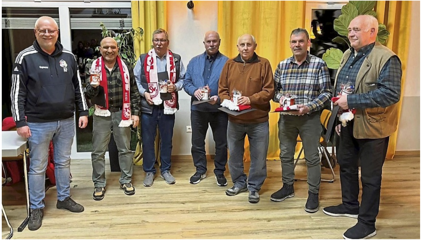
Der TSV ehrte auf der Jahreshauptversammlung verdiente Mitglieder.