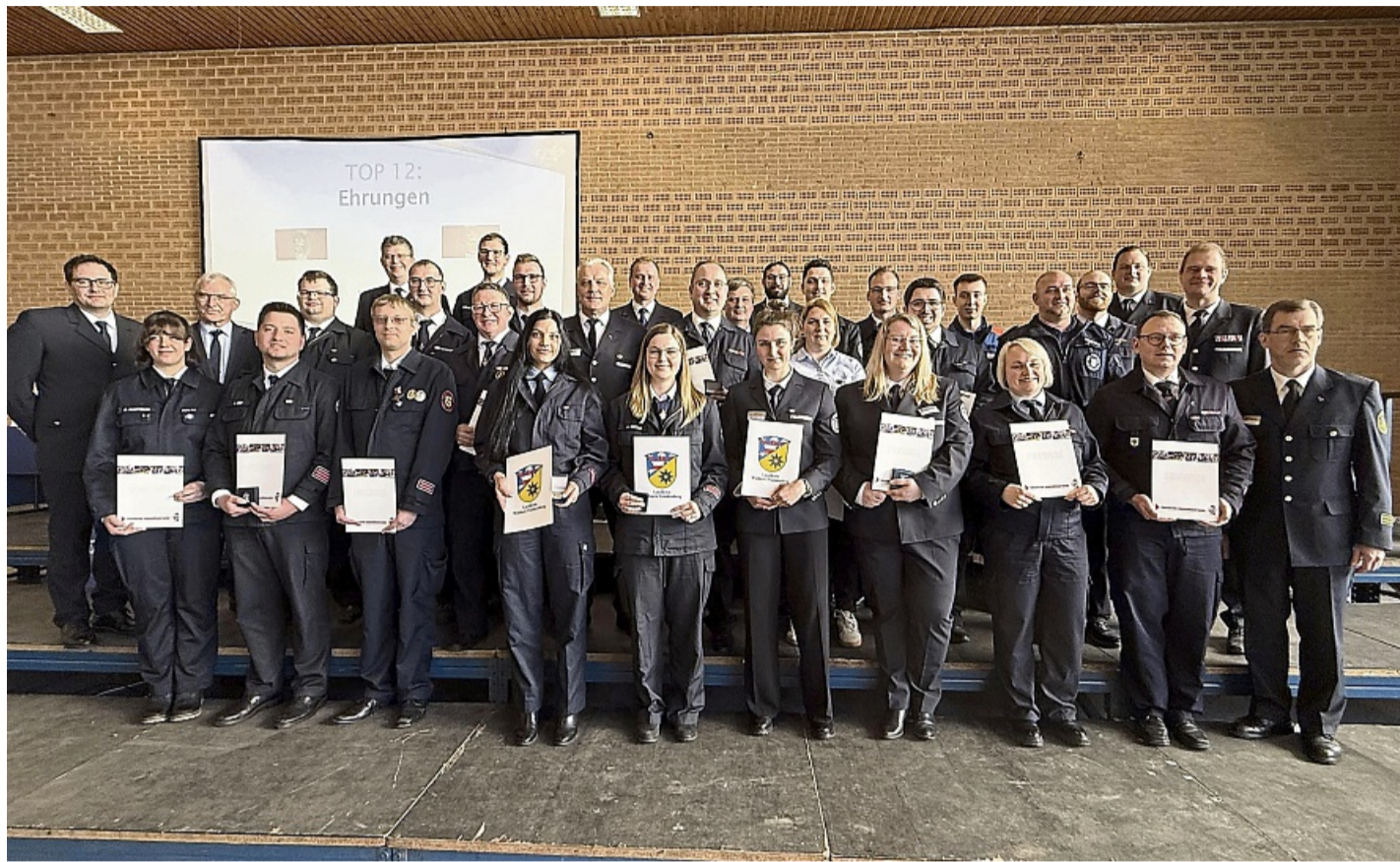
Ehrungen bei der 50. Delegiertenversammlung der Kreisjugendfeuerwehr Waldeck-Frankenberg.