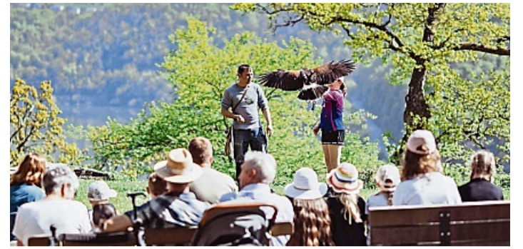
Die Flugschau der Greifenwarte Edersee im WildtierPark ist einer der Publikumsmagneten.

schlossen bleiben. Infrage kommen private Objekte ebenso wie Bahnhöfe, Brücken, Bunker, Schlösser, Museen, Ruinen oder archäologische Fundstellen. Bei Fragen steht die Deutsche Stiftung Denkmalschutz unter der Telefonhotline 0228 9091-442 montags bis donnerstags von 10 bis 13 Uhr oder unter der E-Mail info@tag-des-offenen-denkmals.de zur Verfügung.