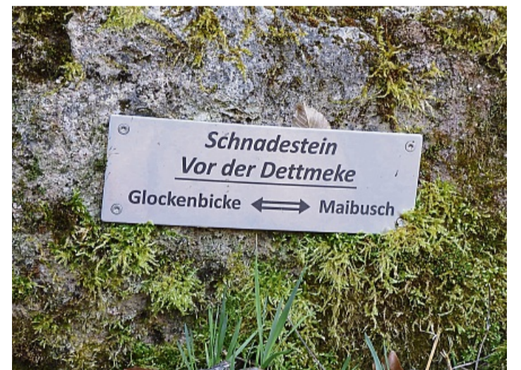
Schnadezug in Adorf