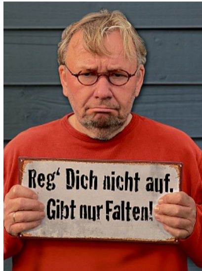
Lachen statt ärgern ist das Ziel von Kabarettist Bernd Stelter.

Bernd Stelter gastiert am 24. April in Korbach