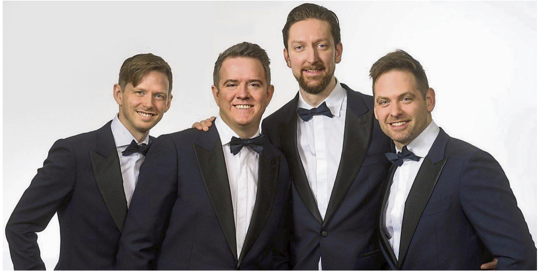
Mit „Good Vibrations“ kommen die Ringmasters nach Frankenberg und bieten Barbershop-Klassiker, Popsongs und eigene Lieder.

Den festlichen Abschluss bildet das große Orchesterfinale im Kongress Palais Kassel: Am 11. August spielen das „Orchestra of the Americas“ und das „Penderecki Youth Orchestra“, am 12. August folgt die renommierte Angelika-Prokopp-Sommerakademie der Wiener Philharmoniker. Insgesamt umfasst das Festival rund 90 Veranstaltungen in mehr als 38