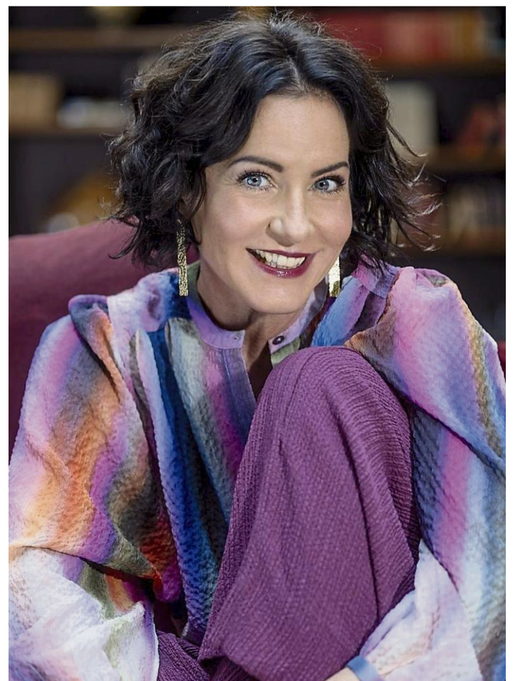
red Marisa Burger ist bekannt von den „Rosenheim-Cops“.

Samstag, 1. August: Lange Folknacht , 18.30 bis 23 Uhr in der Wandelhalle Bad Wildungen.