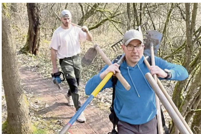
Arbeitseinsatz am MTB-Trail in Sontra: Mit Hacke und Schaufel ging es ans Werk.

Trail-Revier bringt Strecke auf Vordermann