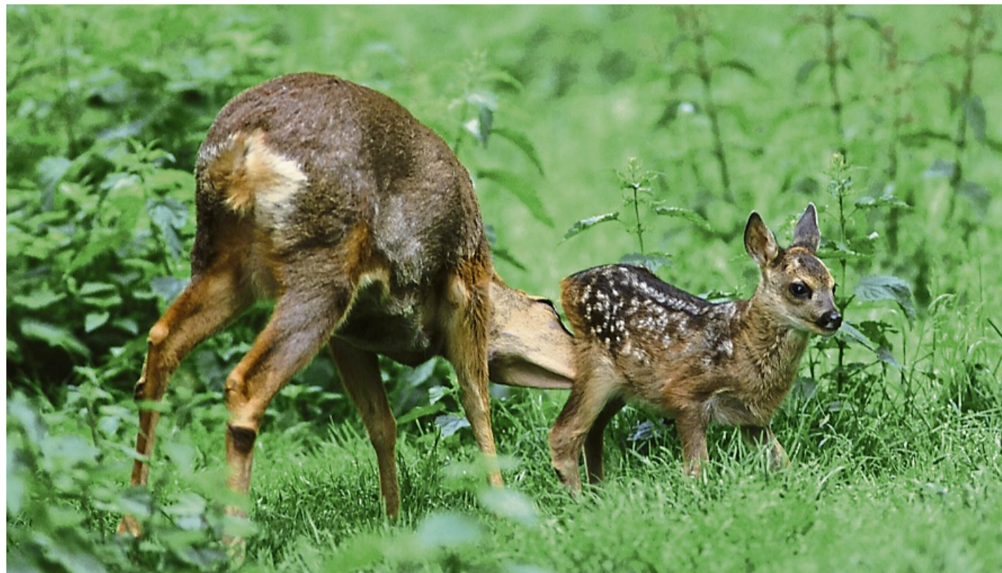
Brauchen jetzt besondere Ruhe: Die Wildtiere bekommen jetzt ihren Nachwuchs – hier eine Ricke mit ihrem Kitz.