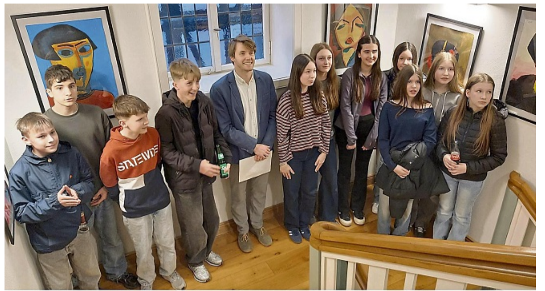
Kunst im Rathaus Sontra. Ausstellung von Schülern der Adam-von-Trott-Schule.

Für viele war es ein unvergesslicher Moment: die erste eigene Ausstellung, echte Besucherinnen und Besucher – und sogar die ersten Bilder wurden verkauft. Die Freude und der Stolz in den Gesichtern der Jugendlichen waren einfach unbezahlbar.