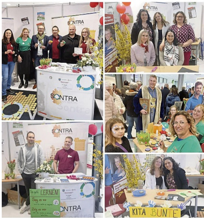
Großer Erfolg für die ASH-Messe in Sontra: Impressionen vom Messestand der Stadt Sontra.

Auch die Stadt Sontra präsentierte sich auf der Messe und bot neben vielen Informationen eine attraktive Rabatt-Aktion für Schwimmbad-Saisonkarten an, die auf reges Interesse stieß. Das Angebot der Kindertagesstätten Ulfen und Wichmannshausen fand vor allem