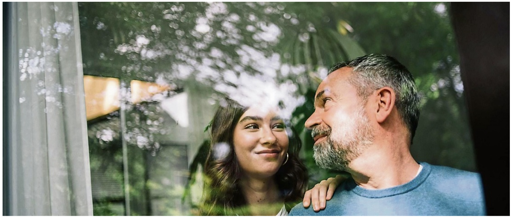
Was bringt die Zukunft? Eine leicht optimistische Einstellung wirkt sich positiv auf unser Leben aus.