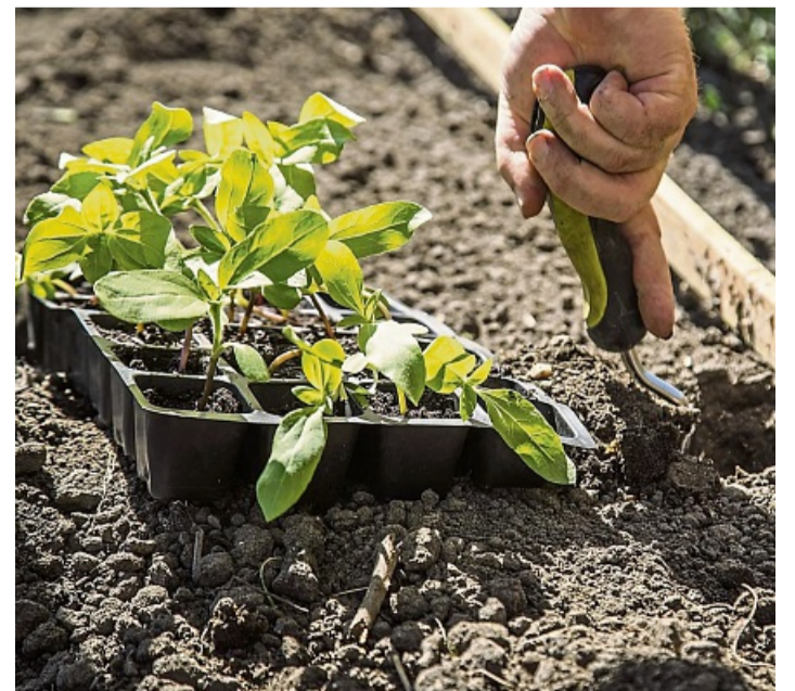
Nach den Eisheiligen Mitte Mai können die selbst gezogenen Pflänzchen ins Beet umziehen.