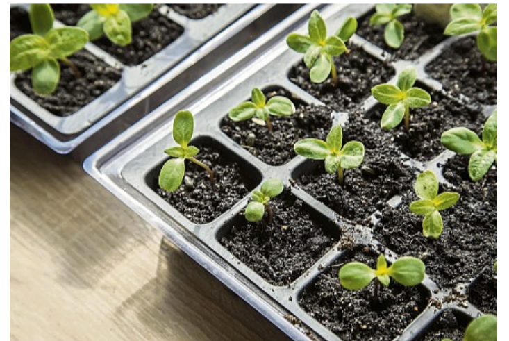
Gesunde Sämlinge: Gleichmäßig feuchte Erde und ausreichend Licht sorgen für kräftiges Wachstum.

Kippen die Sämlinge um, liegt das häufig an einer zu nassen Erde und einem zu dunklen Standort. Hanna Strotmeier weist darauf hin, dass es sich auch um eine Pilzinfektion handeln kann. „Die geschädigten Sämlinge entfernt man,