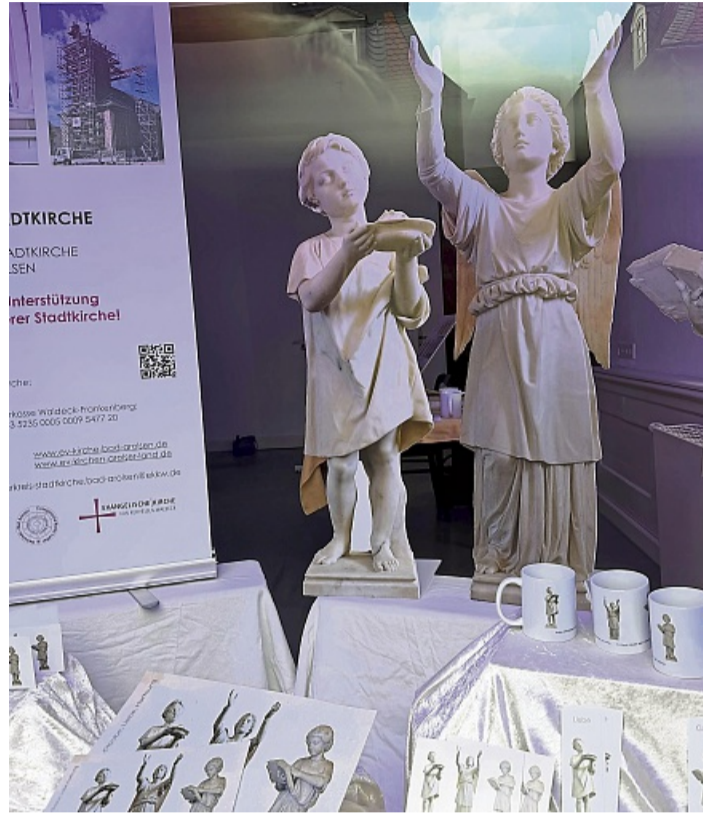
Die aus Pappe nachgebildeten Rauch-Statuen Glaube, Liebe, Hoffnung wirken in dem Schaufenster als Hingucker, der auf die Sanierungs-Problematik hinweisen soll.

Die Statuen sind zum Schutz vor Beschädigungen ins Christan-Daniel-Rauch-Museum im Marstall ausquartiert. Nachbildungen aus Pappe nehmen ihre Plätze in der Kirche ein. Ein zweiter Satz dieser Papp-Nachbildungen ist nun auch im Schaufenster in der Schlosstraße zu sehen. Zur feierlichen Er-