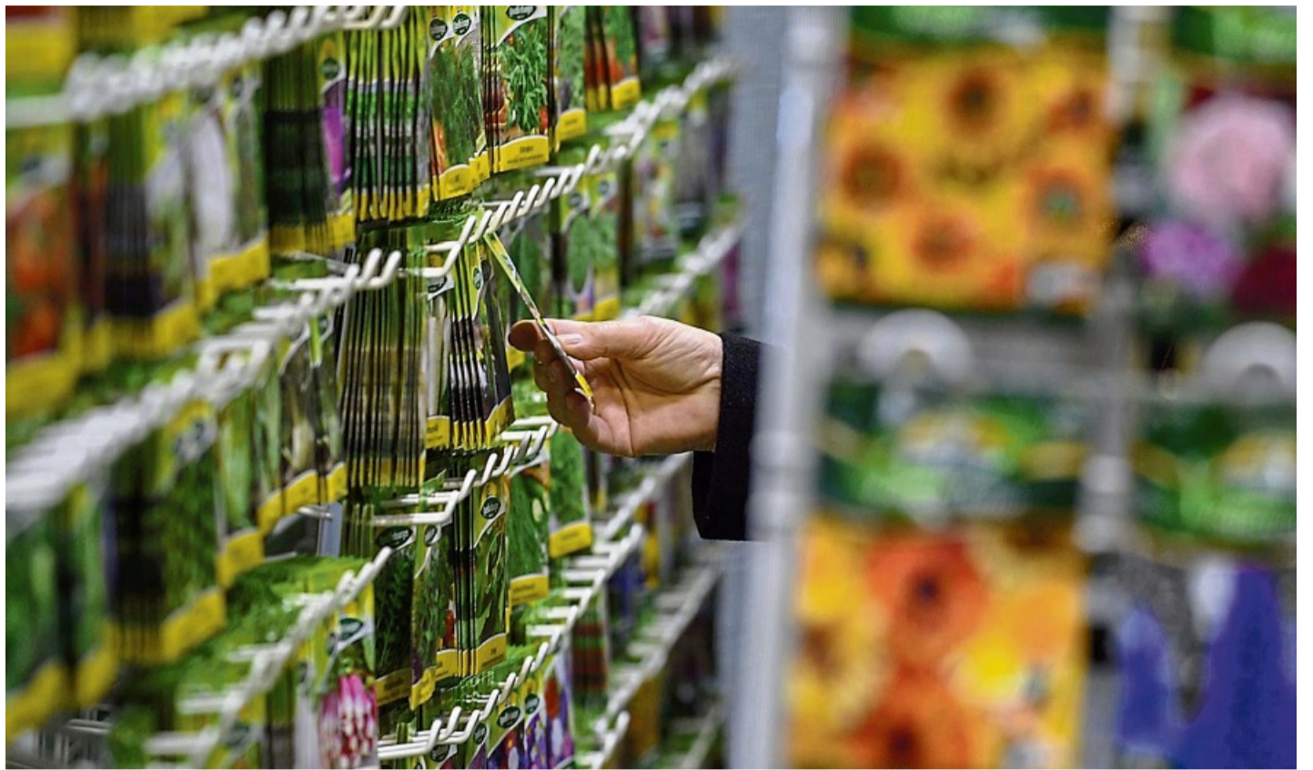
Die Qual der Wahl: Samentütchen verlocken, doch nicht alles passt am Ende in den Garten.

Eine gleichmäßig leicht feuchte, keinesfalls nasse Erde ist das A und O für ein gutes Wachstum. Bei der Anzucht in der Wohnung kann es sein, dass die Sämlinge so dicht stehen, dass sie vereinzelt werden müssen.