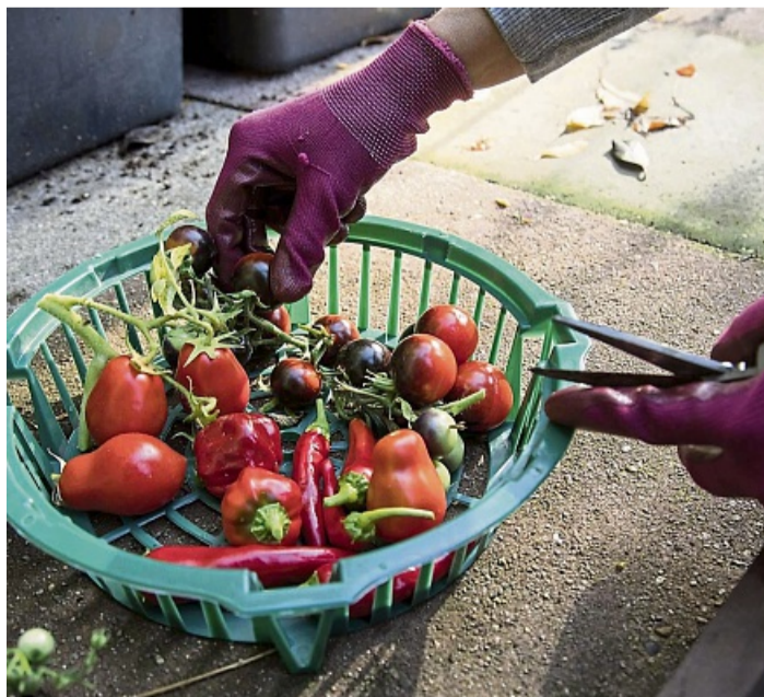
Im Ernteglück: Gut gepflegte Pflanzen liefern frisches Gemüse direkt aus dem Garten.