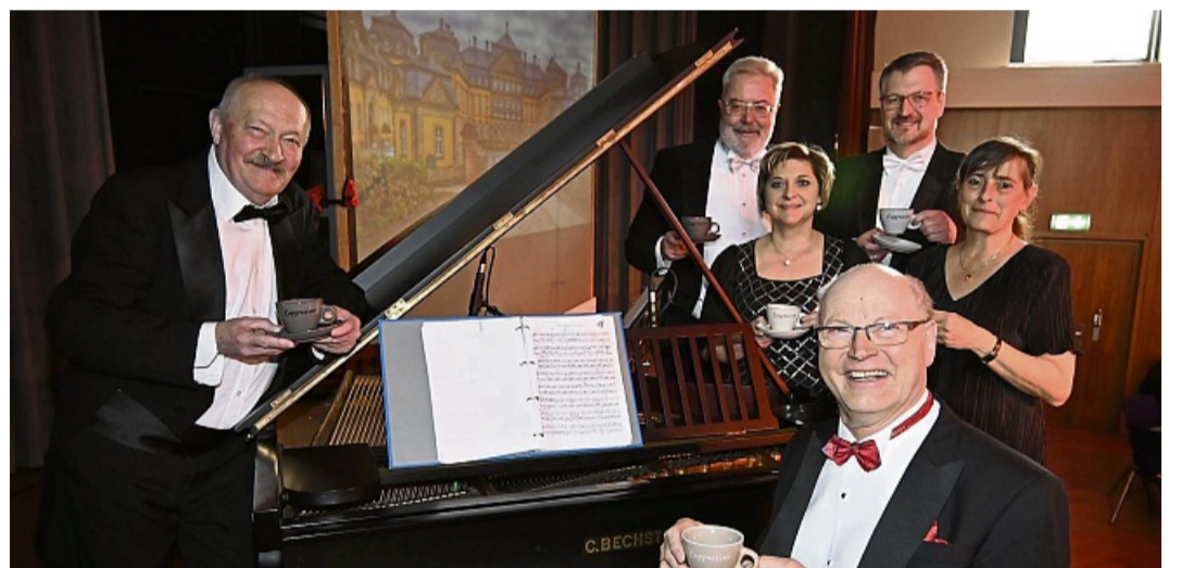
Kaffeestunde mit dem Waldeckischen Salonorchester.

Eintrittskarten sind ab sofort im Touristik-Service im Bürgerhaus (Tel.: 05691/801240) erhältlich. red