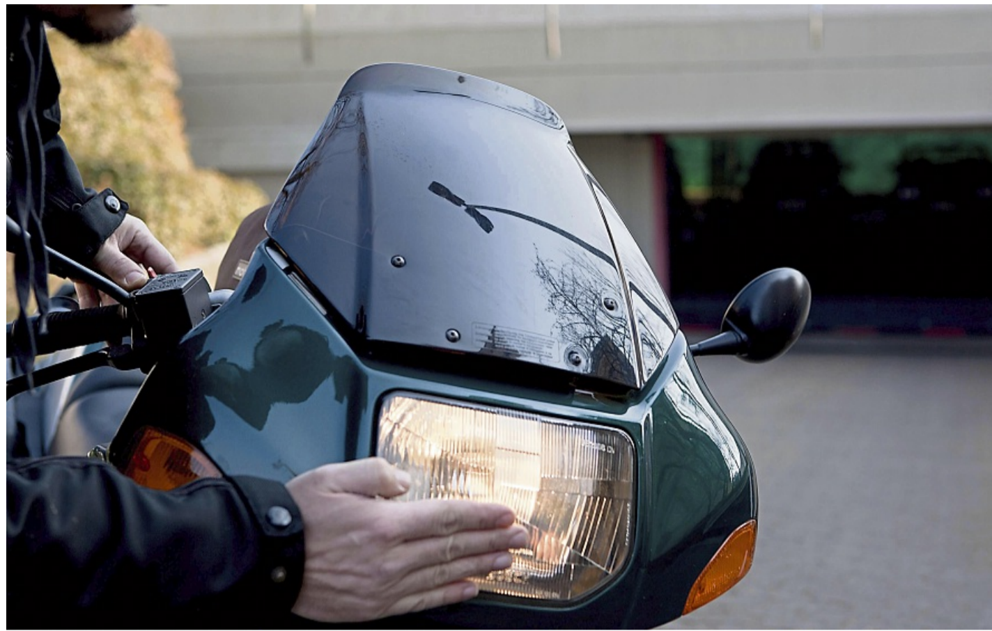
Saisonstart sicher angehen: Vor der ersten Ausfahrt im Frühjahr sollten Motorrad und Ausrüstung gründlich geprüft werden.

Motorradhelme müssen seit 2023 zudem eine neue Norm erfüllen (ECE 22.06). Auch wenn vorherige Helme nicht zwingend ersetzt werden müssen, lohnt laut GTÜ ein Wechsel, weil die neueren Helme einen besseren Schutz bieten. Generell sollte der Helm fest sitzen, ohne zu drücken, und sich beim Kopfschütteln kaum be-