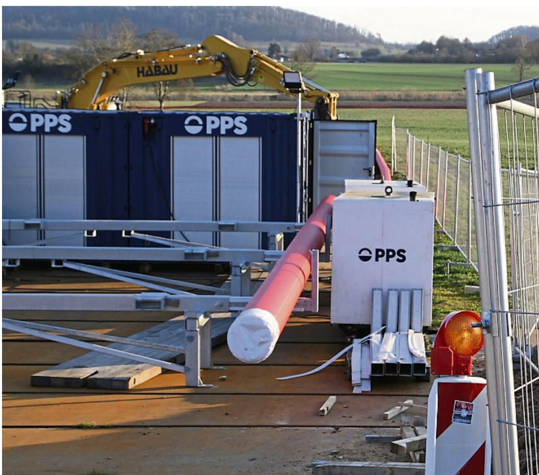
Unterhalb des Badestädter Schlosses: Dieses Rohr wird in Kürze die Rothesteinstraße überspannen, wofür auf beiden Seiten jeweils zwei Container aufeinander gestapelt wurden.