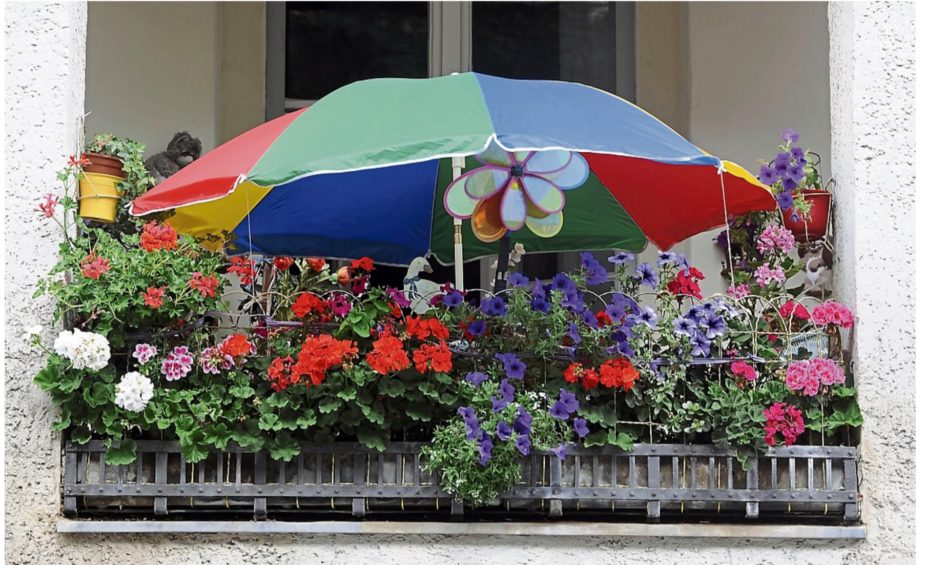
So schön bunt hier: In der Auswahl der Pflanzen sind Mieter nicht limitiert, solange sie Rücksicht auf die Nachbarn nehmen.

„Nein, ein pauschales mietvertragliches Verbot zum Aufstellen von Balkonpflanzen benachteiligt Mieter und Mieterinnen unangemessen und wird meist unwirksam sein“, sagt Pier. Balkonpflanzen aufzustellen, gehört zur üblichen mietvertraglichen Nutzung einer Wohnung. Auch die Hausordnung einer Wohnungseigentümergeinschaft darf die Freiheit des Einzelnen nicht in einem solchen Maß einschränken. Nur wenn andere Hausbewohner durch die Pflanzen erheblich beeinträchtigt oder bauliche Vorgaben ver-