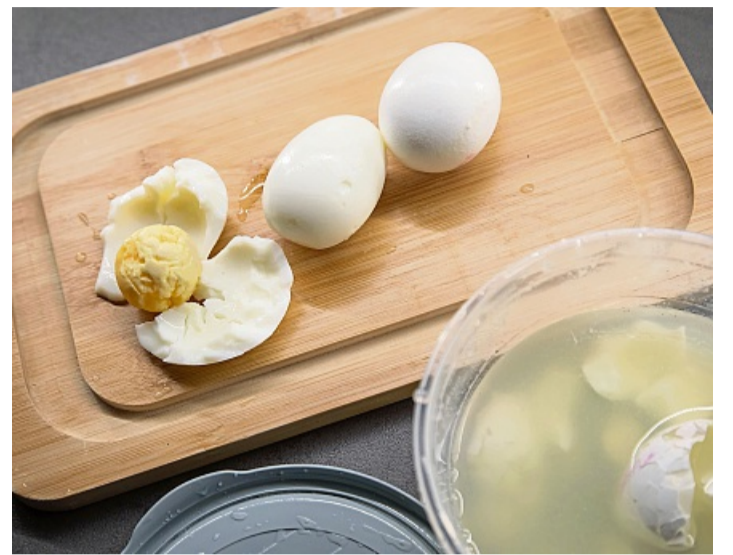
Gemischtes Fazit: Ein Ei ist kaputt, eins komplett geschält, und eins mit völlig intakter Schale.

Eier schneller pellen durch Schüttel-Trick