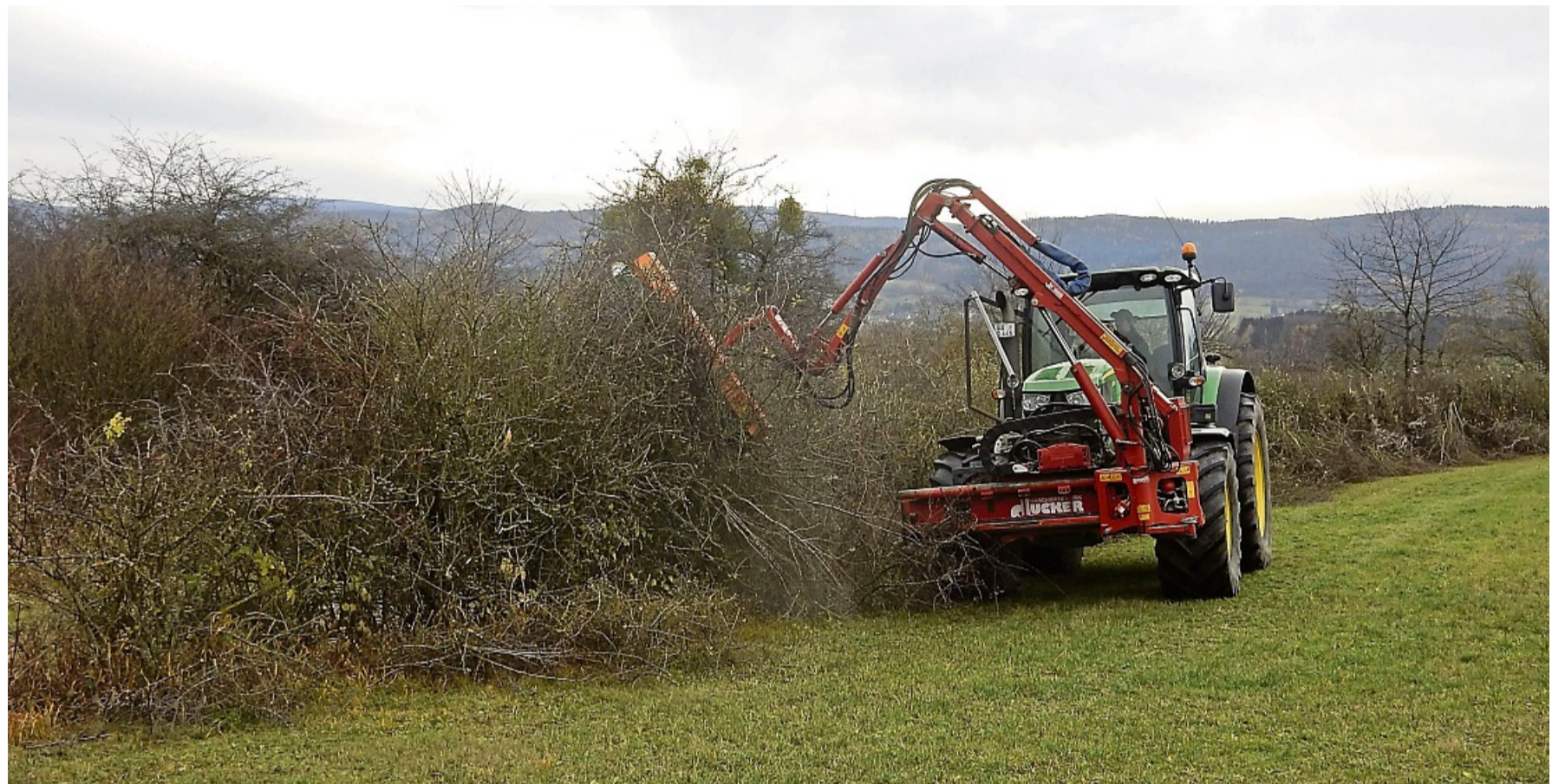
Schlepper bei der Heckenpflege: Nun müssen die Schnitтарbeiten erst einmal ruhen.

Betroffen seien vor allem Gehölze in der freien Landschaft, etwa Hecken, Bäume und andere Feldgehölze an Äckern und Wegen. Gerade sie hätten für zahlreiche Tierarten eine besondere Bedeutung als Nistplatz. In Ausnahmefällen könne ein Eingriff zulässig sein, etwa zur Gefahrenabwehr oder aus Gründen der Verkehrssicherheit. In solchen Fällen seien die Unteren Naturschutzbehörden der Landkreise die richtigen Ansprechpartner.