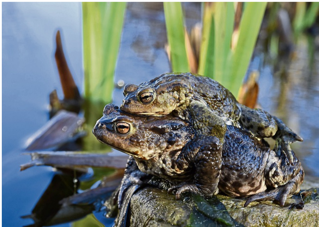
Mitfahrgelegenheit: Männliche Kröten lassen sich auf dem Weg zum Laichplatz von Weibchen tragen.

Calvi: Wachsen wilde Krokusse, Schneeglöckchen, Märzenbecher und Weidenkätzchen, können Hummeln dort eiweißreiche Blütenpollen und zuckerhaltigen Blütennektar naschen. Frühblüher wie Seidelbast, Sal-Weide und Lerchensporn helfen Zitronenfaltern im Frühling. Wer fruchttragende Wildsträucher wie Holunder, Faulbaum oder Weißdorn pflanzt und wilde Brombeerecken stehen lässt, bietet der Haselmaus Verstecke, Nistplätze und ein reiches Nahrungsangebot. Im Frühjahr ernährt sie sich von den Knospen. Um Fledermäuse zu unterstützen,