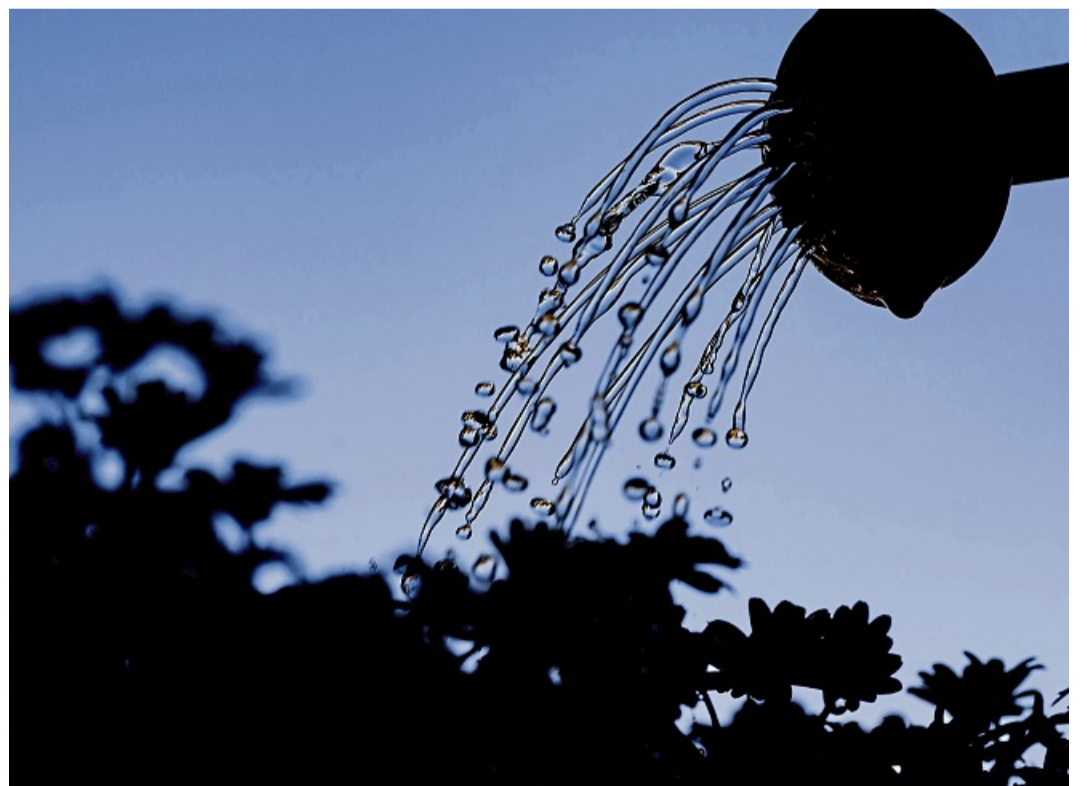
Gute Bewässerung: Gelegentlich vom Balkon tropfendes Gießwasser gilt als sozialadäquat.