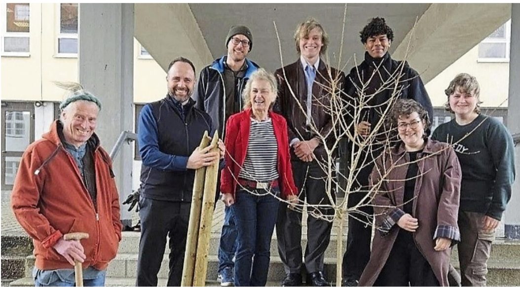
Mit dem Feldahorn auf dem Schulhof der JGS möchte die Schülervertretung ein Zeichen dafür setzen, dass Schulpolitik Veränderungen bewirken kann.

Gepflanzt wurde ein Feldahorn, ein noch junger, etwa personenhoher Baum. Die Pflanzung wurde durch eine Spende der Baumschule Wenk ermöglicht, die damit einen wichtigen Beitrag zur Realisierung des Projekts geleistet hat.