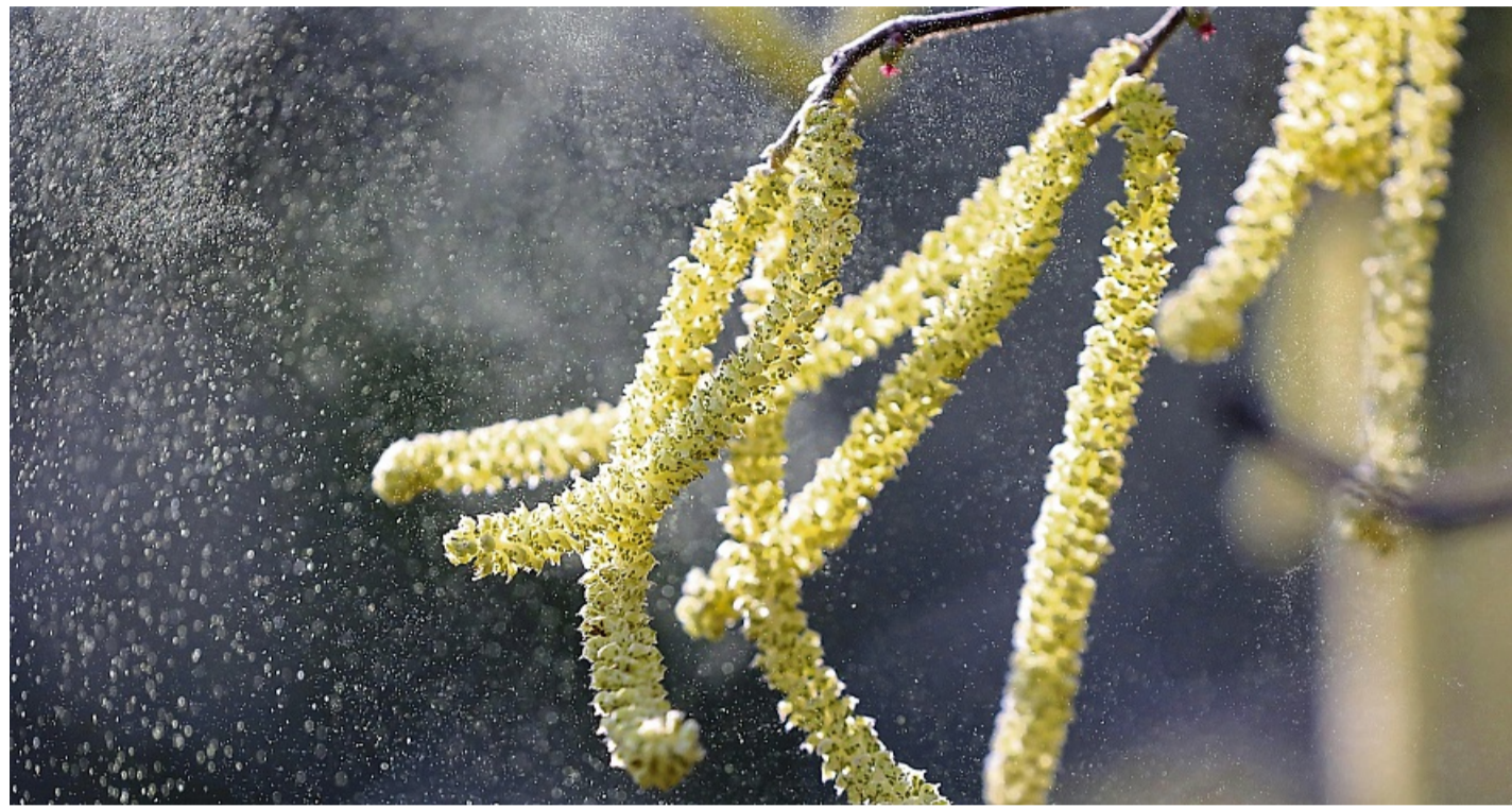
Pollenflugalarm in Hessen: Auch im Norden und Osten des Bundeslandes sind unter anderem Haselpollen auf dem Vormarsch.

Wer es sich leisten möchte – „das ist leider keine Kassenleistung“, bedauert Temole – dem empfiehlt sie außerdem eine