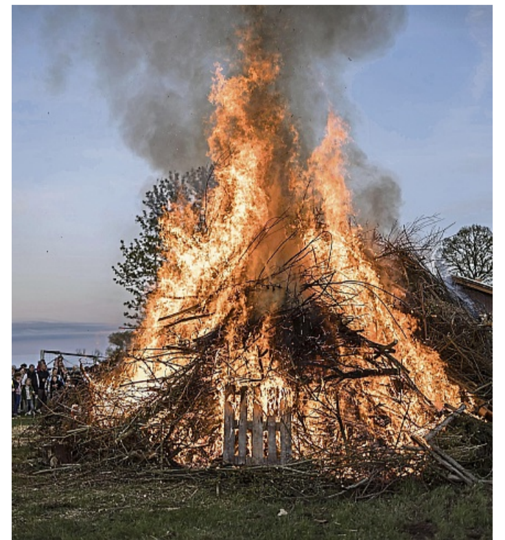
Das traditionelle Osterfeuer in Braach.