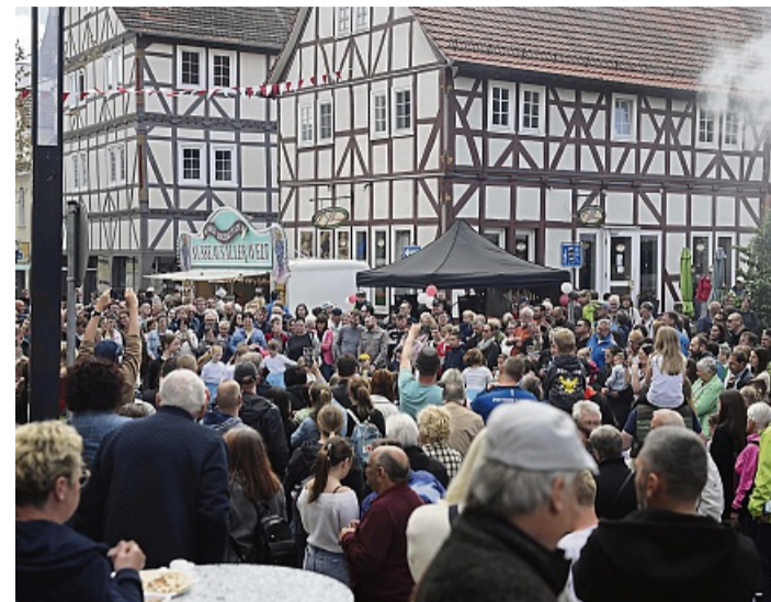
Zahlreiche Besucher werden zum Streetfood-Event in der Bebraer Innenstadt erwartet.

Bebra – In Bebra steigt am Samstag, 28. März, wieder Dampf auf. An diesem Samstag allerdings nicht aus einer Dampflok, wie noch am 14. März zu den Dampflokfahrten, sondern aus zahlreichen Grills in der Innenstadt. Die Stadtentwicklung Bebra lädt zum großen Anbraten, dem größten Streetfood-Event der Region, ein. Der Eintritt ist frei und das Angebot größer denn je. Lokale Gastronomiebetriebe und