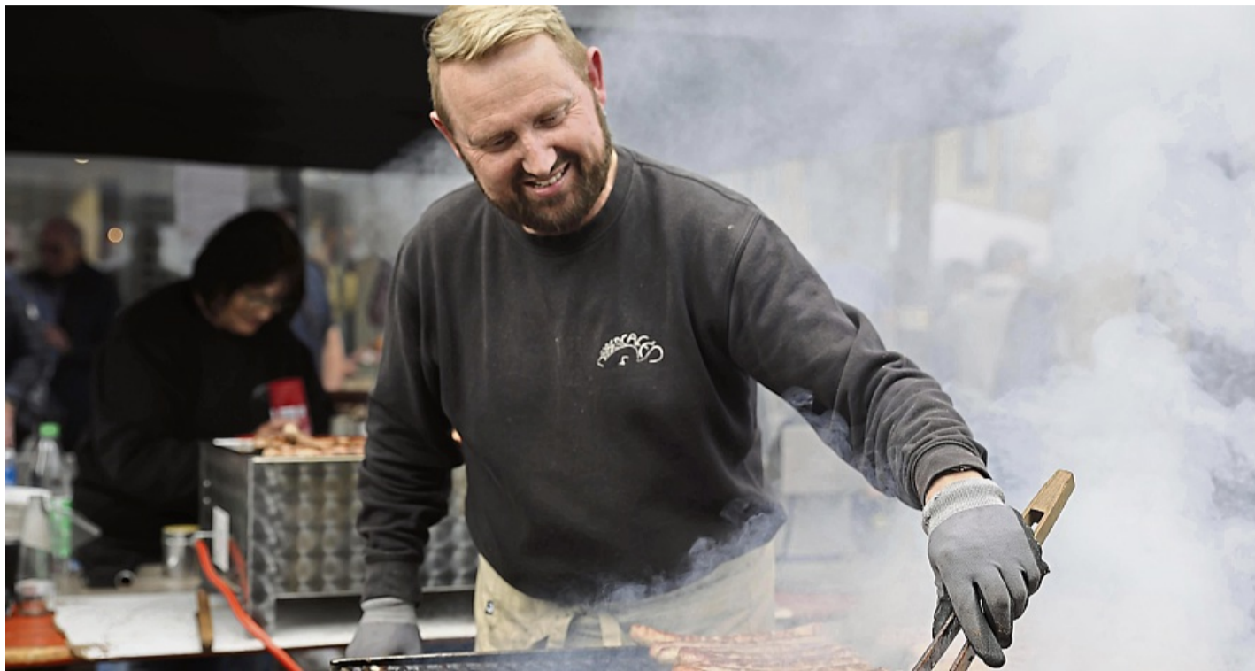
Beim Anbraten in Bebra kommen Grillfans diesen Samstag auf ihre Kosten.

Streetfood-Event mit 30 Anbietern findet am Samstag in der Innenstadt statt