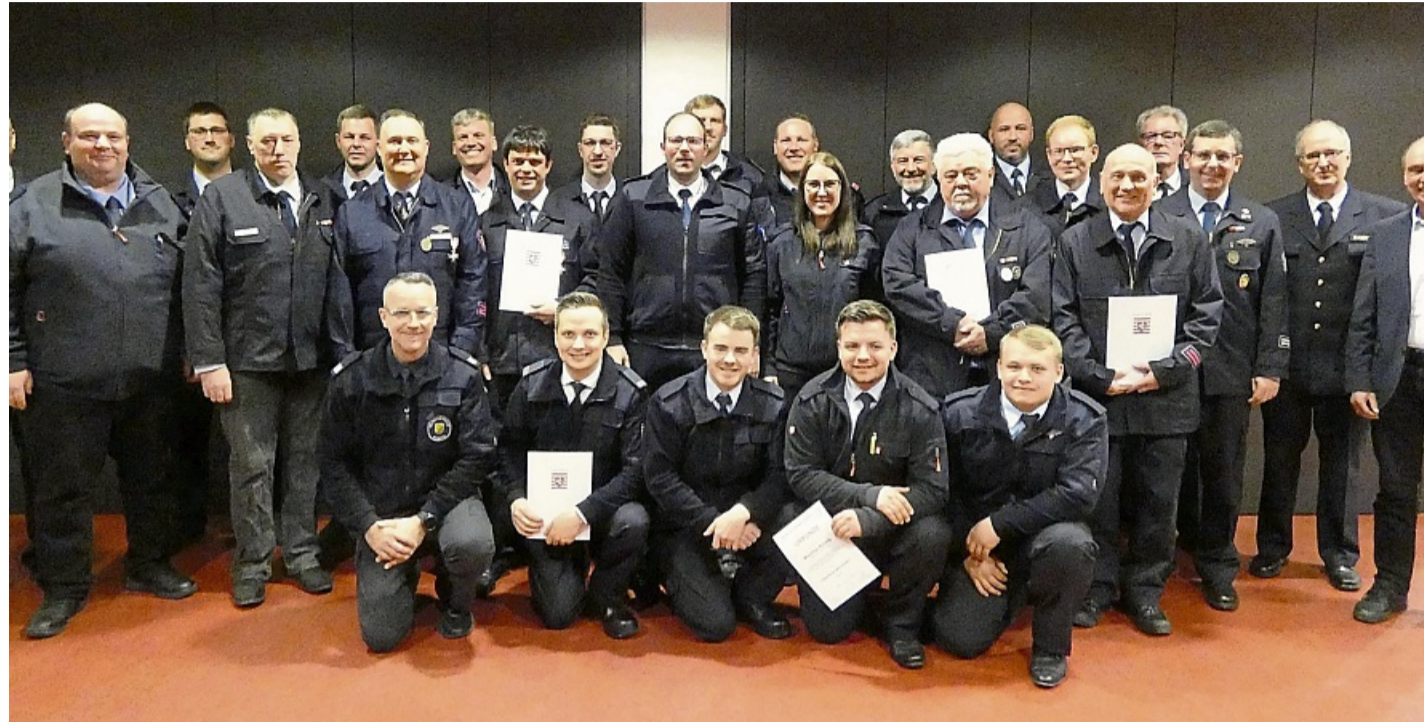
Ehrungen und Beförderungen bei der Jahreshauptversammlung der Wildecker Feuerwehren: Auf unserem Foto sind die ausgezeichneten Einsatzkräfte mit Vertretern aus Gemeinde und Feuerwehrführung zu sehen.

Die Arbeit der Feuerwehren gehe aber weit über die Gefahrenabwehr im Einsatz hinaus. Viele Stunden würden in Ausbildung, Lehrgänge und Übungen investiert, ebenso in die Wartung der Technik. Das sei die Grundlage dafür, dass im Ernstfall alles reibungslos funktioniere. Die Gemeinde Wildeck sei sich der Aufgabe bewusst, bestmögliche Rahmenbedingungen für die Feuerwehren zu schaffen. Dazu gehörten Ausgaben, die Investitionen in die Sicherheit der Bürgerinnen und Bürger seien. Becker kündigte für dieses Jahr eine neue Tragkraftspritze für die Feuer-