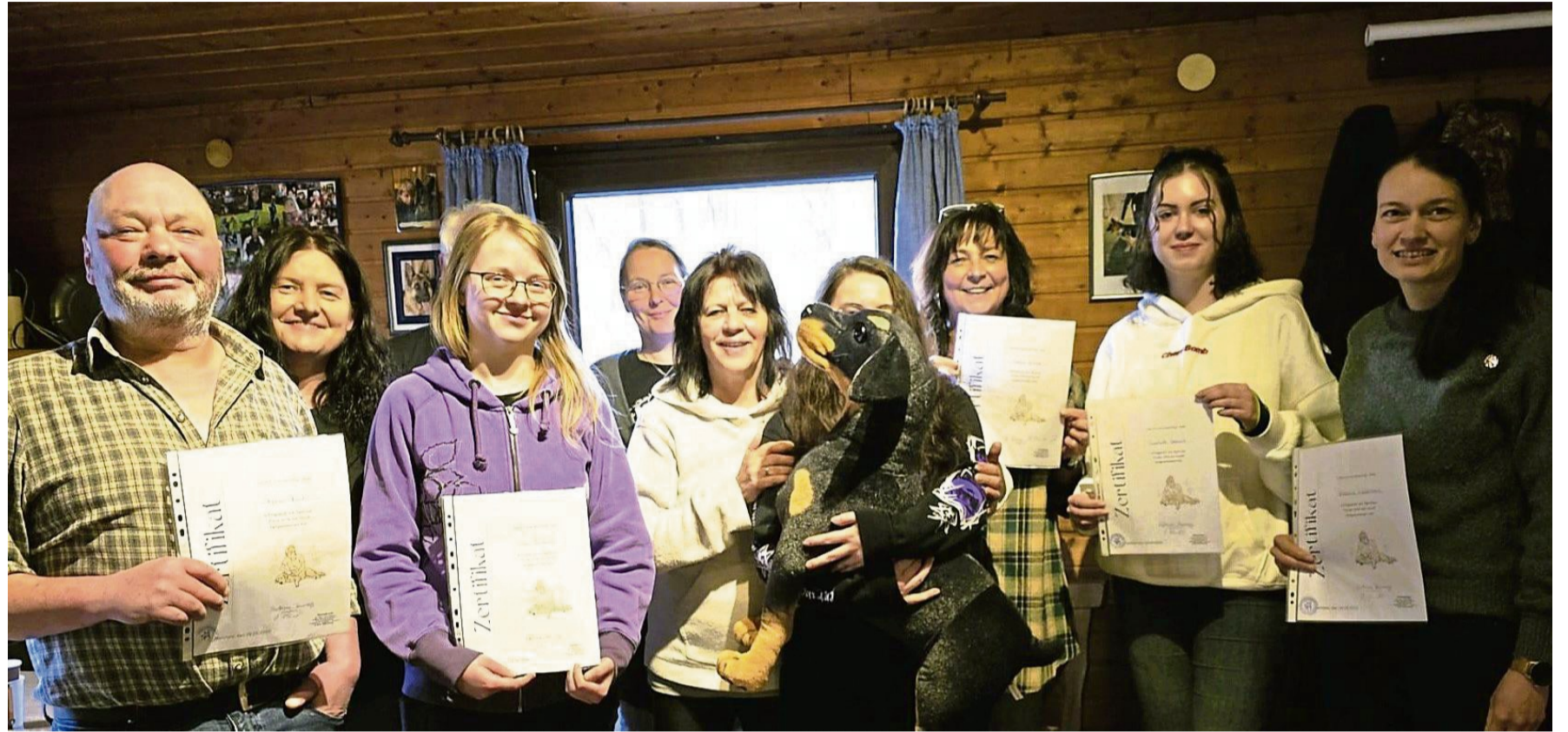
Mit Urkunden: Teilnehmer des Kurses Erste Hilfe am Hund beim Hundeverein Oberes Edertal.

Zunächst wurde im theoretischen Teil das Vorgehen behandelt – zum Beispiel bei Verletzungen, Vergiftungen oder Schock eines Hundes. Die Mittagspause bot Gelegenheit zum Austausch mit den Referenten und den anderen Kursteilnehmern, was intensiv genutzt wurde. Danach ging es mit dem praktischen Teil weiter. Dabei konnte jeder Teilnehmer unter Anleitung an einem Hundedummy üben, Verbände richtig an den unterschiedlichen Stellen am Hundekörper anzulegen. Auch die korrekt durchgeführte Reanimation bei kleinen und großen Hunden war ein wichtiger Punkt. Da das Vereinsheim des Hundevereins nur begrenzt Platz bietet, soll