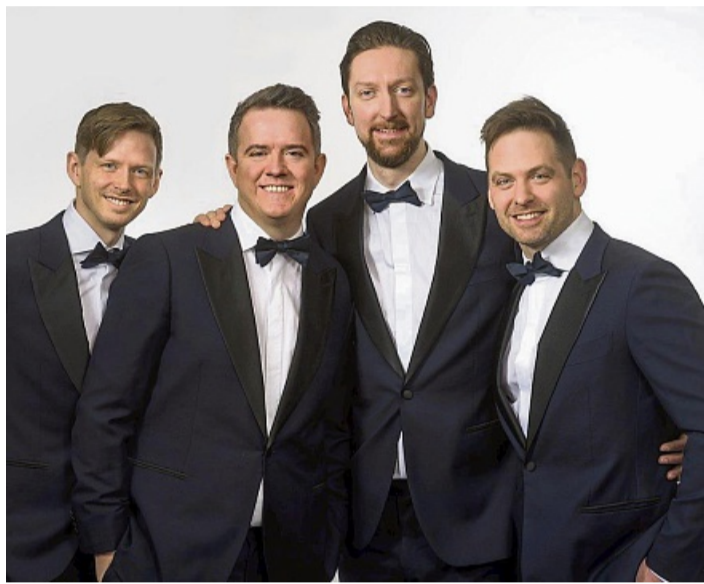
Mit „Good Vibrations“ kommen die Ringmasters nach Frankenberg und bieten Barbershop-Klassiker, Popsongs und eigene Lieder.