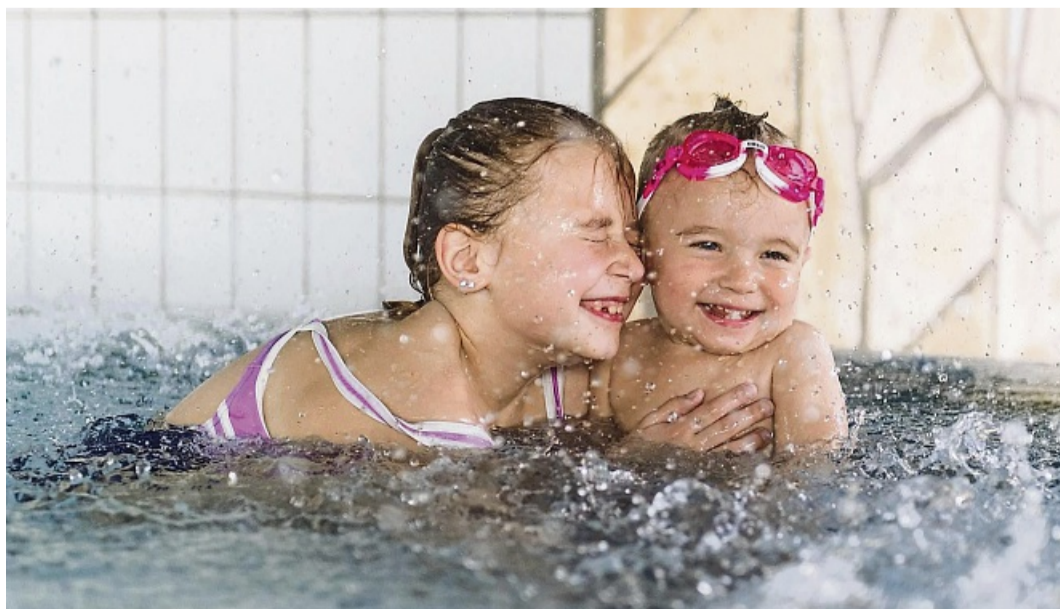
Geschwisterbeziehungen schwanken ständig zwischen Nähe und Abgrenzung, Konflikt und Versöhnung.