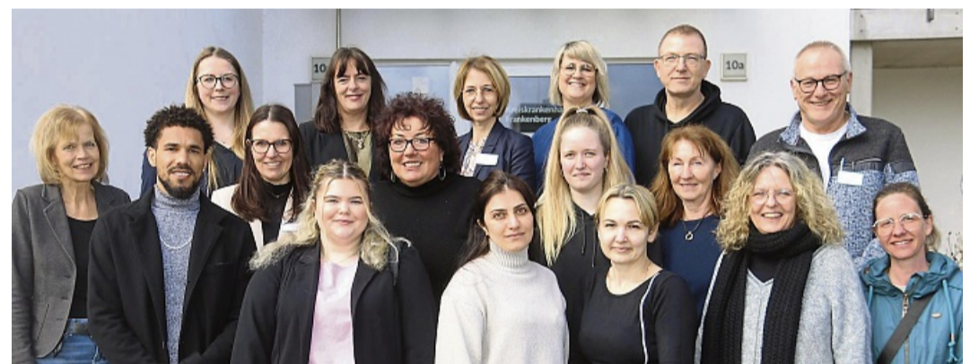
Am Schulzentrum für Pflegeberufe in Frankenberg haben sechs Auszubildende ihre Prüfung in der Krankenpflegehilfe bestanden. Das Bild zeigt sie mit ihren Lehrkräften und dem Führungspersonal des Krankenhauses.