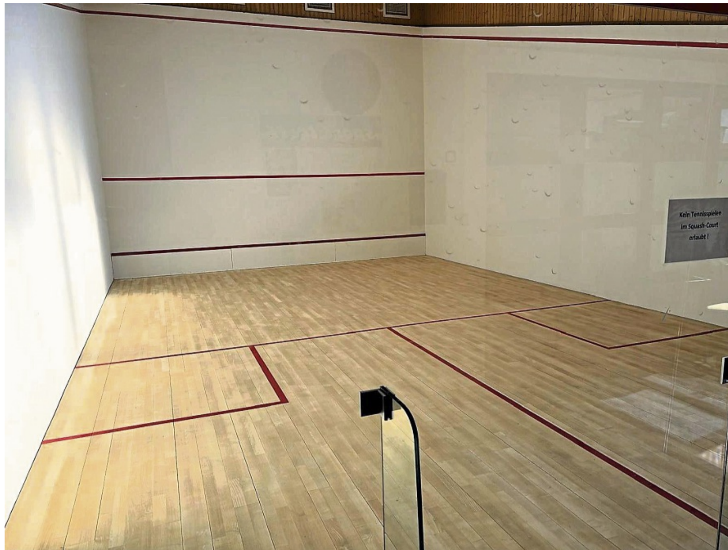
Der Squash-Platz in der Tennis- und Squash-Halle Frankenau.

Ein Blick auf die Situation in Hessen unterstreiche dieses Potenzial: Auf der Internetseite des Hessischen Squash-Verbandes seien derzeit lediglich 18 Vereine hessenweit gelistet. In Waldeck-Frankenberg gebe es