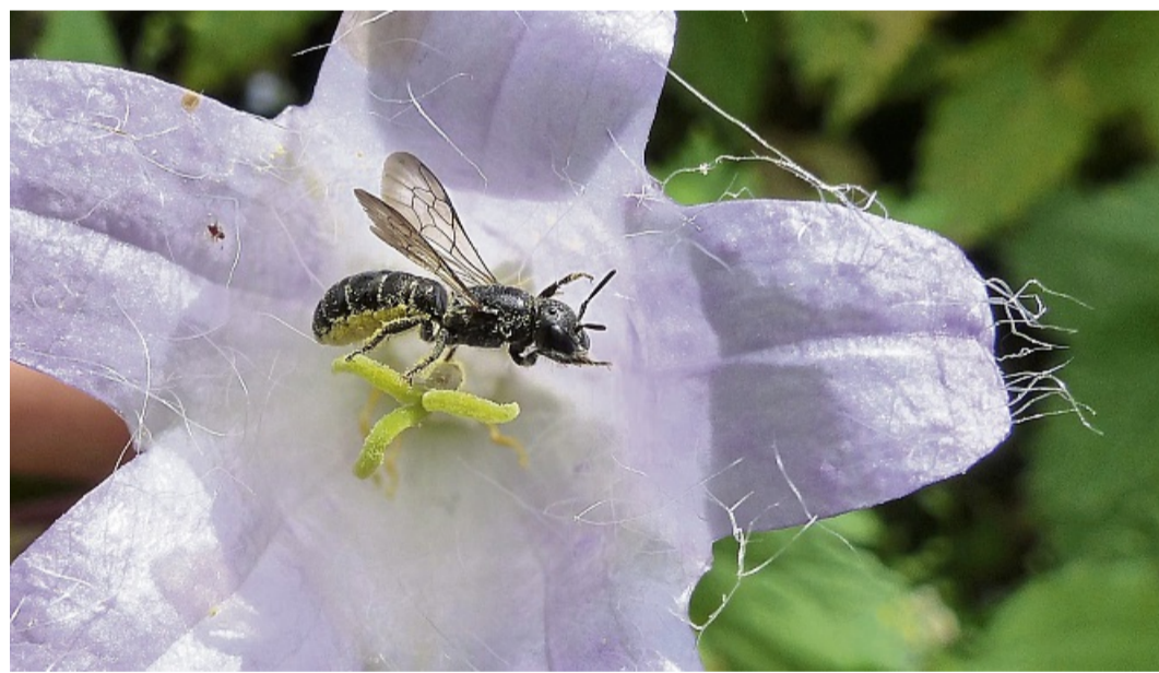
Die Glockenblumen-Scherenbiene ist eine der kleinen Bestäuberarten, deren Zahl bei der Nabu-Aktion ermittelt wird.

200 Euro können diejenigen gewinnen, die die meisten Wildbienen oder solitären Wespen in ihrer Nisthilfe und auf ihrer Wiese, im Garten oder an einer Hecke beherbergen. Interessierte können bei Angela Odenhardt (angelaodenhardt@t-online.de, Tel. 05621/9644380) für 10 Euro eine genormte Nisthilfe bestellen und auf der eigenen Fläche aufstellen. Mit der Nisthilfe erhalten die Teilnehmer eine Anleitung,