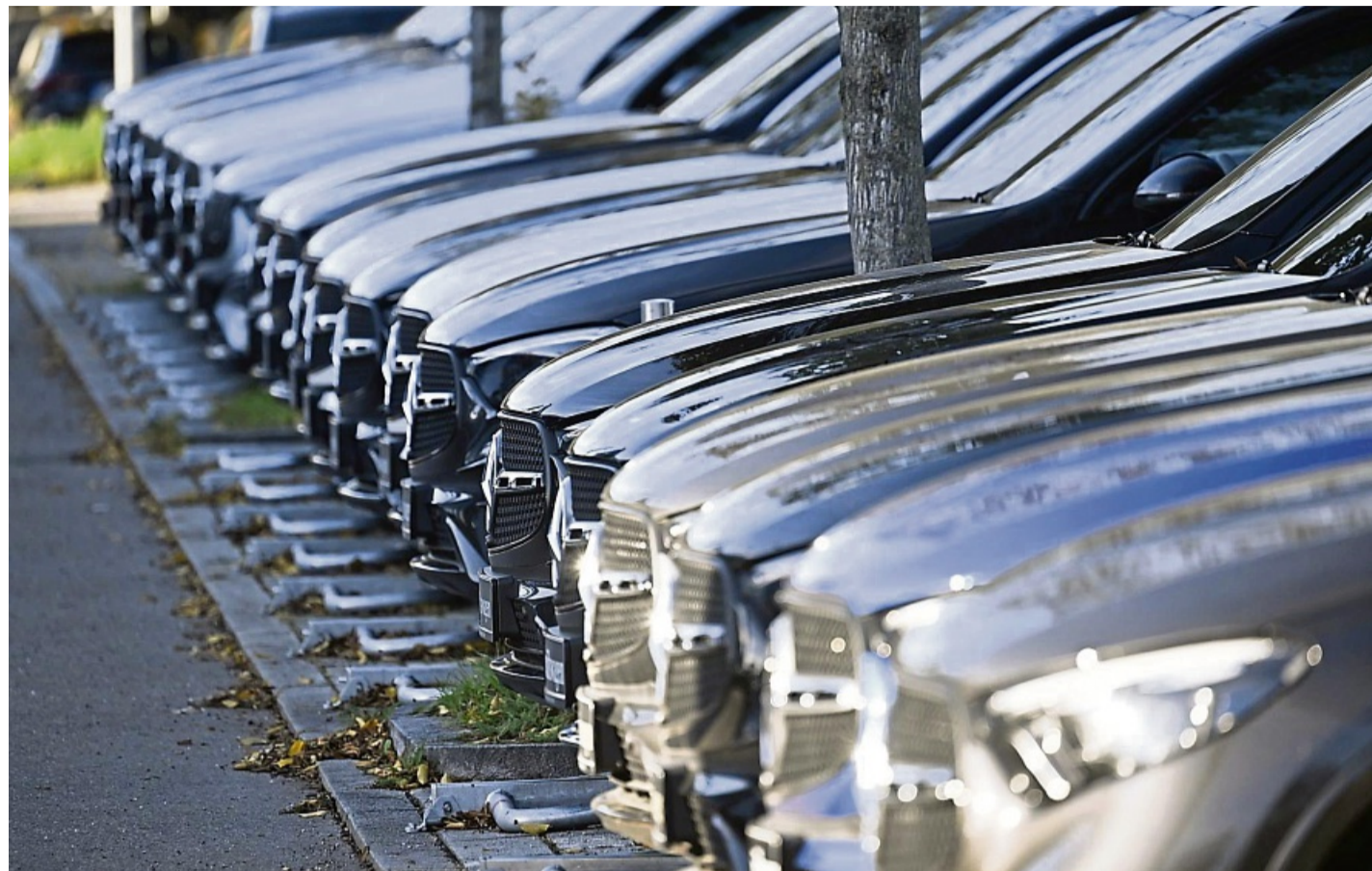
Nachfragen lohnt sich: Laut ADAC-Studie sind bei vielen Autohändlern Nachlässe im vierstelligen Bereich möglich.