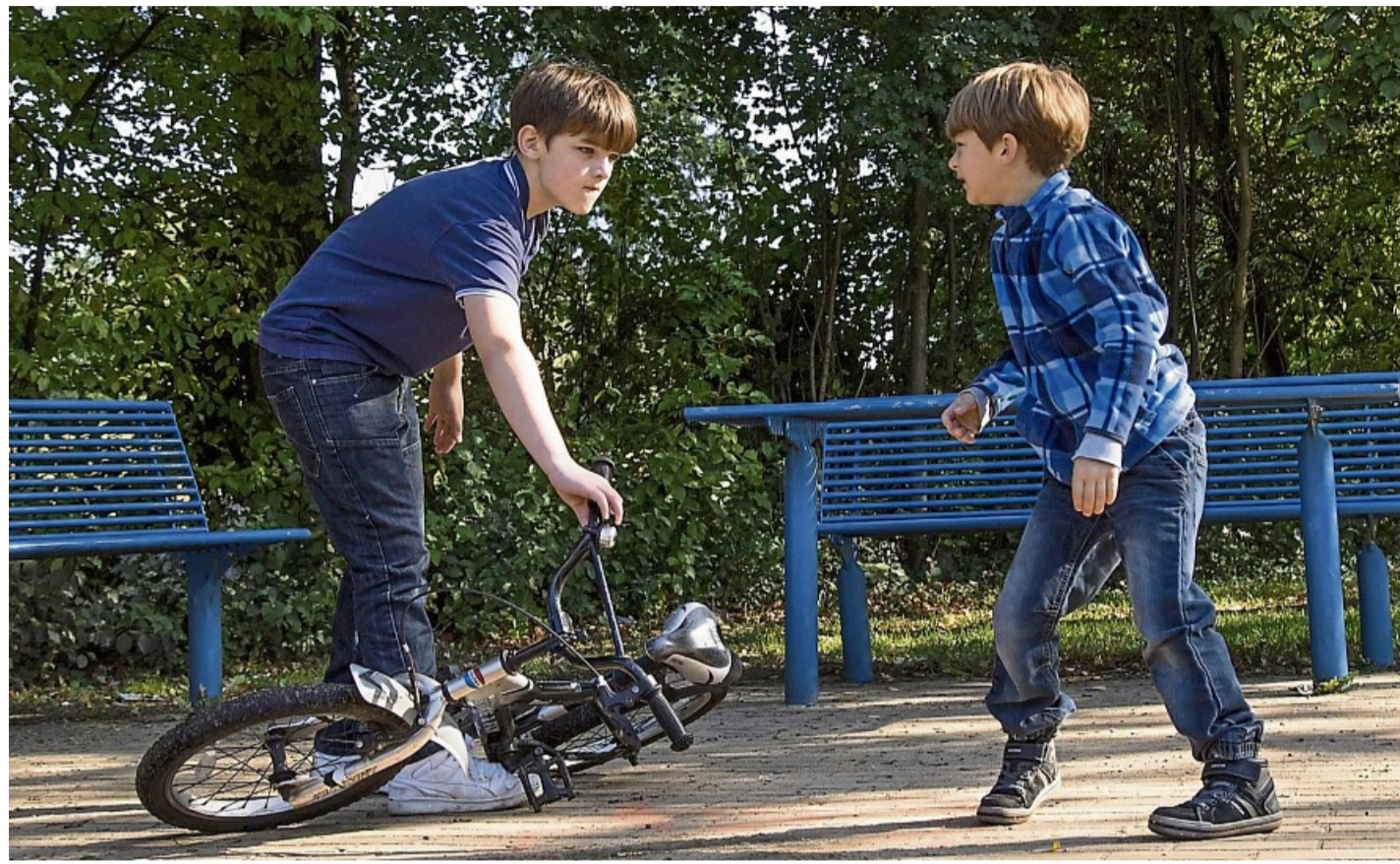
Streit gehört bei vielen Geschwistern zum Alltag dazu – und ist ganz normal.

Inga Pinhard: Ja, Konkurrenz ist normal und das ist auch wichtig für die Entwicklung von Kindern. Oft gibt es Rivalitäten, Konkurrenz und gleichzeitig auch das Umeinanderkümmern. Das alles gehört zu einer Geschwister-Beziehung. Streit haben, Streitkultur entwickeln kann man mit Geschwistern ganz wunderbar lernen. Das sollten Eltern auch steuern. Wichtig ist, dass Eltern Kindern Spielräume lassen, diese Konflikte alleine zu bewältigen, und gleichzeitig ohne Bedingungen für sie da sind. In dem Moment, in dem das Wohl, also die körperliche und seelische Unversehrtheit eines Kindes nicht mehr gewährleistet ist, müssen Eltern eingreifen. Dabei ist Streit oft altersabhängig. In einem bestimmten Alter versteht man sich besser, dann wieder schlechter, dann