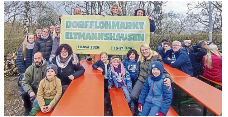
Freuen sich auf viele Besucher und hoffentlich gutes Wetter: das Organisationsteam des ersten Dorfflohmarktes von Eltmannshausen.

Eltmannshausen lädt zum ersten großen Dorfflohmarkt ein