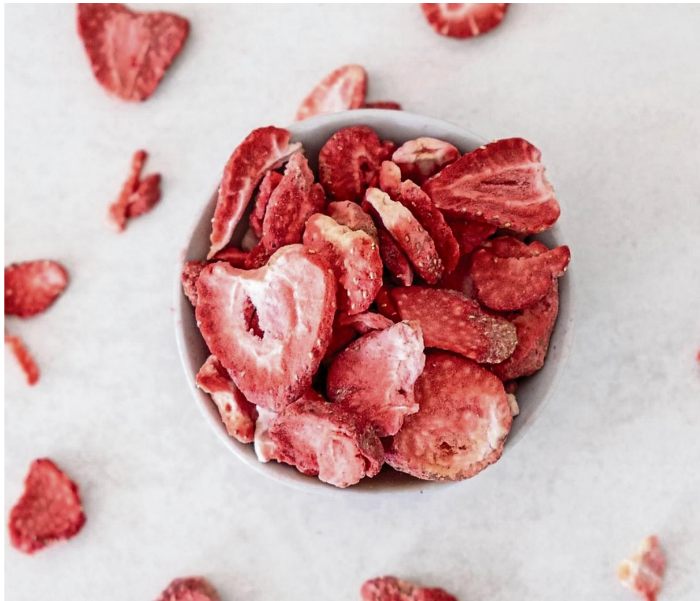
Knusprige Zeitkapseln: Gefriergetrocknete Früchte bewahren Geschmack, Farbe und Vitamine, und eignen sich perfekt für den Genuss außerhalb der Obstsaison.

Beim Gefrierdörren hingegen wird den Fruchtstücken nach dem Einfrieren durch Unterdruck im Vakuum das Wasser entzogen. Das dauert mehrere Stunden. Dabei überspringt das gefrorene Wasser