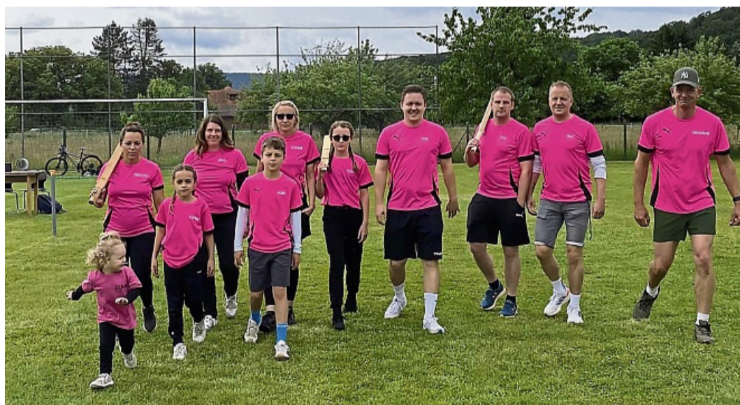
So sehen Sieger aus: Dieses Team hat im Vorjahr beim Schlagball-Turnier in Völkershäusen gewonnen.

Aus dieser Tradition heraus entstand die Idee, ein festes Turnier zu organisieren. „Wir haben uns dann überlegt, aus der