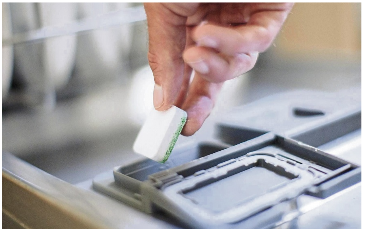
Mittelwechsel: Wenn das Geschirr unangenehm riecht, kann man zunächst ein anderes Reinigungsprodukt testen.

Ein Tipp von Bernd Glassl: hochwertige Gläser als Erstes ausräumen. Denn: „Der Dampf kann die Oberfläche angreifen, und die Gläser können mit der Zeit trüb werden.“