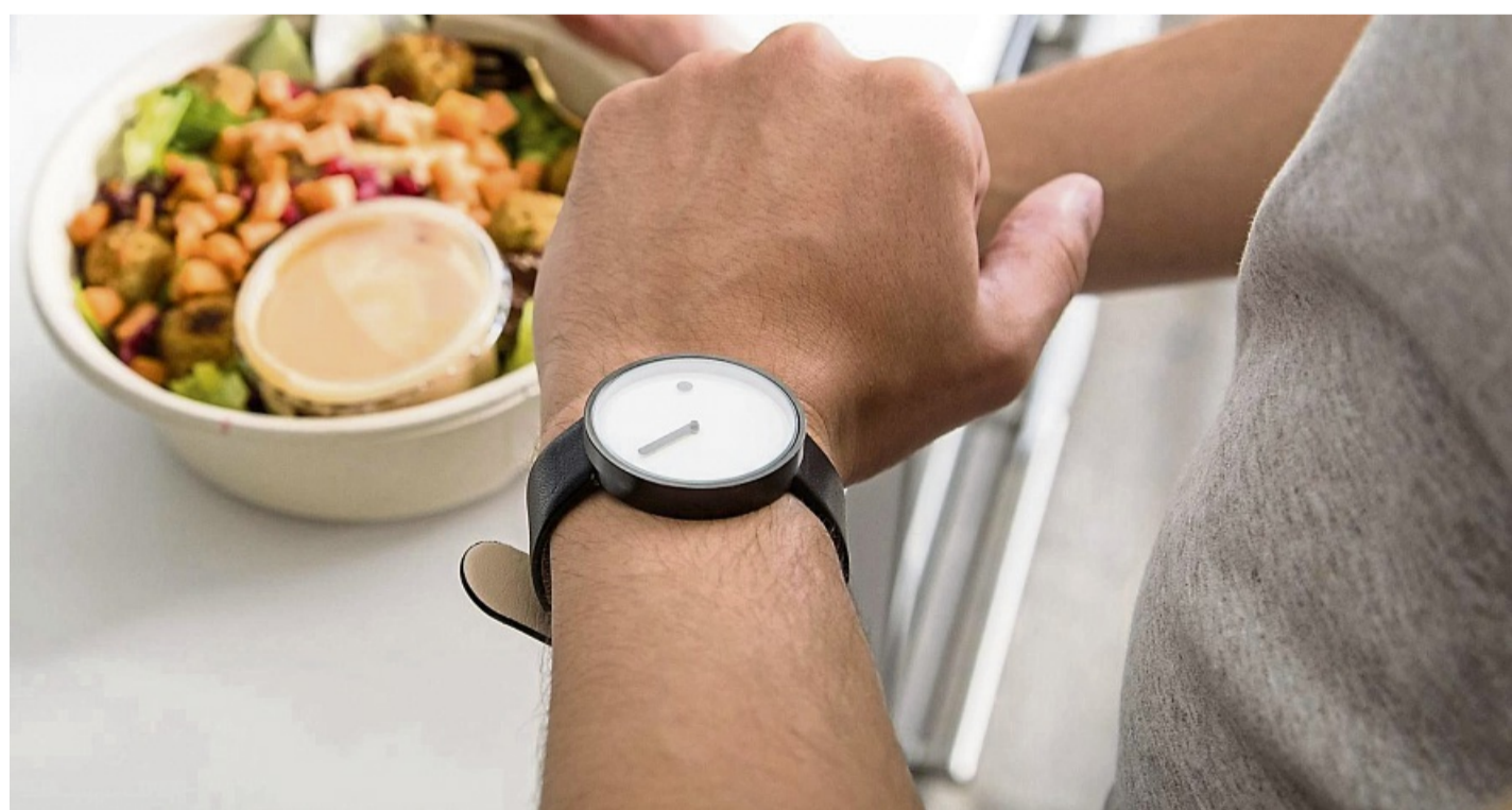
Aus gesundheitlichen Gründen ist Fasten höchstens für gesunde Erwachsene mit stabilem Essverhalten geeignet.

Problematisch wird es vor allem dann, wenn Fasten stark mit Diätgedanken verknüpft ist. „Menschen, die ohnehin zu restriktiven Essmustern oder häufigen Diäten neigen, würden wir eher davon abraten“,