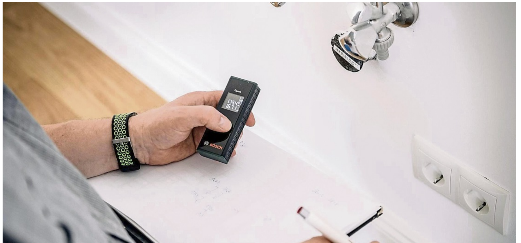
Laser-Entfernungsmessgeräte messen Distanzen in Sekunden aus.

Für den Außeneinsatz sollte man auf ein stoßfestes Gehäuse achten – und auf einen passenden Staub- und Spritzwasserschutz. Der Tüv Süd rät zu einer Schutzklasse von mindestens