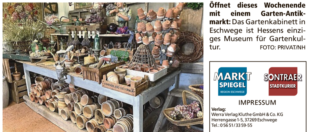
Öffnet dieses Wochenende mit einem Garten-Antikmarkt: Das Gartenkabinett in Eschwege ist Hessens einziges Museum für Gartenkultur.

Saisonstart im Gartenkabinett am Freitag und Samstag