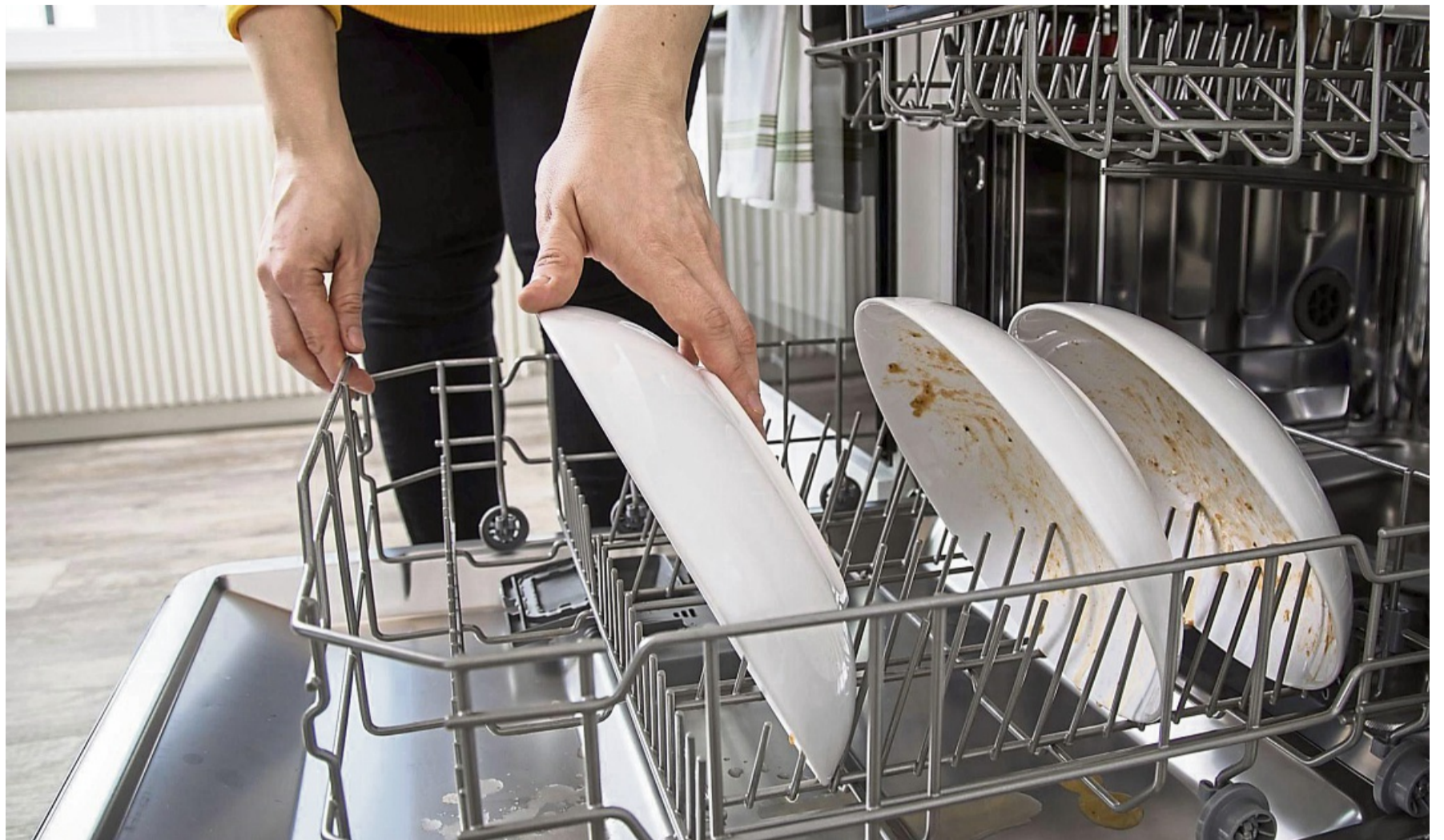
Voll darf die Maschine ruhig werden: Soll alles wirklich sauber werden, kommt es vor allem aufs richtige Einräumen an.