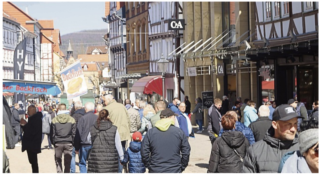
Gut besucht: In 2025 haben viele Menschen die Gelegenheit genutzt, um während der EAA durch die Innenstadt zu bummeln.