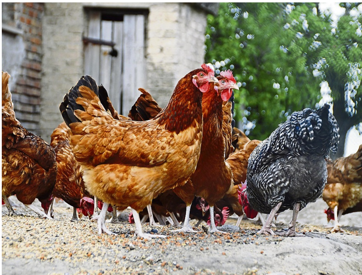
Impfempfehlung: Der Landkreis reagiert auf das aktuelle Infektionsgeschehen der Geflügelpest in Brandenburg und Bayern mit einer neuen Allgemeinverfügung.

Das Landwirtschaftsministerium appelliert vorsorglich an die Geflügelhalter, insbesondere Hühner- und Putenbestände wie rechtlich vorgesehen regelmäßig zu impfen und die Biosicherheitsmaßnahmen streng einzuhalten. Eine frühzeitige und regelmäßige Impfung sowie konsequente Hygienemaßnahmen sind entscheidend, um die Ausbreitung der Newcastle-Krankheit zu verhindern. Wirksame Biosicherheitsmaßnahmen sind laut Tierseuchenexperten die strikte Trennung von Straßen- und Stallkleidung, die Zugangssi-