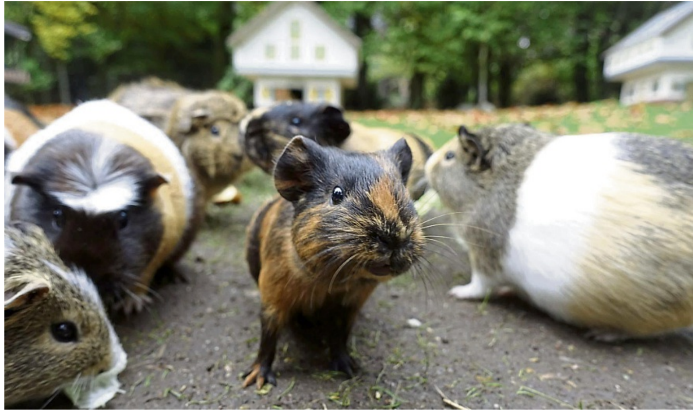
In guter Gesellschaft: Meerschweinchen sollten mindestens zu dritt gehalten werden.