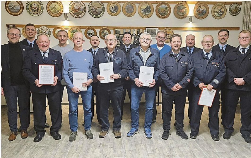
Die geehrten Mitglieder und die neue Vorstandsmitglieder sowie Ehrengäste der Jahreshauptversammlung.

Im Rahmen der Versammlung wurden außerdem mehrere Mitglieder für ihre langjähri-