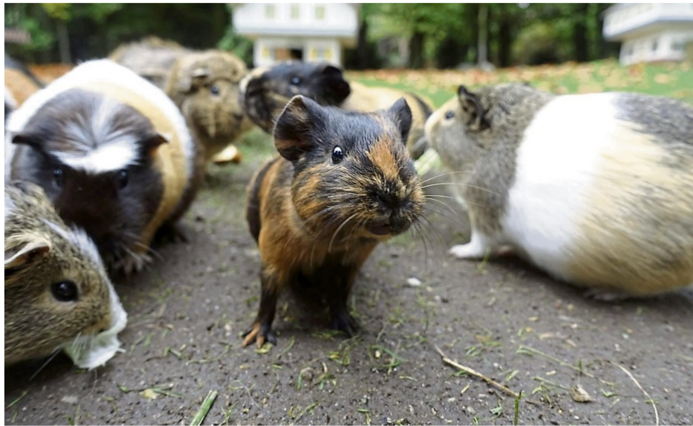
In guter Gesellschaft: Meerschweinchen sollten mindestens zu dritt gehalten werden.