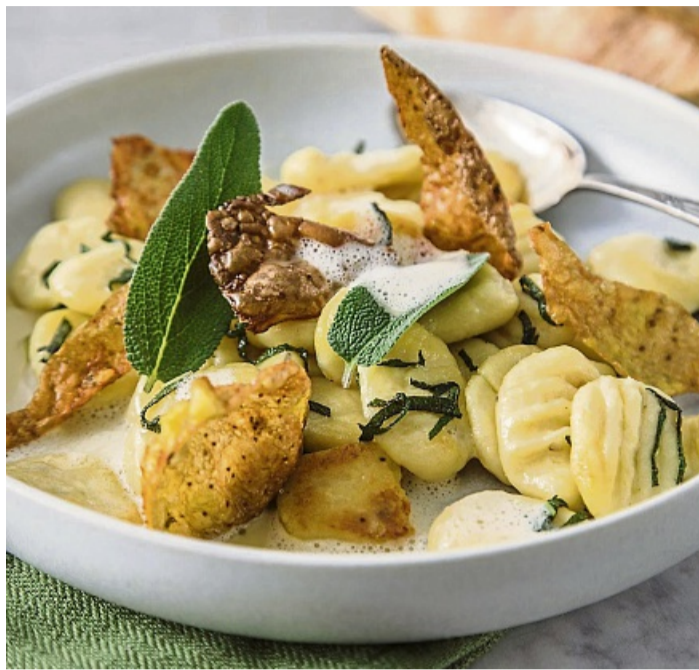
Mediterraner Genuss: Die Mischung aus Salbei und Butter passt perfekt zu Gnocchi, und sorgt für ein aromatisches, feines Geschmackserlebnis.

Zudem macht die Heilpflanze aufgrund ihrer ätherischen Öle das Essen bekömmlicher, so das BZfE. Daher passt das Ge-