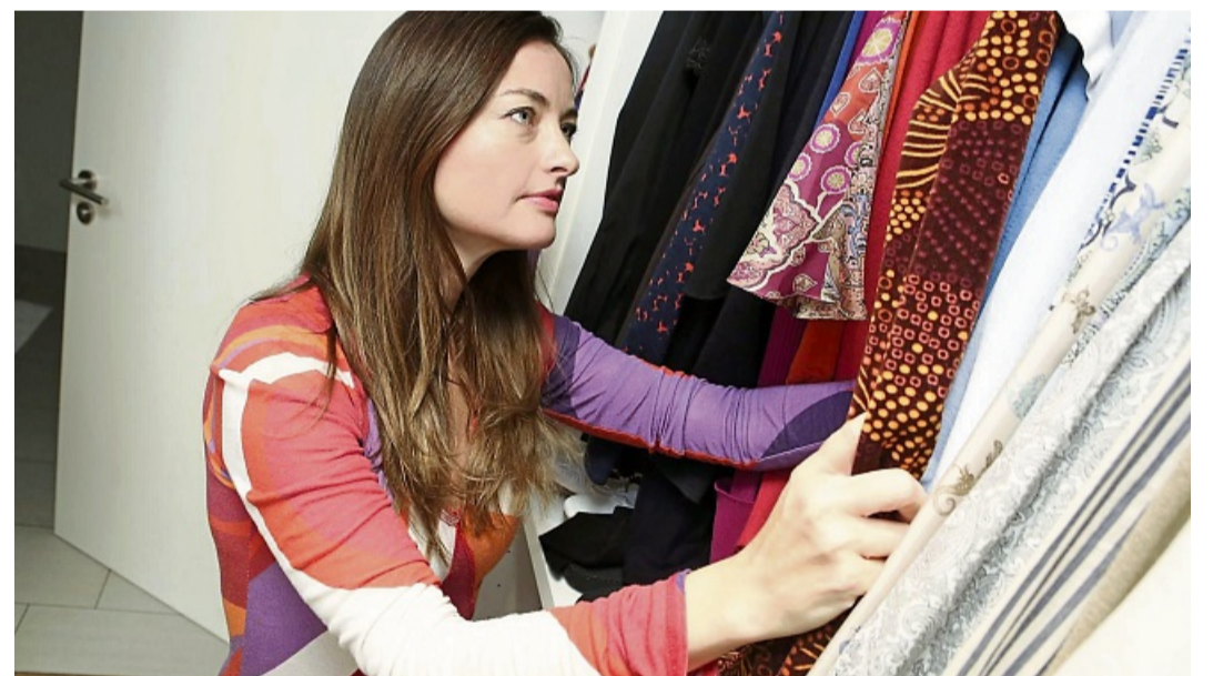
Mit speziellen Sommersituationen im Kopf kann man den Ist-Bestand im Kleiderschrank besser einschätzen und weiß, welche Stücke noch fehlen.

Urlaub, Arbeitsanlässe, Festivals: Ihr Terminplan für den Sommer ist voll – doch der Kleiderschrank zu leer? Eine Stilberaterin weiß Rat.