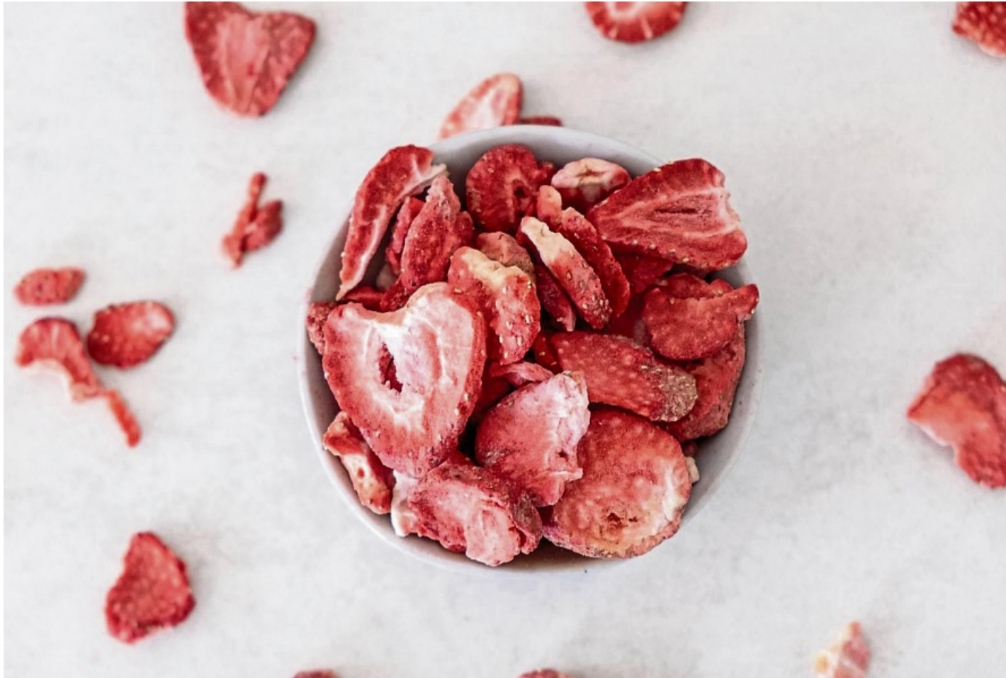
Knusprige Zeitkapseln: Gefriergetrocknete Früchte bewahren Geschmack, Farbe und Vitamine, und eignen sich perfekt für den Genuss außerhalb der Obstsaison.