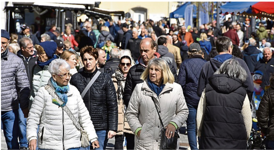
Großer Andrang: Viele Besucherinnen und Besucher werden auch an diesem Wochenende beim Frühlingsfest der Hanse in der Korbacher Fußgängerzone erwartet.

Das Hilfswerk LOGOS ist in der Region unter anderem durch die Ziegenspendenaktion „Määähhyr Christmas“ sowie die Weihnachtspäckchen-Aktion „Ein Päckchen der Freude“ bekannt. Seit der Gründung am 2. April 2011 engagiert sich LOGOS für Menschen in Not und verbindet dabei praktische Hilfe zur Selbsthilfe mit seelsorgerlicher Begleitung.