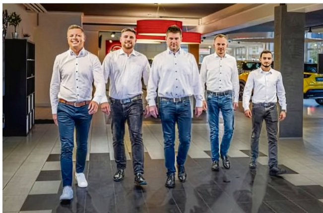
Ihr Ankaufteam in Korbach.

„Unser Ankaufangebot wird Ihnen schriftlich aus-