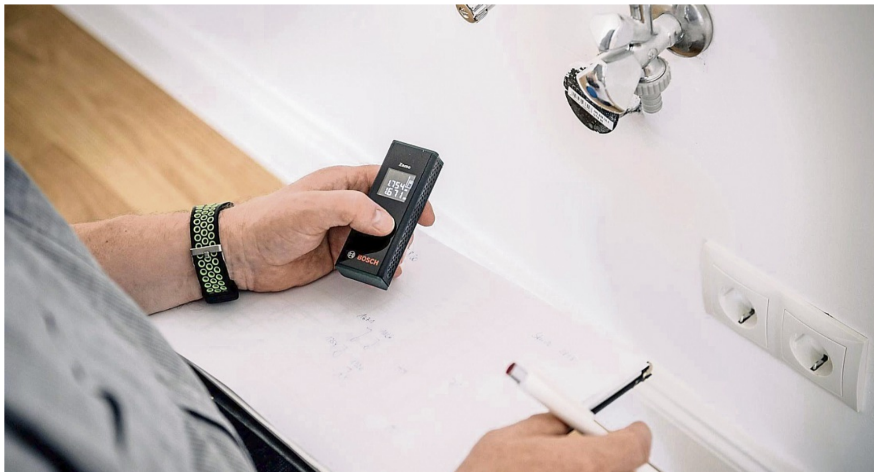
Laser-Entfernungsmessgeräte messen Distanzen in Sekunden aus.

Die entsprechenden Geräte seien langlebiger und lieferten