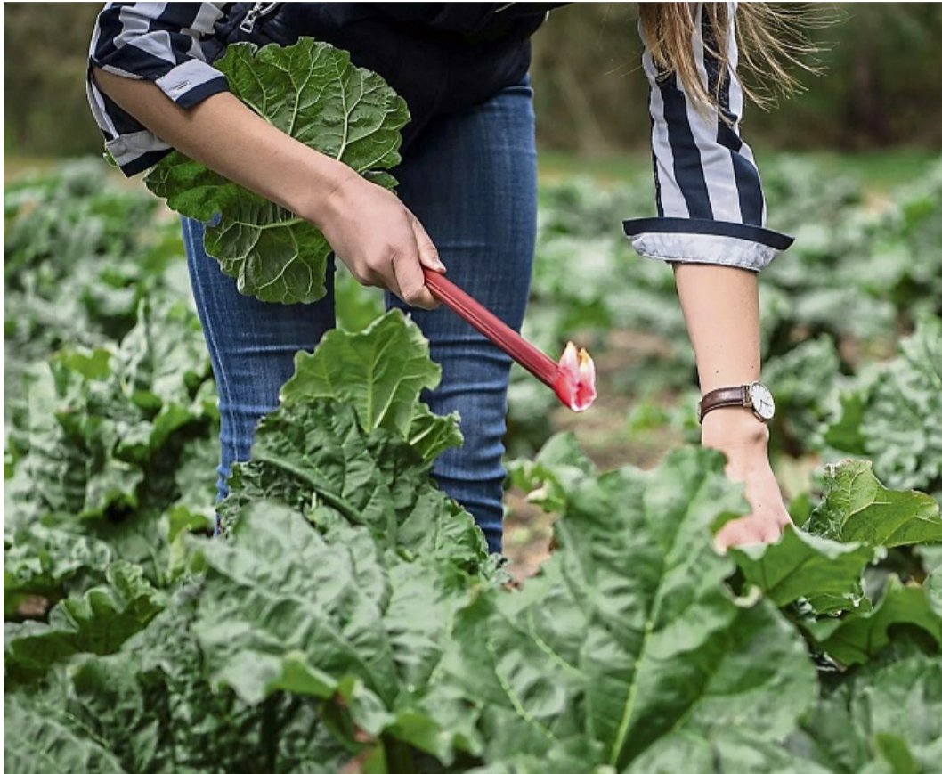
Richtig ernten: Die Stangen des Rhabarbers sollten vorsichtig herausgedreht werden.

Kompott, Kuchen oder Crumble mit Rhabarber aus dem Garten: All das kommt bald wieder auf den Tisch.