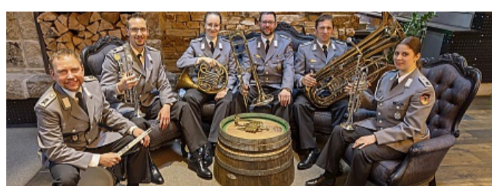
Das Kammerensemble des Heeresmusikkorps Kassel gastiert im Marstall von Hof Camp in Dalwigksthäl.