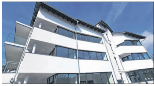
Ansicht des neuen Mehrfamilienhauses Auf dem Hecken in Bremthal.

Die Bücherei in Ehlhalten öffnet dienstags von 16 bis 17.30 Uhr – am ersten Dienstag im Monat Vorlese- und Bastelnachmittag. Die Bücherei in Niederjosbach öffnet dienstags von 16 bis 17 Uhr.