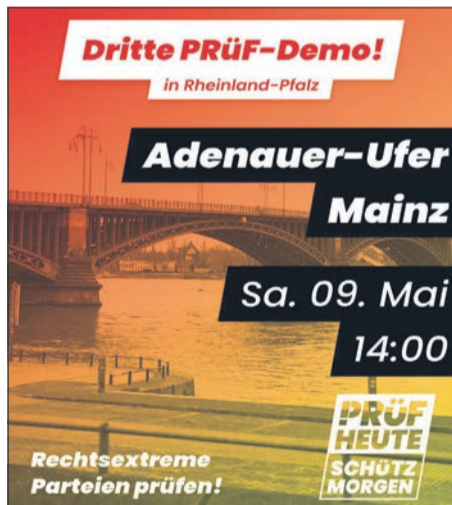
Für die zweite Prüf-Demo am 9. Mai in Mainz will Lünenbürger keinen Plakatierungsantrag stellen, im Juni will sie es erneut versuchen.

Sie hofft allerdings, dass die Stadt einlenkt und ihre Sondernutzungssatzung überarbeitet. Doch bevor eine juristische Bewertung der Satzung vorliegt, wird die Stadt wohl kaum eine Ausnahme genehmigen. bpa