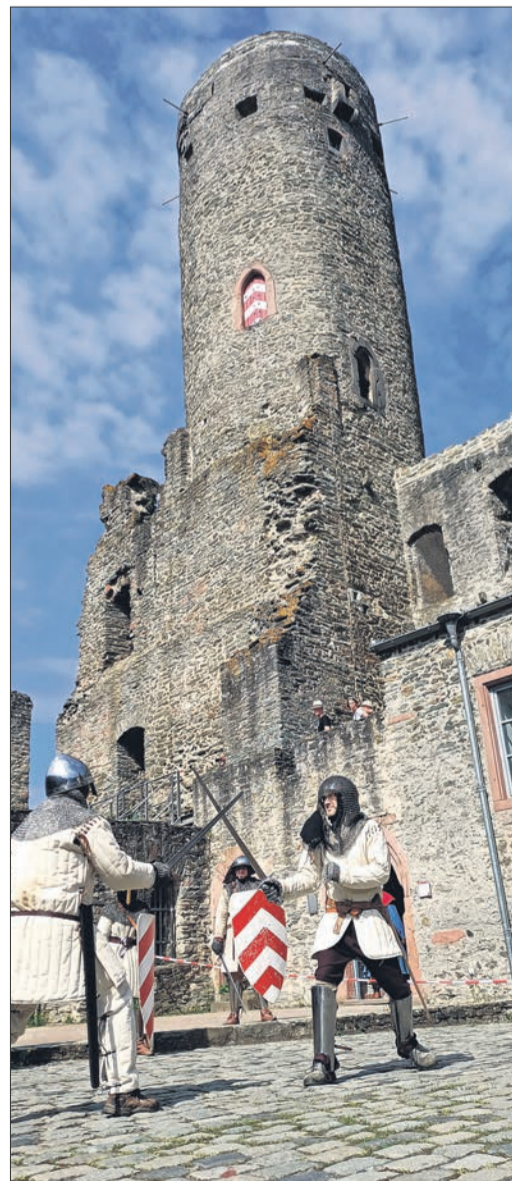
Unter dem Bergfried ging's zur Sache.

Manch einer wagte den Aufstieg auf den Burgturm, um bei herrlichem Sonnenschein Eppsteins malerisches Panorama zu betrachten, und auch die Jüngsten von zwei und vier Jahren, Paulo und Giulio, freuten sich über das Kampf-Spektakel. ccl