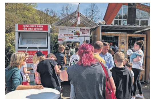
Zahlreiche Neugierige trafen sich am Eisautomaten in Ehlhalten.