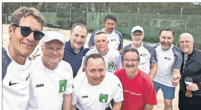
Freundschafts- und Saisonvorbereitungsspiel der Herren50+ des ETC und des TC Bremthal.

Das erste offizielle Medenspiel der Herren 50 findet am Samstag, 30. Mai, ab 14 Uhr auf der Anlage des ETC in Ehlhalten statt. Bis dahin wird weiter trainiert, gefeilt und zusammengeschweißt. Der ETC freut sich auf eine Saison, die sportlich wie gemeinschaftlich ein starkes Zeichen setzt: Tennis lebt – der ETC ist mit einer eigenen Mannschaft zurück. Über Zuschauer bei den Heimspielen würden sich die Herren 50 sehr freuen.