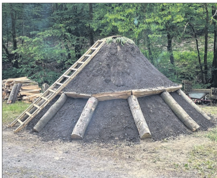
Jedes Jahr im Frühjahr wird für das Fest im Silberbachtal bei Ehlhalten der Kohlenmeiler aufgeschichtet.