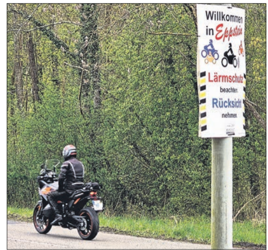
Mit Plakaten appelliert die Stadt an Motorradfahrer, Rücksicht zu nehmen.

Ein rücksichtsvolles Miteinander, die Einhaltung geltender Gesetze und Geschwindigkeitsregelungen sind Voraussetzung, um Interessenskonflikte zu vermeiden. Die berechtigten Interessen der Bürgerschaft und die der Motorrad Fahrenden gilt es, in einen