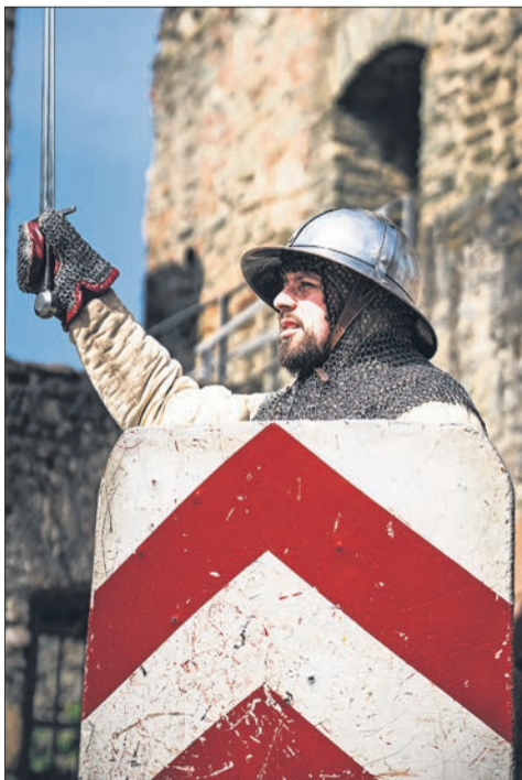
Schaukampf mit Schild und Schwert.

Auch ein privat aus Koblenz angereister Teilnehmer, ausgestattet mit Schwert und Schild, wusste um die Verletzungsgefahr und ließ sich daher ausreichend Zeit, um Knie und Schienbeinschutz anzulegen und mit Bandagen zu befestigen. Die ersten Einzelkämpfe gewann er beinahe alle und wusste viel zu berichten. Er reiste bereits nach Norwegen und Italien, um regelmäßig an Kampfübungen teilzunehmen. Die