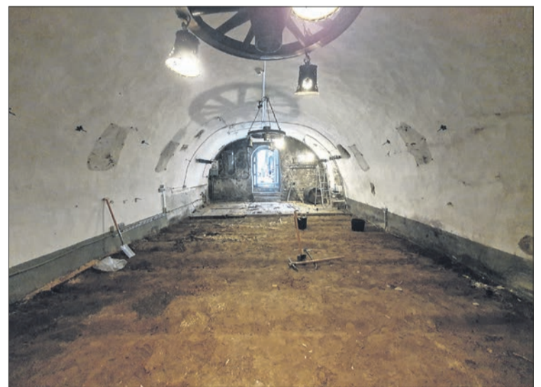
Der Mainzer Keller ist entkernt, die Lampen sind inzwischen abgehängt und auch der Holzboden entfernt.

So hat der Burgverein nach neuester Rechnung aktuell 737 Mitglieder. Diejenigen, die unter den rund 40 Besuchern der Mitgliederversammlung in der besten besuchten Kemenate dabei waren, wurden einmal mehr davon überzeugt, dass es eine gute Sache ist, den Burgverein zu unterstützen und sich für den Erhalt des Eppsteiner Wahrzeichens einzusetzen – gemeinsam für die Burg. raw/