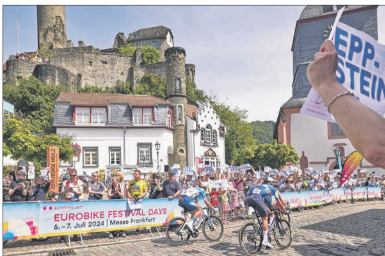
Jubel auf dem Gottfriedplatz bei der Durchfahrt der Radrenn-Elite 2024.

Anlässlich des am Freitag, 1. Mai, stattfindenden Radrennens „Eschborn-Frankfurt - Der Radklassiker“ und des Rennverlaufes durch Ehlhalten, Vockenhausen und die Eppsteiner Altstadt in Richtung Kelkheim-Fischbach werden die gesamte Ortsdurchfahrt Ehlhalten (L 3011), die Ortsdurchfahrt Vockenhausen (Hauptstraße L 3011) und die gesamte Burgstraße in den Streckenverlauf mit einbezogen.