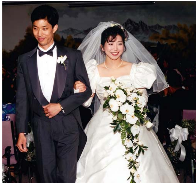
Am Tag unserer Heirat

Trotzdem konnte ich aufgrund kultureller Unterschiede manchmal nicht nachvollziehen, warum etwas auf eine bestimmte Weise getan wurde. Ich musste lernen, geduldig zu sein und nicht überzureagieren. Doch ich ließ mein Denken formen und erkannte, dass Jehova jede Entscheidung segnen kann, solange wir der Anlei-