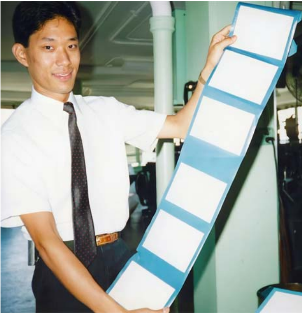
Ich erzähle Besuchern etwas über die Buchbinderei in Brooklyn