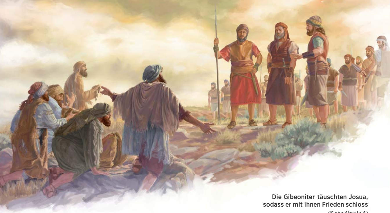
Die Gibeoniter täuschten Josua, sodass er mit ihnen Frieden schloss (Siehe Absatz 4)

Fall von Jericho und Ai eine Delegation* zu Josua nach Gilgal, um Frieden auszuhandeln.