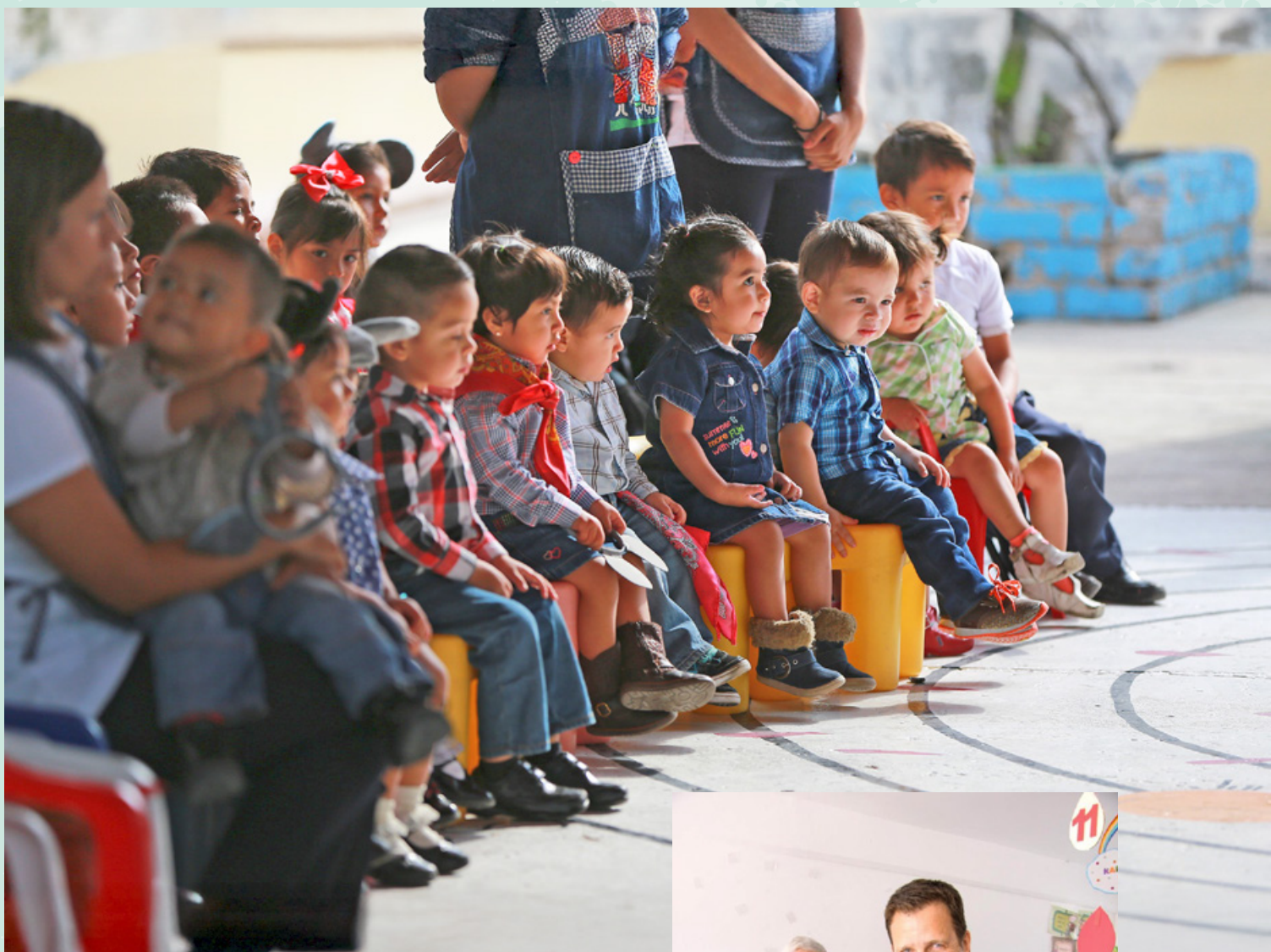
Kinder der Casa de Cuna im mexikanischen Querétaro.

»Es ist großartig, hier vor Ort zu sehen, welche wertvolle Arbeit geleistet wird.«