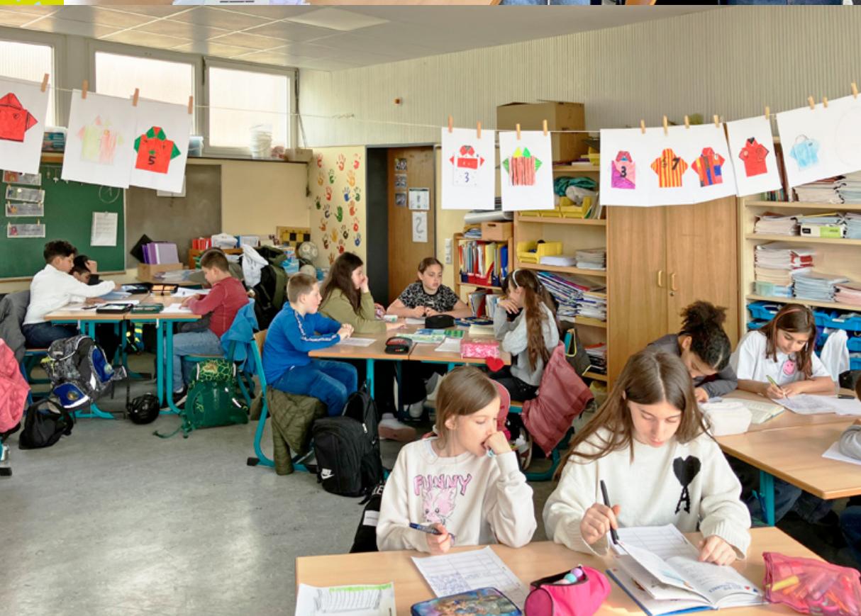
Mit Spaß und Konzentration dabei: Die 4c der Walter-Kolb-Schule in Frankfurt-Sossenheim bei der Projektwoche zum »Lese-Kicker«.