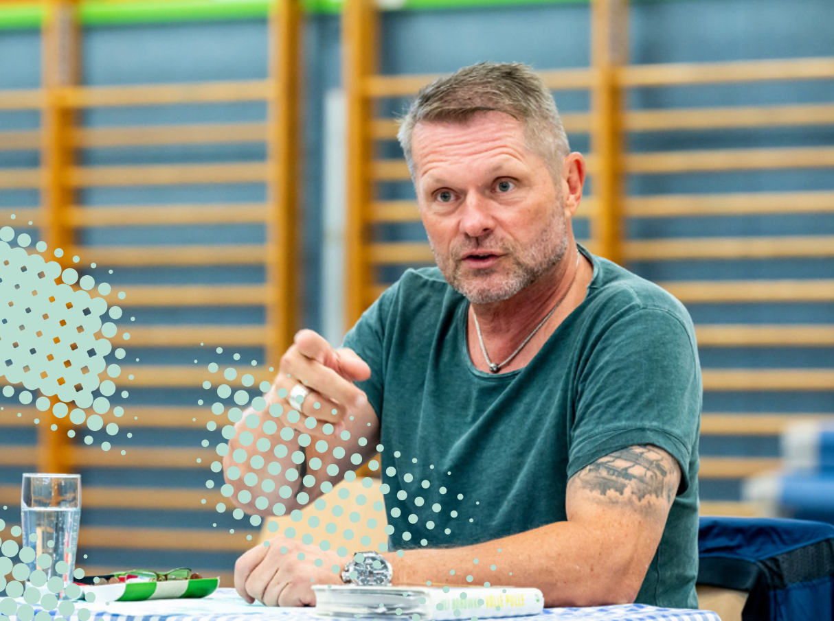
Uli Borowka im Gespräch mit den jungen Strafgefangenen.