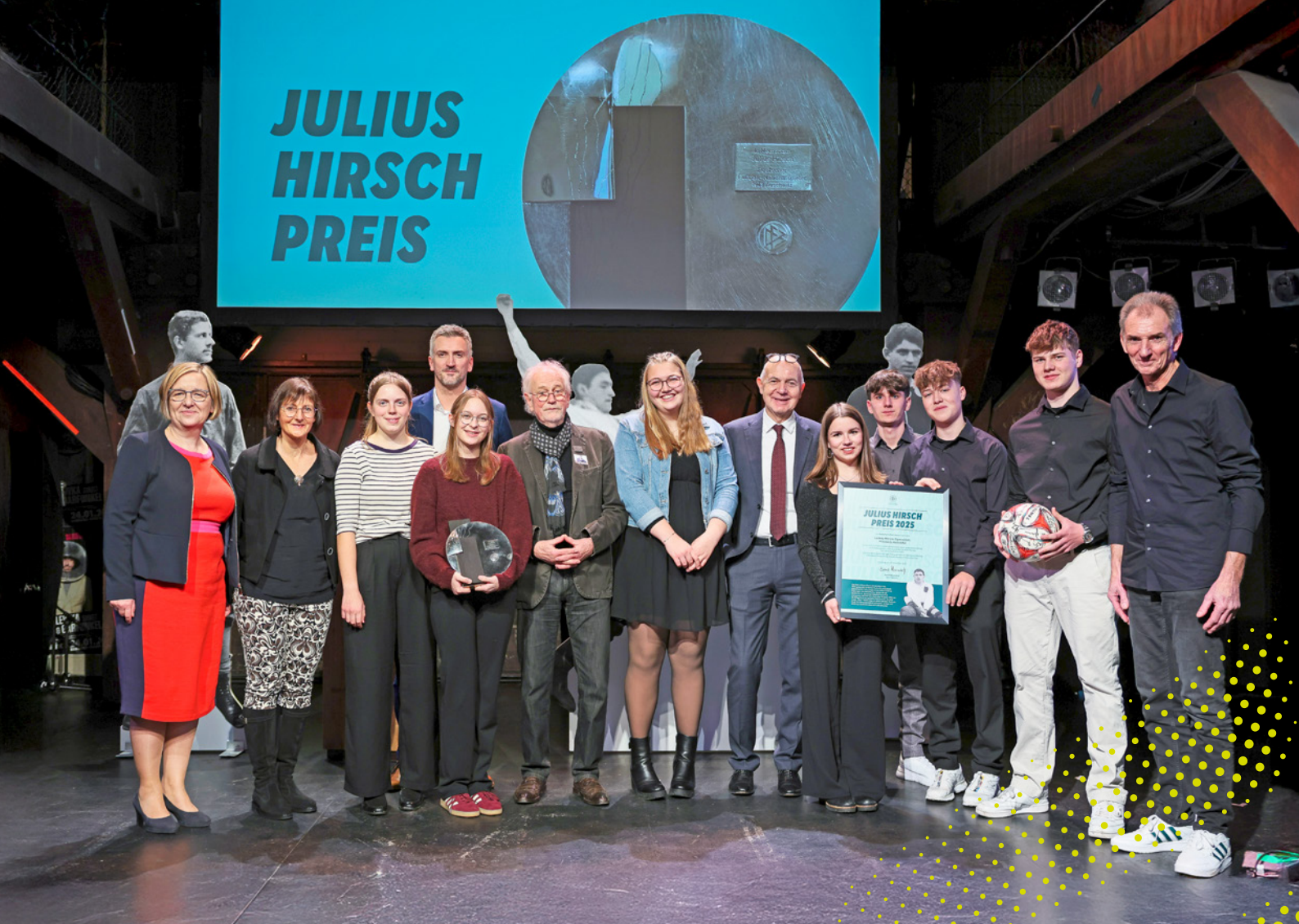
Der Seminarkurs der 11. Klasse des Ludwig-Marum-Gymnasiums Pfinztal mit DFB-Präsident Bernd Neuendorf und Jury-Mitglied Eberhard Schulz bei der Preisverleihung in Hamburg.