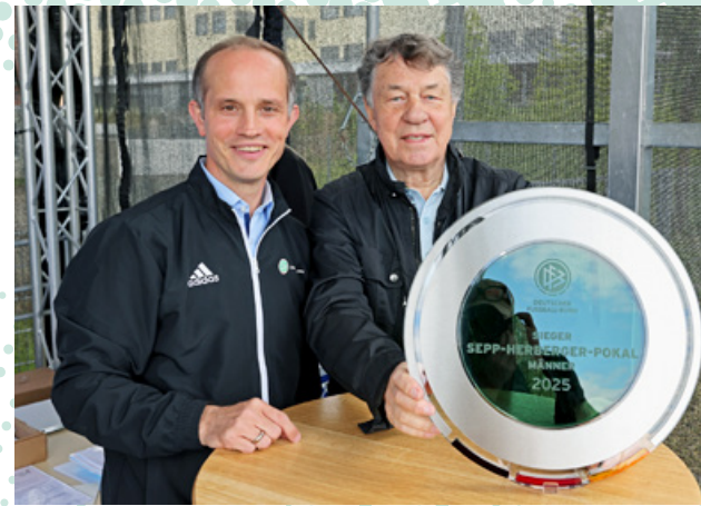
Tobias Wrzesinski und Otto Rehhagel beim Sepp-Herberger-Pokal 2025.

Neben Rehhagel engagieren sich viele weitere Persönlichkeiten und Institutionen für die Resozialisierung. Im Rahmen der Initiative »Anstoß für ein neues Leben« besuchten 2025 Mannschaften aus den Nachwuchszentren von RB Leipzig, dem 1. FC Kaiserslautern und dem 1. FC Nürnberg Justizeinrichtungen in ganz Deutschland.