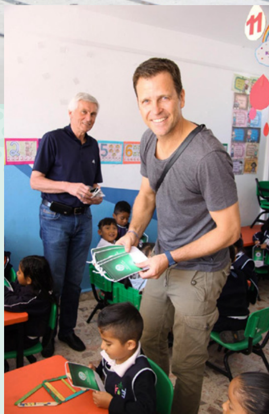
Seit vielen Jahren setzt sich Oliver Bierhoff für die Mexico-Hilfe ein.