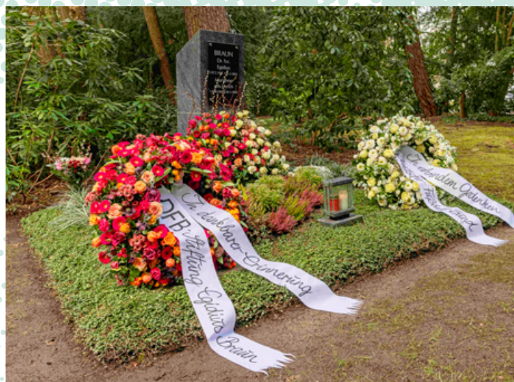
Das Grab von Egidius Braun – Erinnerung an einen Menschen, der Fußball als gesellschaftliche Verantwortung verstand.

Im ersten Jahr 2001 hatte die Stiftung noch Aufwendungen in Höhe von 254.445,17 Euro, heute sind es im Schnitt 3,05 Millionen Euro. Ein Posten sticht aus der Bilanz heraus: 2022 wurden 11.808.439,77 Euro aufgewendet. Ursache war der russische Angriffskrieg gegen die Ukraine. Die Stiftung hatte schon von Beginn an Bildungsprojekte für Jugendliche in der Ukraine, nun herrschte auch Bedarf an Fürsorge und quasi erster Hilfe. Und weil so viele, die den Bomben entfliehen wollten, nach Deutschland kamen, unterstützte die Stiftung bis heute rund 600 Fußballvereine finanziell dabei, dass sie ukrainische Kinder und Jugendliche integrieren. Beim Helfen helfen, das war ganz im Geiste von Egidius Braun.