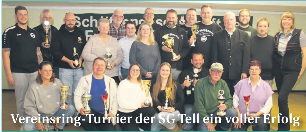
Vereinsring-Turnier der SG Tell ein voller Erfolg

Die SG Tell Froshausen hat das Vereinsring-Turnier 2026 erfolgreich ausgerichtet. 161 Schützinnen und Schützen aus 17 Vereinen traten in 28 Mannschaften an und sorgten über fünf Turniertage hinweg für spannende Wettkämpfe. Die höchste Beteiligung verzeichnete der Mittwoch mit 58 Starterinnen und Startern. Sportliche Höchstleistungen lieferten unter anderem die jeweiligen Tagessieger sowie die Jugend-