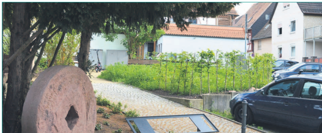
Hier wird gefeiert! Vom Projekt zum Lieblingsort: der Hospitalplatz in neuem Glanz.