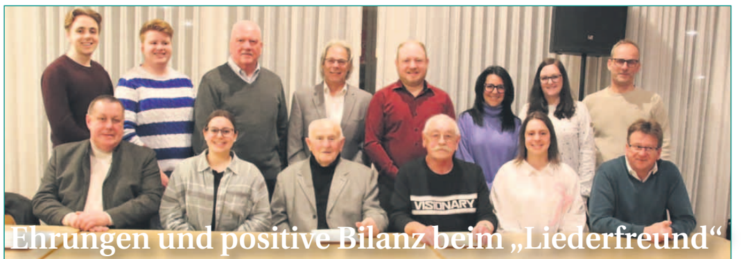
Ehrungen und positive Bilanz beim „Liederfreund“

Punkt der Versammlung ist die Entlastung des Rechners und des Gesamtvorstands. Darüber hinaus steht in diesem Jahr eine außerordentliche Neuwahl des Schriftführers an. Ebenfalls wird turnusgemäß ein Kassenprüfer gewählt. Mit Blick auf das Jubiläumsjahr 2026 wird außerdem der Vereinskalendar vorgestellt. Unter dem Punkt „Verschiedenes“ haben die Mitglieder Gelegenheit, weitere Themen einzubringen. Anträge hierzu müssen bis spätestens 18. Mai 2026 schriftlich beim geschäftsführenden Vorstand eingereicht werden. Der Vorstand freut sich auf eine rege Teilnahme der Mitglieder.