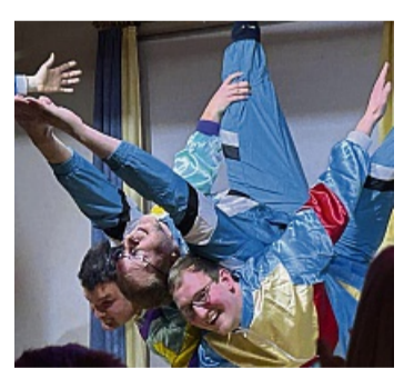
Kirsche auf der Sahne: die Hopse-Jungs.

Und wer früher schonmal auf dem Bunten Abend in Böhne war, weiß, dass das Dorfgespräch nicht fehlen durfte. Mit Bier, Schnaps und Zigarren wurde hier auf Böhner-Platt über die Geschehnisse des vergangenen Jahres berichtet.