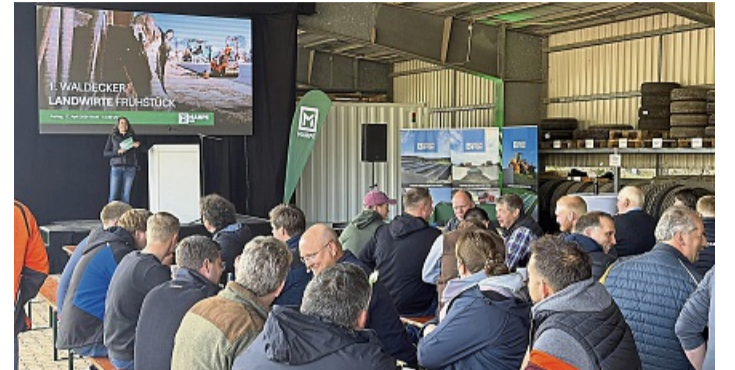
Unter dem offenen Schleppdach der ehemaligen Panzerhalle waren die Landwirte aus der Region zu einem Frühstück mit Fachvorträgen aus der Branche eingeladen.

nen für die systematische und zertifizierte Bodenaufbereitung vor. Bis zur Belastungskategorie Z2 kann hier belasteter Erdaushub aufgearbeitet werden. ELMAR SCHULTEN