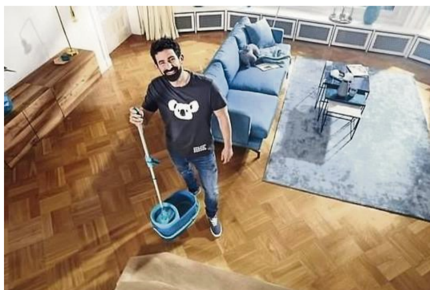
Eine regelmäßige Reinigung und die richtige Pflege tragen entscheidend dazu bei, dass der Holzboden über Jahrzehnte hinweg schön bleibt.

her versiegelt weil man vielleicht Kleinkinder zu Hause hatte, kann jetzt eine farbige geölte Oberfläche in Betracht kommen. Gerne berät Sie dazu der örtliche Parkettleger. r