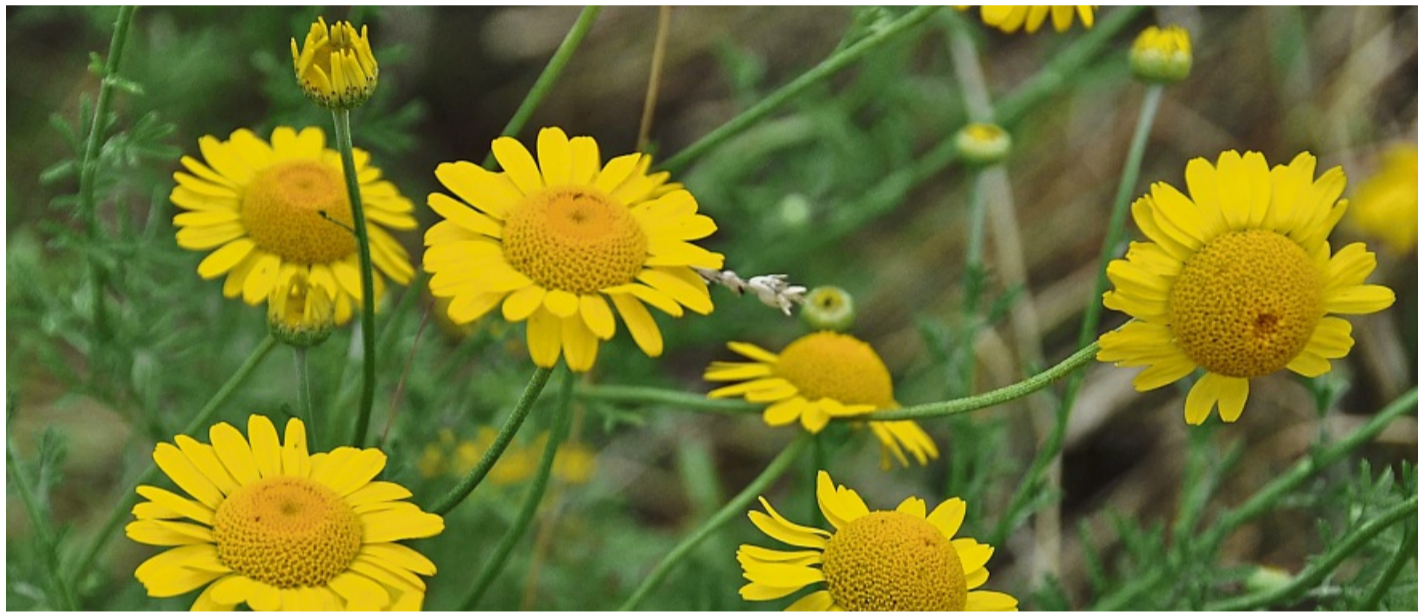
Die Färber-Hundskamille gehört zu den Pflanzen, die beim Pflanzentausch am 2. Mai in Flechtdorf angeboten werden. Die insektenfreundliche Hundskamille ist eine alte Färber-Pflanze.

nicht nur Pflanzen zu ergattern, sondern nach Möglichkeit auch, welche mitzubringen. Wer mitmachen möchte, kann sich gern melden per Telefon 05633/91124 oder E-Mail pflanzentausch@gmx.net. Eintritt frei. MARIANNE DÄMMER