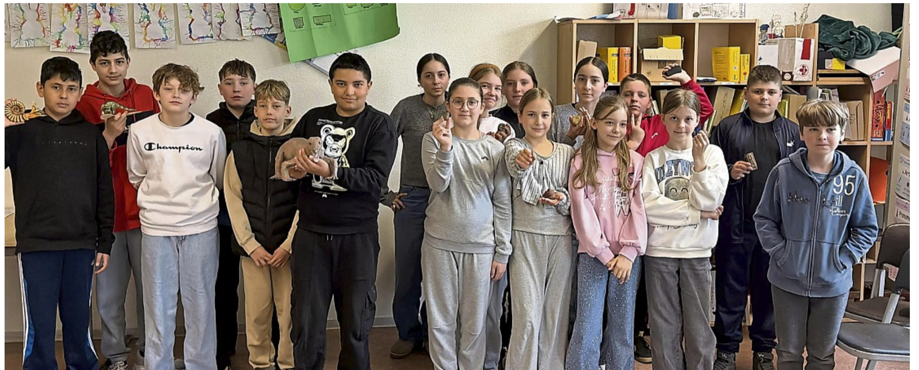
Erfuhren viel über die Erdgeschichte: Die Schülerinnen und Schüler der Klasse 5b der Louis-Peter-Schule.

Im Mittelpunkt stand dabei ein besonderes Lebewesen aus der Region: der sogenannte „Korbacher Dackel“. Anschaulich erklärte Richter, dass es