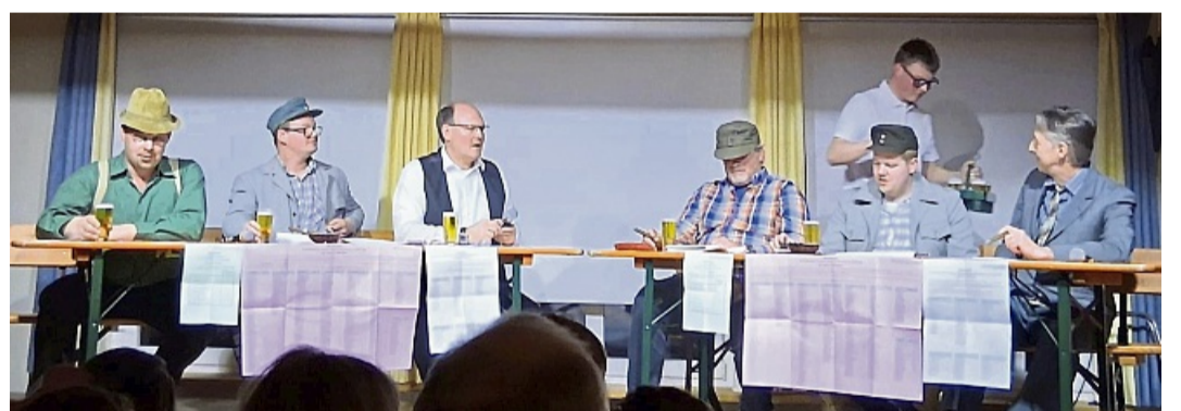
Sketche waren Trumpf beim Bunten Abend.

Bunter Abend in Böhne strapaziert die Lachmuskeln des Publikums