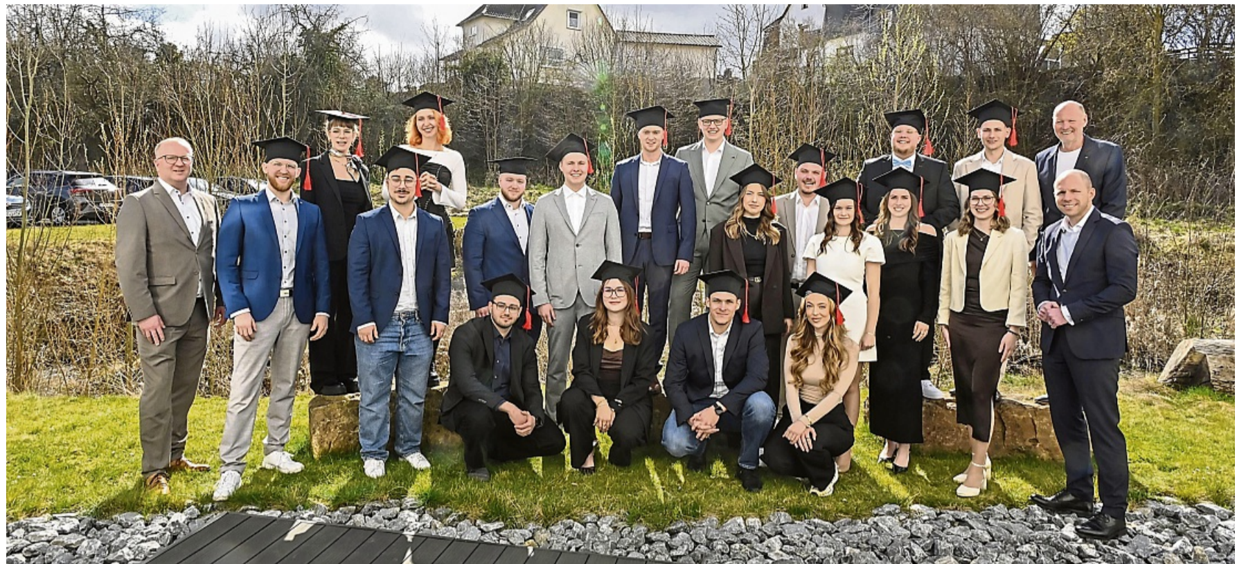
21 Absolventinnen und Absolventen freuen sich am StudiumPlus-Campus in Bad Wildungen über den Abschluss ihres dualen Studiums.

Das werde aber auch belohnt, denn die Absolventen könnten nun direkt in ihrem Partnerunternehmen weiterarbeiten. Er