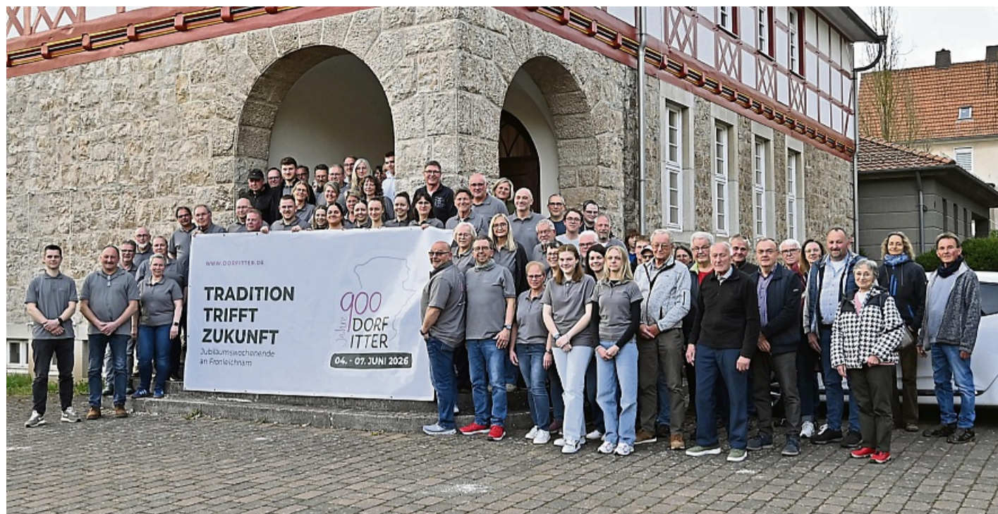
Gemeinschaftlich engagiert: Der Festausschuss „900 Jahre Dorfitter“ hat das Programm für das Jubiläumsfest Anfang Juni vorgestellt – jetzt geht es in die finale Arbeit.