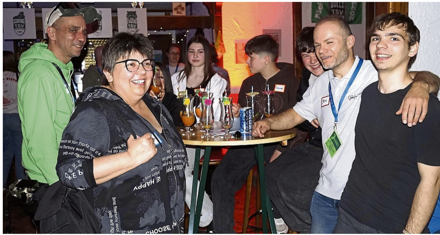
Vielfältige Themen wurden beim Jugendcheck in Herleshausen gemeinsam diskutiert. Konfliktpunkte waren unter anderem fehlende Freizeitmöglichkeiten und eingeschränkte Mobilität.

Schon vor der Veranstaltung hatten die Teilnehmenden die Möglichkeit, ihre Sicht über eine Online-Umfrage einzubringen. Themen wie Freizeit, Mobilität, Jugendräume und Mit-