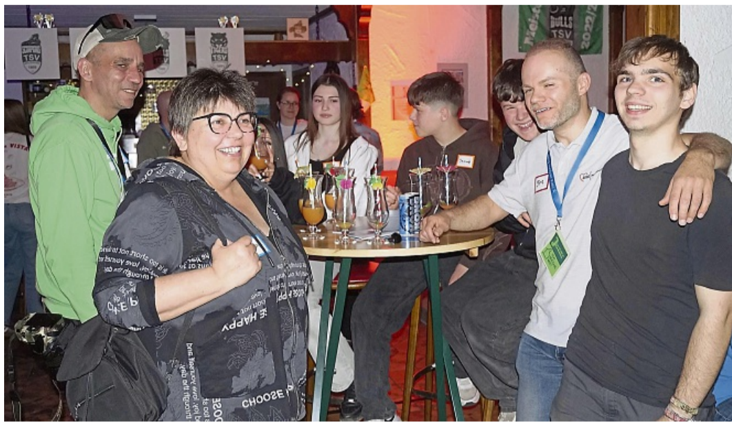
Vielfältige Themen wurden beim Jugendcheck in Herleshausen gemeinsam diskutiert. Konfliktpunkte waren unter anderem fehlende Freizeitmöglichkeiten und eingeschränkte Mobilität.

Schon vor der Veranstaltung hatten die Teilnehmenden die Möglichkeit, ihre Sicht über eine Online-Umfrage einzubringen. Themen wie Freizeit, Mobilität, Jugendräume und Gestaltungsmöglichkeiten standen dabei im Vordergrund. Während viele Jugendliche ihre Gemeinden und Schulen als relativ zufriedenstellend bewerteten, zeigt sich an anderer Stelle ein deutlicher Verbesserungsbedarf: Mehr Freizeitmöglichkeiten, kulturelle Angebote, Jugendtreffs, bessere