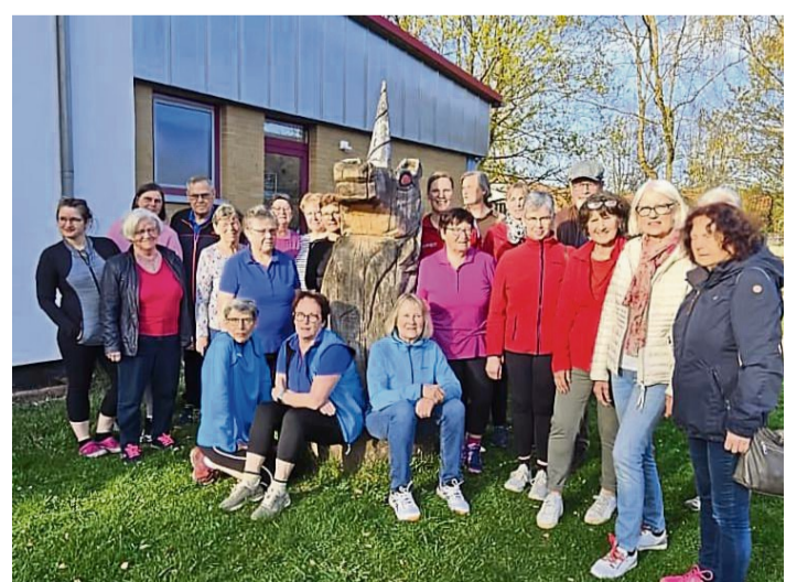
Wann und wie es gilt, den „Schmächz zu addagieren“, haben die Teilnehmer in Frankershausen gelernt.