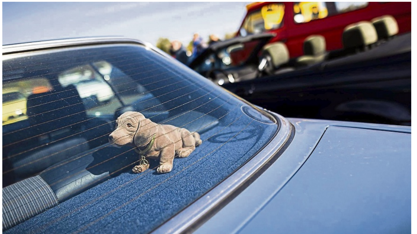
Seltenes Tier oder aussterbende Art? Der Wackeldackel versieht laut einer Umfrage in rund zwei Prozent der Autos in Deutschland seinen treuen Dienst.

Und hier ist eine Auswahl der mehr oder weniger sinnvollen Klassiker, die im Auto mitfahren. Befragt wurden 2.046 Autobesitzerinnen und -besitzer in Deutschland ab 18 Jahren: