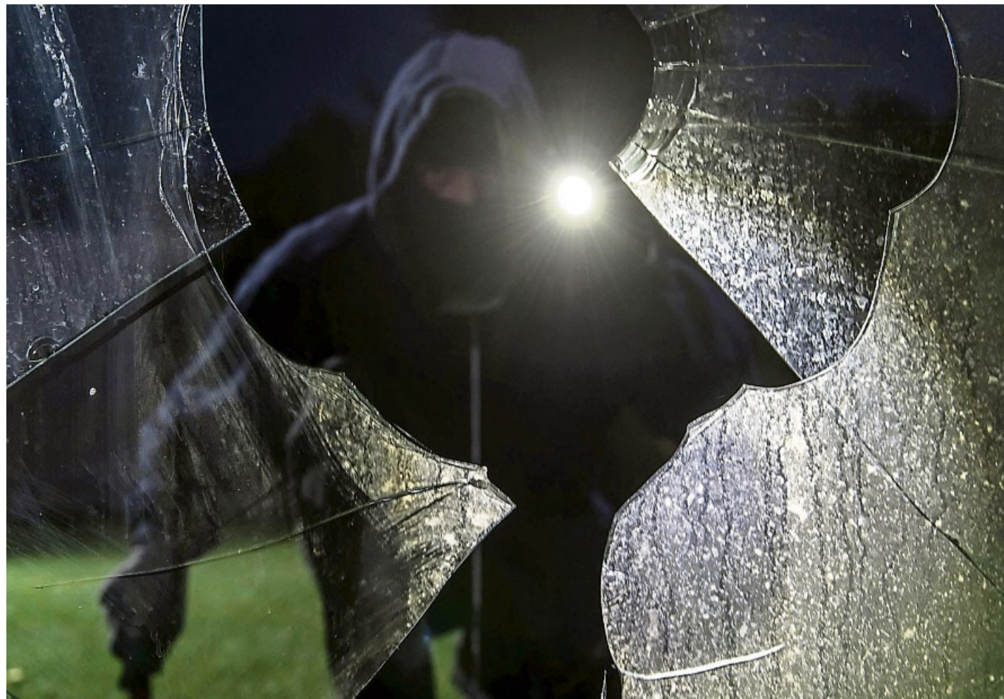
Wie „einladend“ Ihr Grundstück für Einbrecher ist, können Sie durch eine bewusste Gestaltung beeinflussen.

Hilfestellung will man den Einbrechern natürlich nicht