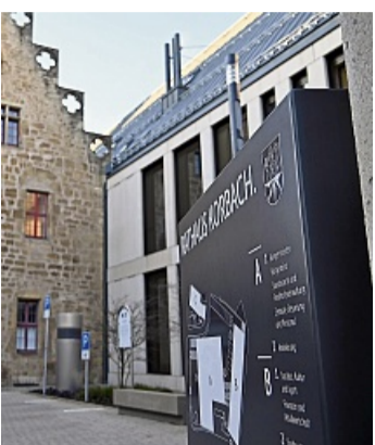
Ein anderer Wind soll im neuen Korbacher Parlament wehen.