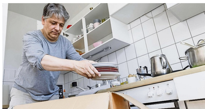
Besser jetzt ausmisten als später: Nicht jeder Teller aus alten Zeiten muss mit ins neue Zuhause.