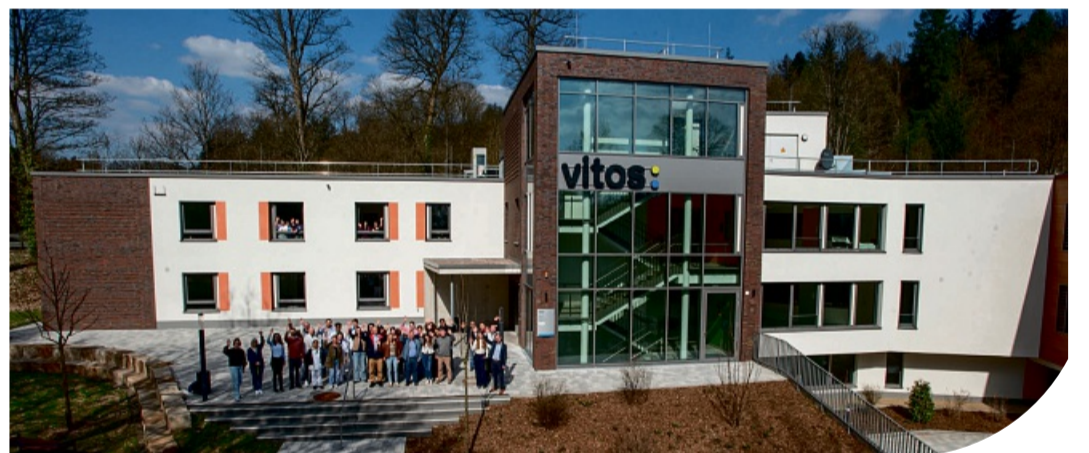
Eröffnung des Neubaus für die Vitos Klinik für Psychiatrie und Psychotherapie Haina