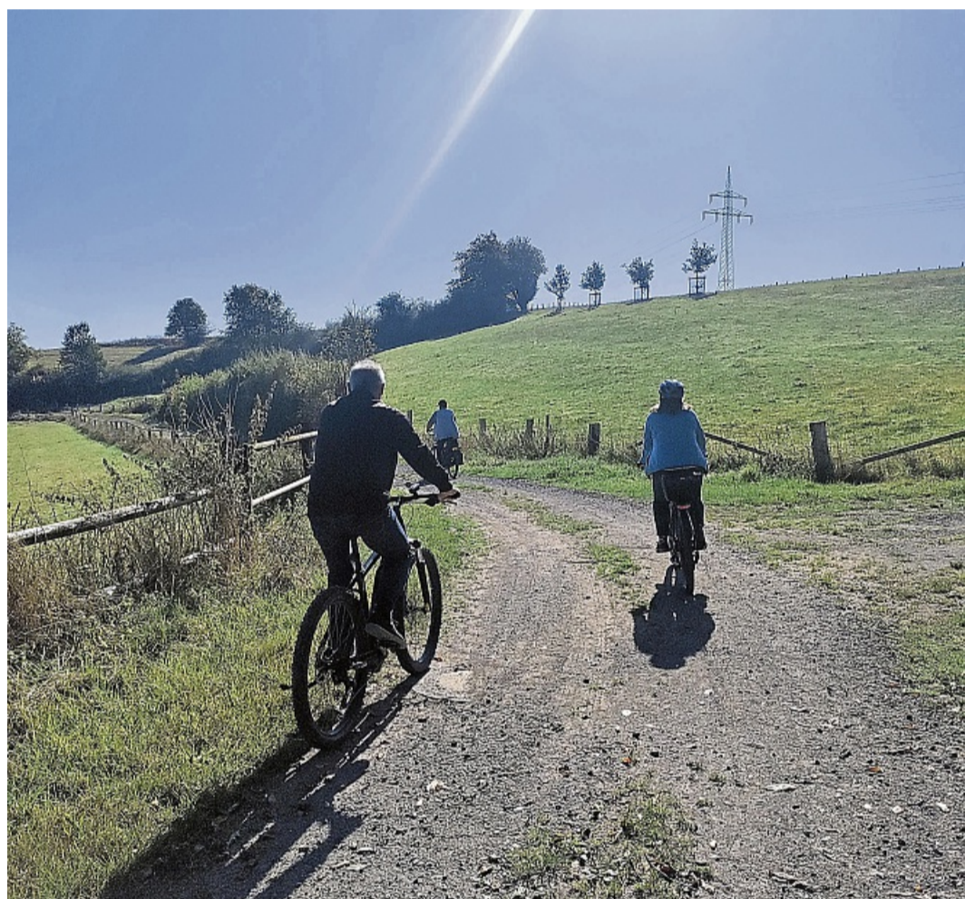
Geführte Radtouren bietet nun die Ederbergland-Touristik an. Dieses Foto entstand bei Geismar.

Sonntag, 21. Juni, 13.15 Uhr: Hugenotten-Radtour. Auf den Spuren der Hugenotten von Fran-