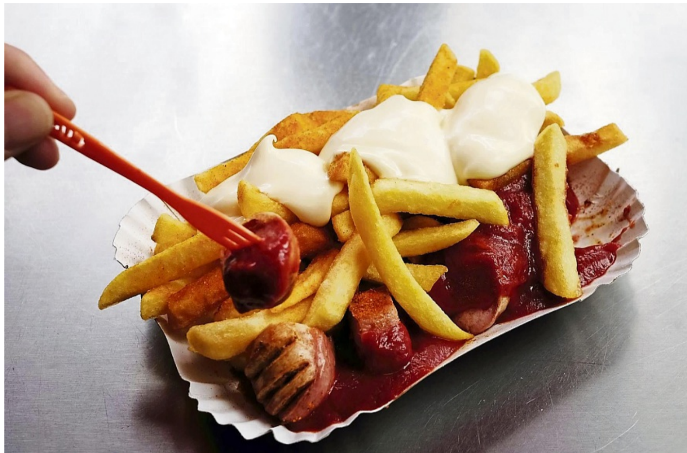
Erfunden in Berlin oder im Ruhrpott? Egal. Hauptsache, die Currywurst schmeckt.