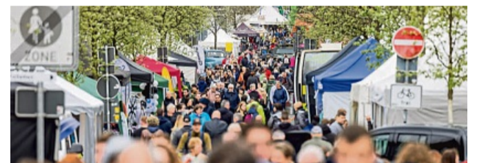
Winterberg wird zur bunten Erlebnismeile.