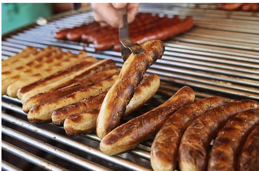
Die beste Currysoße der Welt ist nichts ohne eine gute Wurst. Die sollte schön fest sein, aber nicht gummiartig.

Eine Information der Neusehland Hartmann GmbH & Co. KG, Schöne Aussicht 5, 35396 Gießen