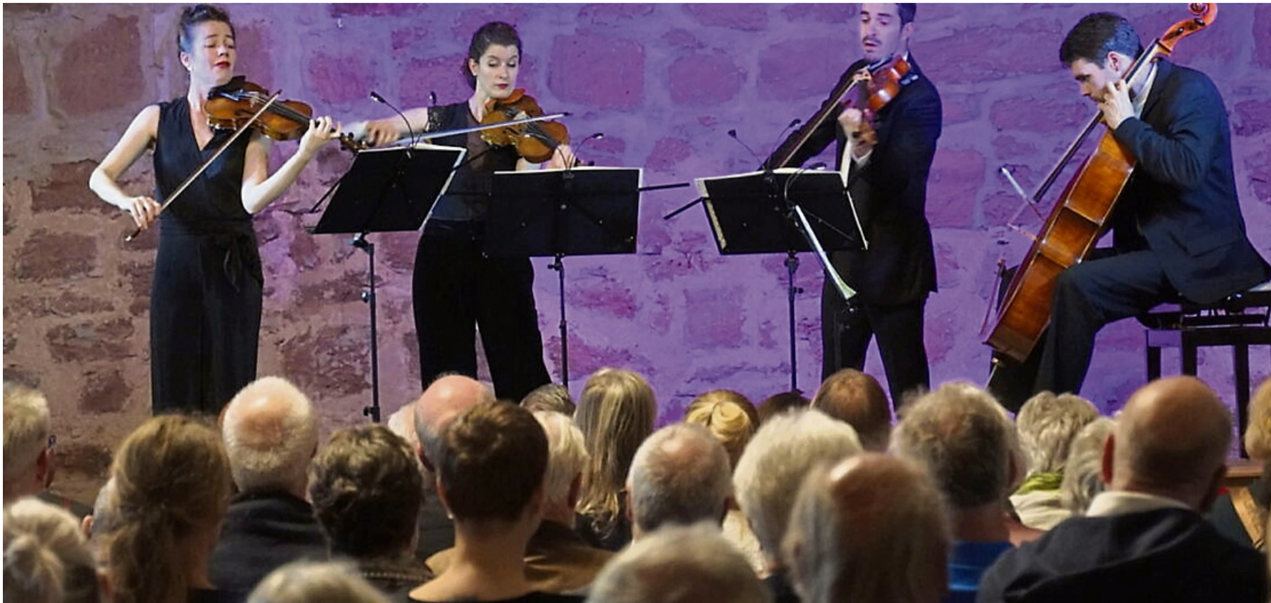
Fleckenbühler Hofkonzerte: Die Palette reicht vom kleinen Duo bis zum klangvoll erweiterten Ensemble.