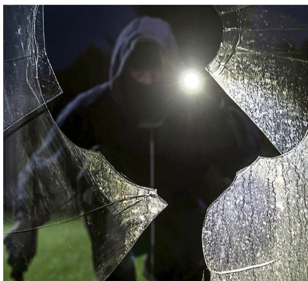
Wie „einladend“ Ihr Grundstück für Einbrecher ist, können Sie durch eine bewusste Gestaltung beeinflussen.

Hecken und Sträucher, die dicht am Haus gepflanzt werden, sind ebenfalls keine gute Idee im Sinne des Einbruchschutzes. Sie bieten schließlich nicht nur Ihnen und Ihrem Haus Sichtschutz, sondern