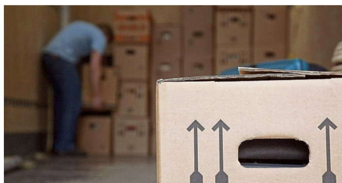
Wohin nur mit dem Karton? Wer vorher gut beschriftet, muss sich diese Frage nicht in der Hektik des Umzugs stellen.

Am Sonntag gibt es Frühhandel, Handwerk und Kinder-Vereinen zum Shoppen, Informieren und Verweilen – dazu locken Live-Musik,