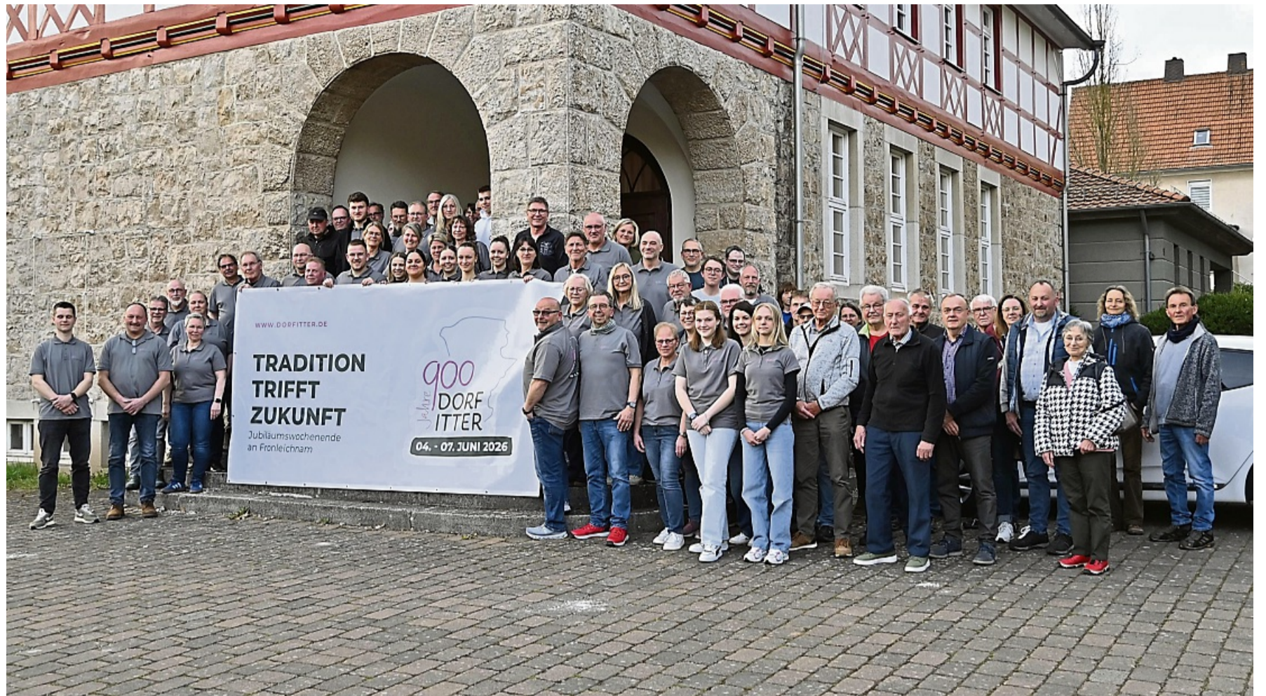
Gemeinschaftlich engagiert: Der Festausschuss „900 Jahre Dorfitter“ hat das Programm für das Jubiläumsfest Anfang Juni vorgestellt – jetzt geht es in die finale Arbeit.

Die Festmeile wird am Samstag und Sonntag, 6. und 7. Juni, für viel Abwechslung und Un-