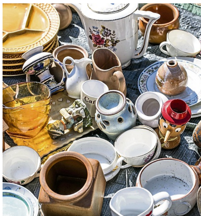
Hier ist Stöbern angesagt: Auf dem Höfeflohmarkt in Dodenau.

Teilnehmende Stände sind im ganzen Ort zu finden und werden mit bunten Luftballons gekennzeichnet. Außerdem wird ein Standplan herausgegeben, sobald die Anmeldung abge-