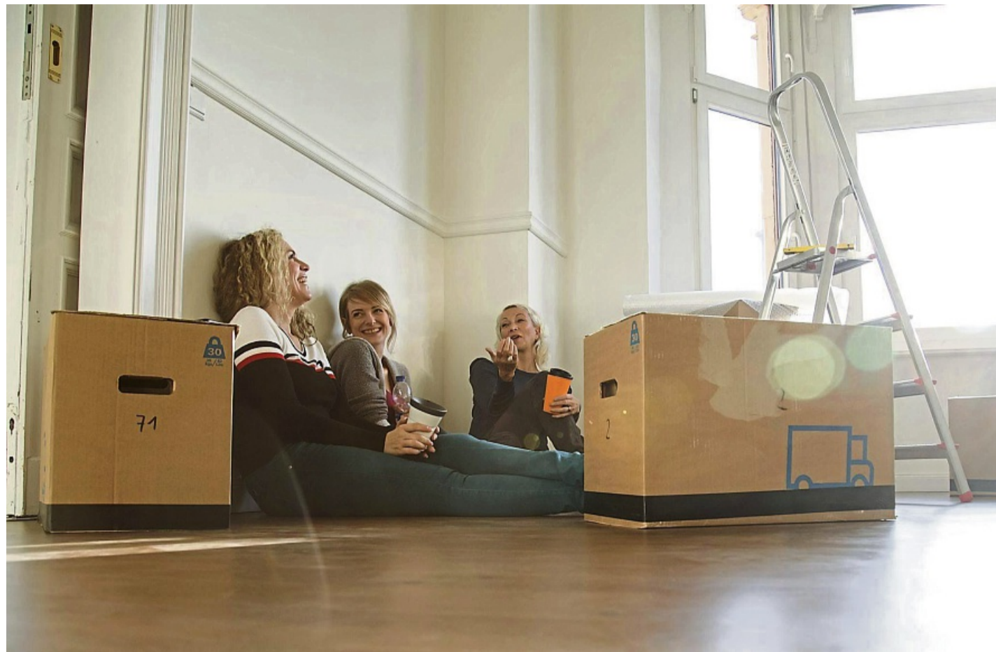
Gute Laune beim Umzug? Mit den richtigen Helfern kann sogar Kartonschleppen Spaß machen.

Ein wichtiger Spartipp: vorab ausmisten. „Je weniger ich mit-