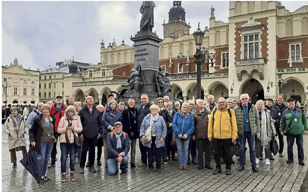
Einen Höhepunkt des vergangenen Jahres: Der Partnerschaftsverein reiste nach Polen. Das Foto zeigt die Gruppe auf dem Marktplatz von Krakau.