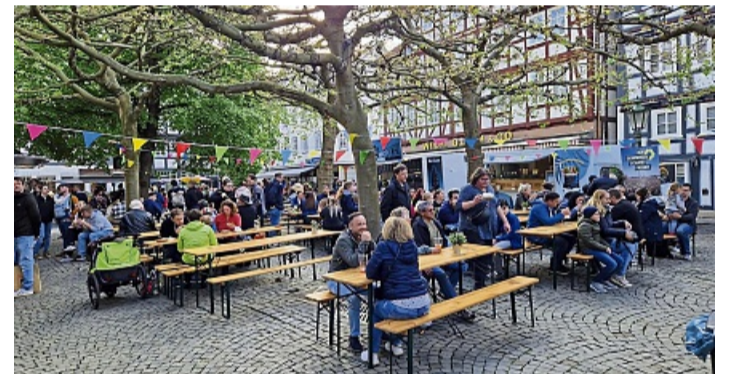
Besucher auf dem Marktplatz beim Street-Food-Festival 2024.