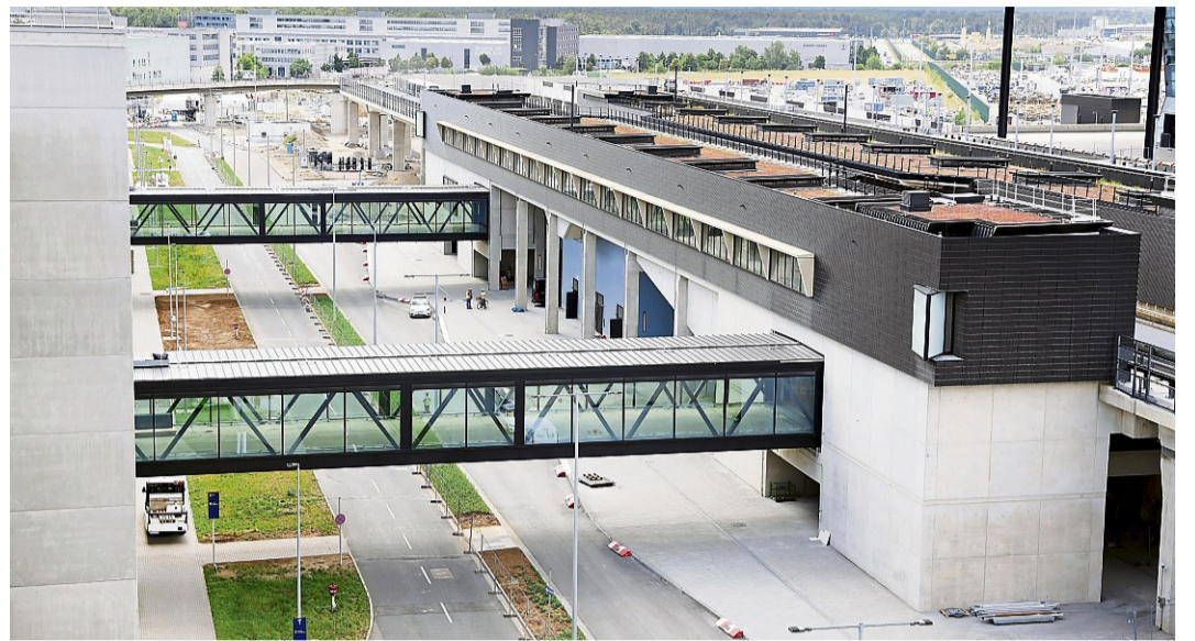
Auch bekannt als Sky-Line-Bahn: Die PTS-Station am Terminal 3 mit Verbindung zum Parkhaus und Terminalzugang. Das 5,6 Kilometer lange Transportsystem verbindet die Terminals miteinander.