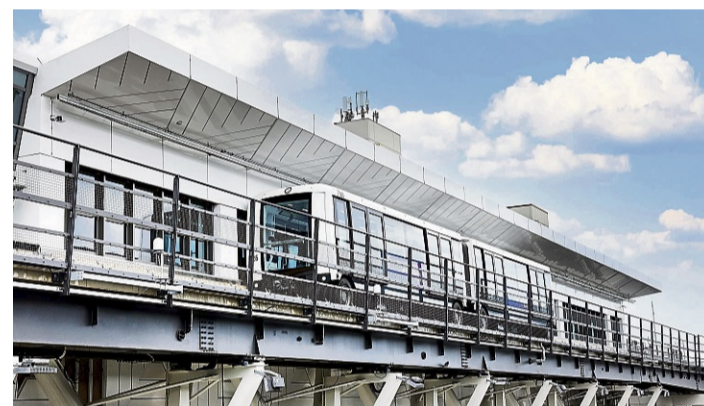
Sky-Line-Bahnhof: Auch das Verbindungssystem zwischen den Terminals und Richtung Fern- und Regionalbahnhof trägt die Handschrift des Unternehmens aus Fritzlar.