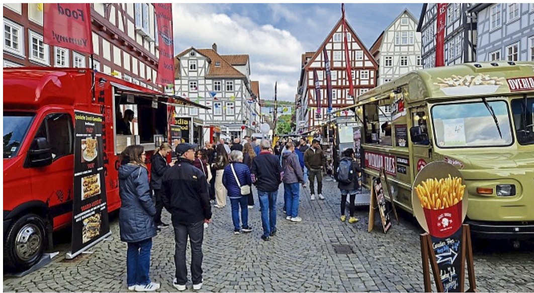
Essen, bummeln und genießen: Vom 8. bis 10. Mai findet in Melsungen ein Street-Food-Festival statt. Am Sonntag haben die Geschäfte geöffnet. Das Bild stammt aus dem Jahr 2024.