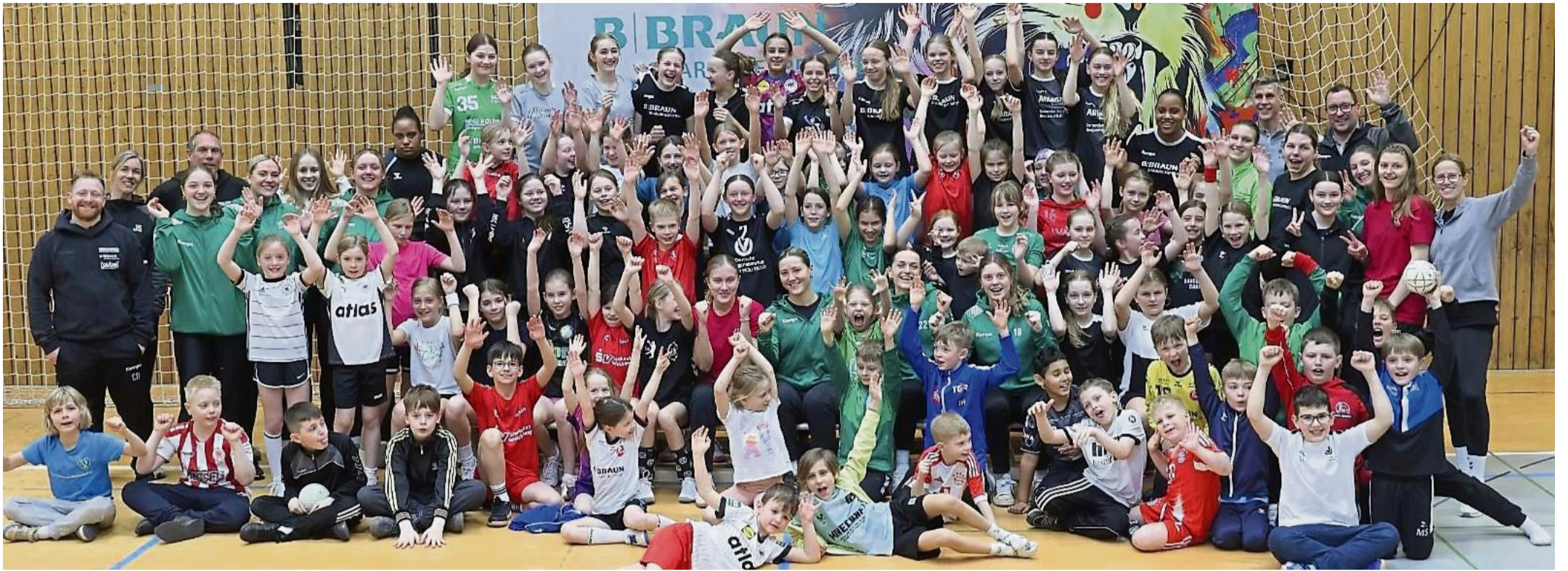
101 Trainer und Talente waren in der Höhle der Löwinnen.