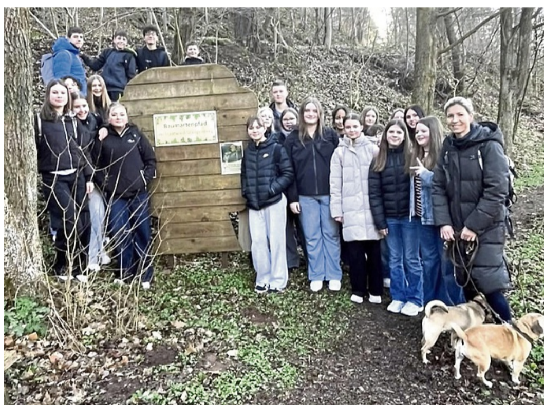
Vom Klassenzimmer in den Wald: Schüler der siebten Klassen brachten in einem Projekt Bäume zum Sprechen.

Im Rahmen eines fächerübergreifenden Unterrichts wandelten die Schülerinnen und Schüler trockene Fakten in spannende Geschichten. Zunächst wurden Baumsteckbriefe digital erstellt – von der stattlichen Buche bis zur knorrigen Eiche. Die Informationen landeten nicht einfach in einem Hefter, sondern wurden auf einer digitalen Pinnwand, einer sogenannten Taskcard, gesammelt.