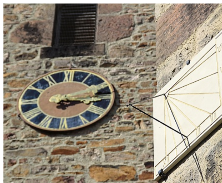
Zwei Uhren am historischen Gemäuer der Stadtkirche: die neue Sonnenuhr am Kirchenschiff und die „normale“ Uhr am Glockenturm.

die Zeit zu kennen und den Tag danach auszurichten. An diese wichtige Funktion wollen wir erinnern und sie nicht in Vergessenheit geraten lassen.“