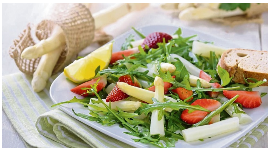
Weißer Spargel mit Rucola und Erdbeeren ist ein leckeres, sommerliches Gericht.

Rucola waschen und gut trocken. Zwiebel fein würfeln oder Frühlingszwiebeln in Rin-