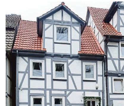
Auch Fachwerkhäuser sind bei uns in guten Händen.