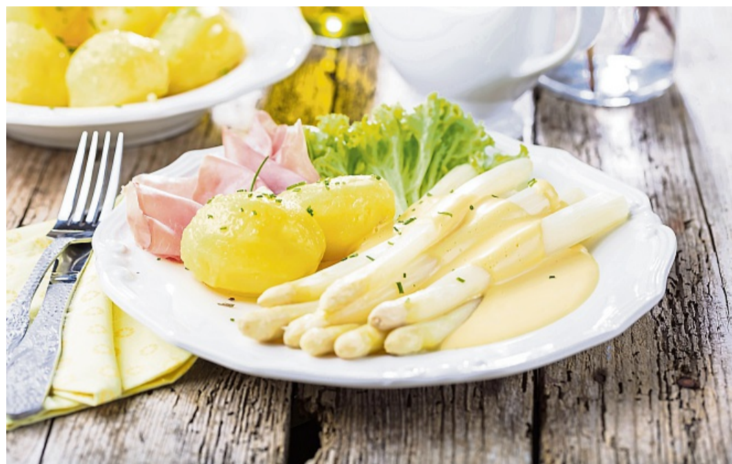
Das Gourmetgericht mit Spargel, Kartoffeln und Schinken ist ein saisonaler Klassiker.

Tipp: Besonders gut schmeckt das Gericht mit neuen Kartoffeln oder etwas Baguette. Wer es kräftiger mag, kann den Schinken kurz anrösten oder den Spargel mit etwas frisch gemahlenem Pfeffer ver-