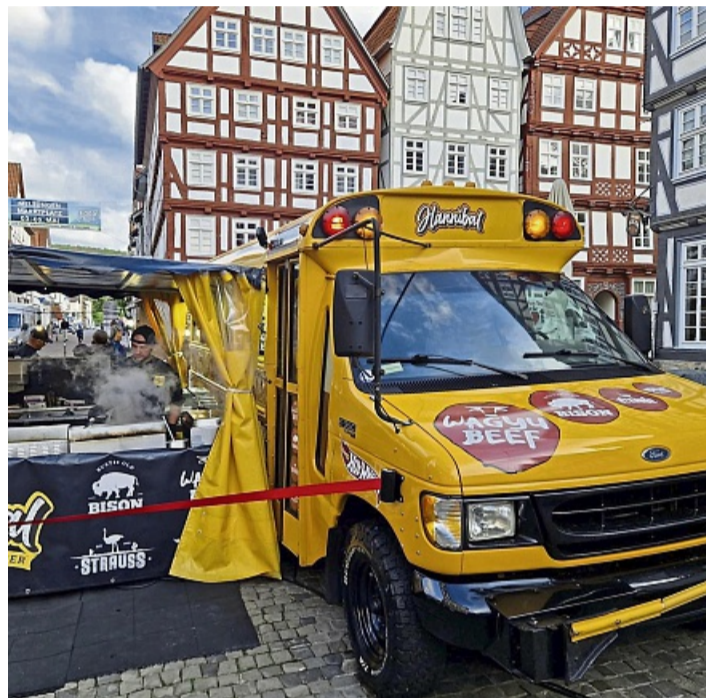
Viele internationale Gerichte: Im Angebot gibt es Klassiker wie Burger und vieles mehr.

findet und Besucherinnen und Besucher aus der gesamten Region anzieht.“