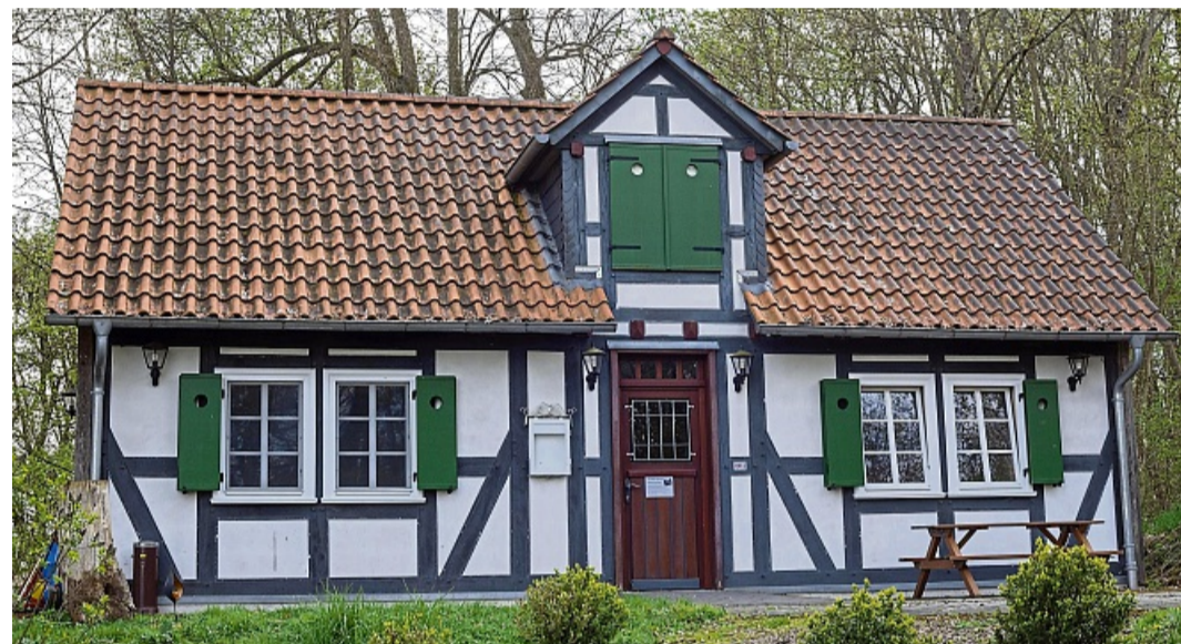
Ein Familienfachwerkhaus in Oberurff-Schiffelborn: Die Jausenstation mit insgesamt 36 Plätzen für Gäste im Innenbereich.

Birgit Reimer vom Verein der „Freunde Burg Löwenstein“.