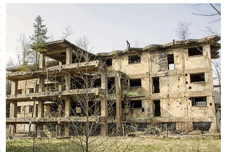
Lost Place: Das ehemalige Sprengstoffwerk in Hirschhagen ist Ziel der Exkursion.