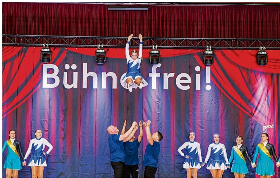
Mit einer spartenübergreifenden Choreografie wurde die Veranstaltung eröffnet.