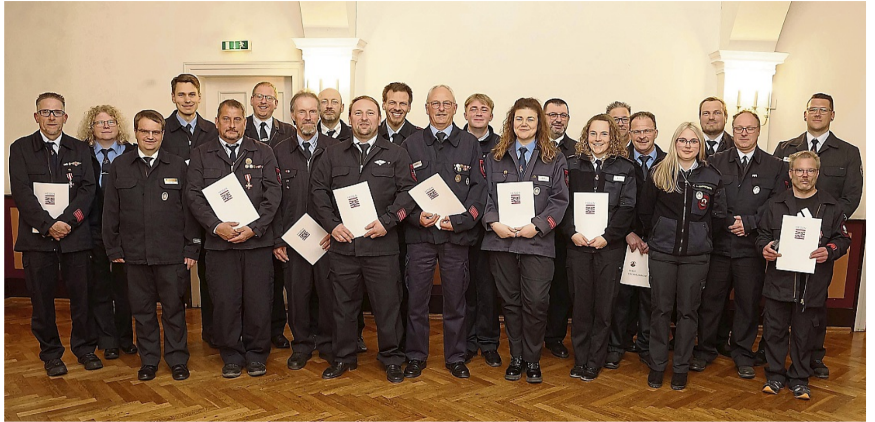
Reichlich Ehrungen und Anerkennungsprämien erhielten die Aktiven bei der Jahreshauptversammlung der Großalmeröder Feuerwehren.

In seinem Jahresbericht 2025 stellte Stadtbrandinspektor Dann eine Bilanz vor, die sich