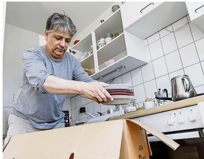
Besser jetzt ausmisten als später: Nicht jeder Teller aus alten Zeiten muss mit ins neue Zuhause.

Sind die ungeliebten Dekostücke und zu klein gewordenen Hosen erst mal aussortiert, geht