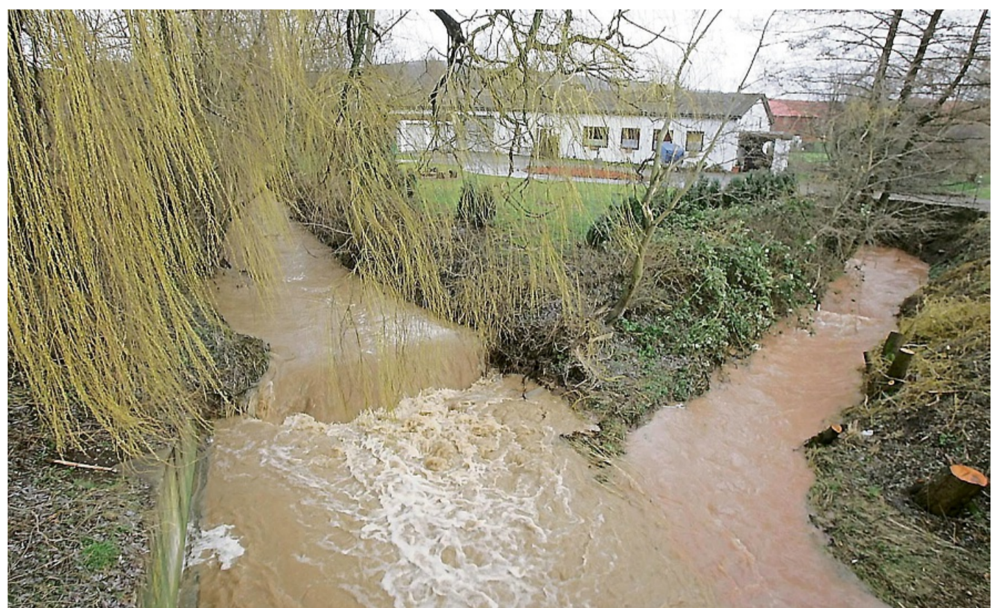
Immer wieder gibt es an dem Bach Schede Hochwasser. Dieses Bild entstand 2008 in der Ortschaft Scheden.

Aufbauend auf den Vermessungsergebnissen sollen später hydrologische und hydraulische Modelle erstellt werden – unter anderem, um Nieder-