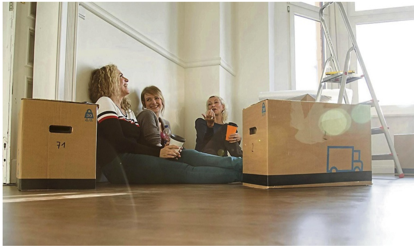
Gute Laune beim Umzug? Mit den richtigen Helfern kann sogar Kartonschleppen Spaß machen.

Ein wichtiger Spartipp: vorab ausmisten. „Je weniger ich mitnehme, desto weniger Umzugskartons brauche ich. Die Kartons selbst kann man oft ge-