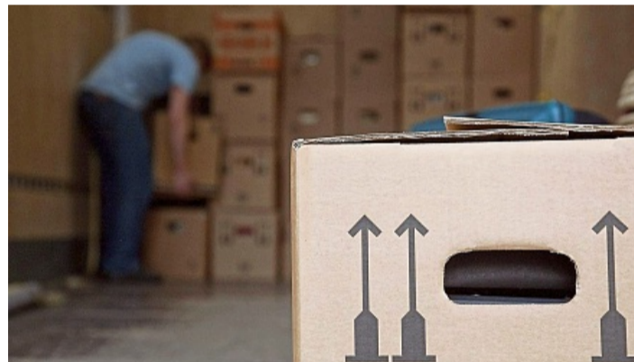
Wohin mit dem Karton? Wer vorher gut beschriftet, muss sich diese Frage nicht beim Umzug stellen.