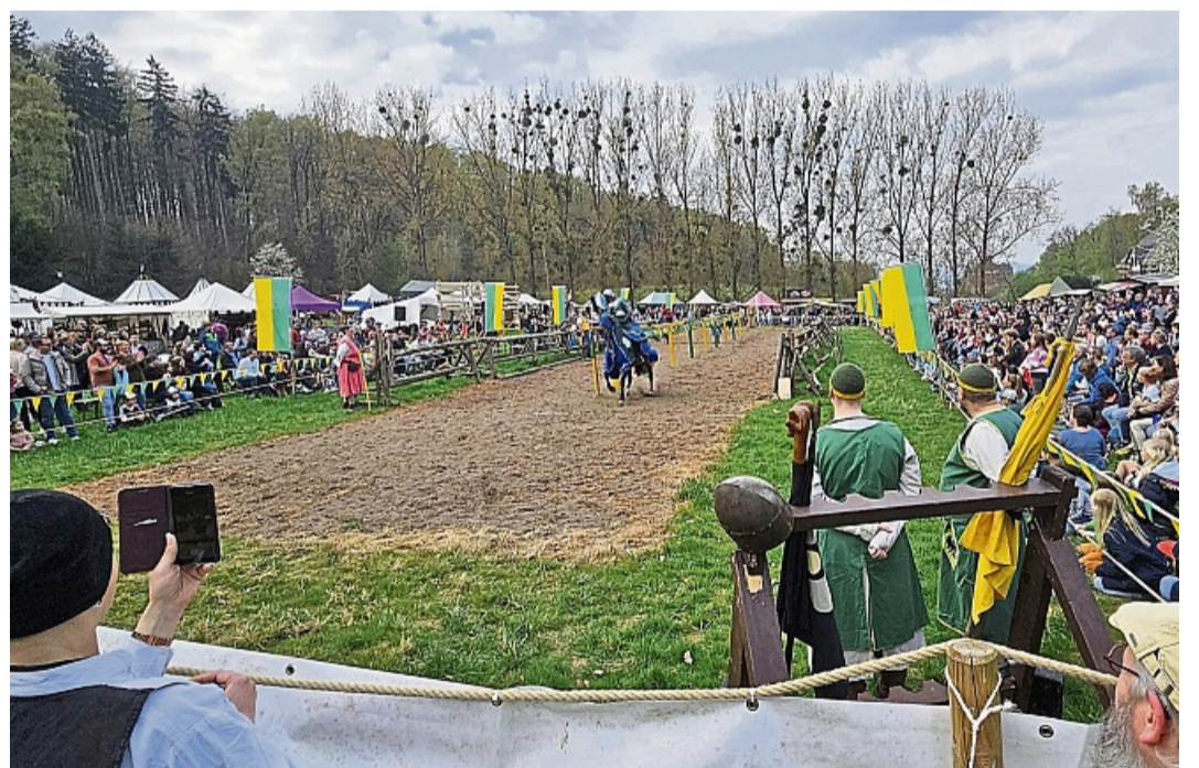
Tausende Besucher säumten am Samstag das Turniergelände am Schloss Berlepsch