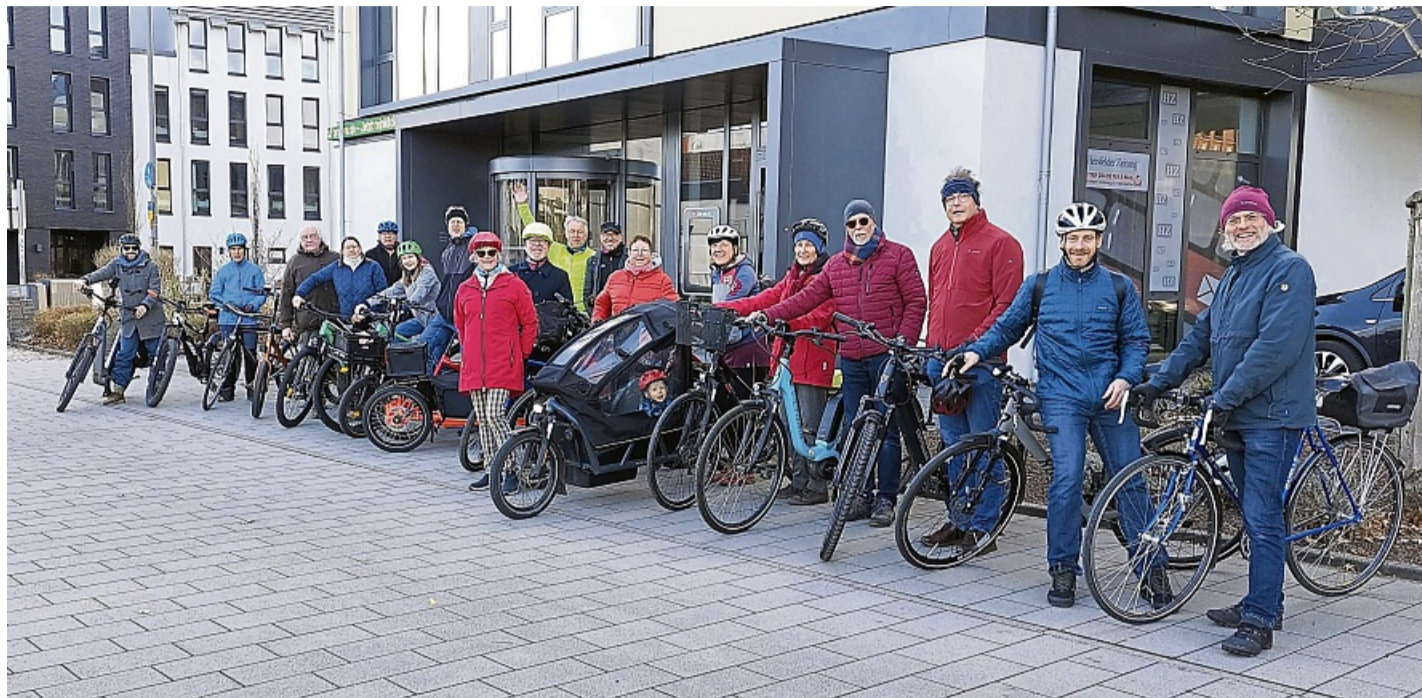
Wollen die Verkehrswende: Die Teilnehmer der Fahrrad-Aktion „Critical Mass“ vor der Abfahrt im Bad Hersfelder Schilde-Park.

Mit ihrer öffentlichkeitswirksamen Aktion wollen die Radelnden ein Zeichen für eine dringend nötige Verkehrswende setzen. Denn wenn mehr Menschen Rad fahren, profitieren alle in der Stadt, meinen sie, und nennen: Weniger Lärm, weniger Abgase, mehr Gesundheit, sichere, emissionsfreie Mobilität im Nahbereich, Platz für Grünflächen, statt für parkende Autos, kürzere Wege,