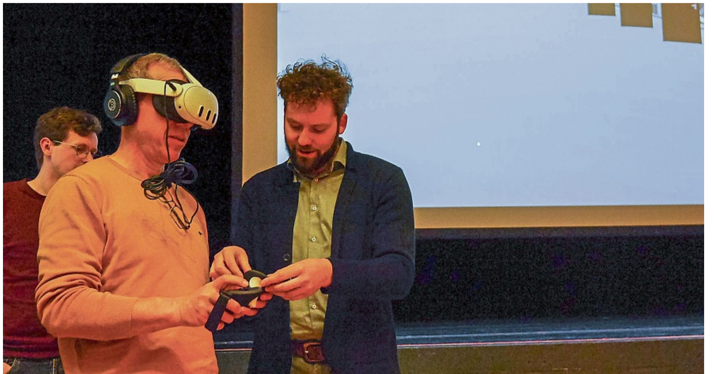
Die Animation der künftigen Lärmschutzwände haben THM-Studenten Interessierten bereits bei einer Infoveranstaltung in Bad Hersfeld mittels VR-Brille gezeigt. Dies wird auch in Ronshausen möglich sein.

Als besonderer Höhepunkt an diesem Informationsabend soll durch eine Animation die optische Wirkung und akustische Wahrnehmung eines vorbeifahrenden Zuges mit verschiedenen hohen Schallschutzwänden gezeigt werden. So, wie es sich künftig auch im Bereich von Ronshausen abspielen könnte, wenn die ICE-Trasse Fulda-Gerstungen durch die Gemeinde verläuft. Dieses interkommunale Projekt LärmLAB wird vom Hessischen Ministeri-