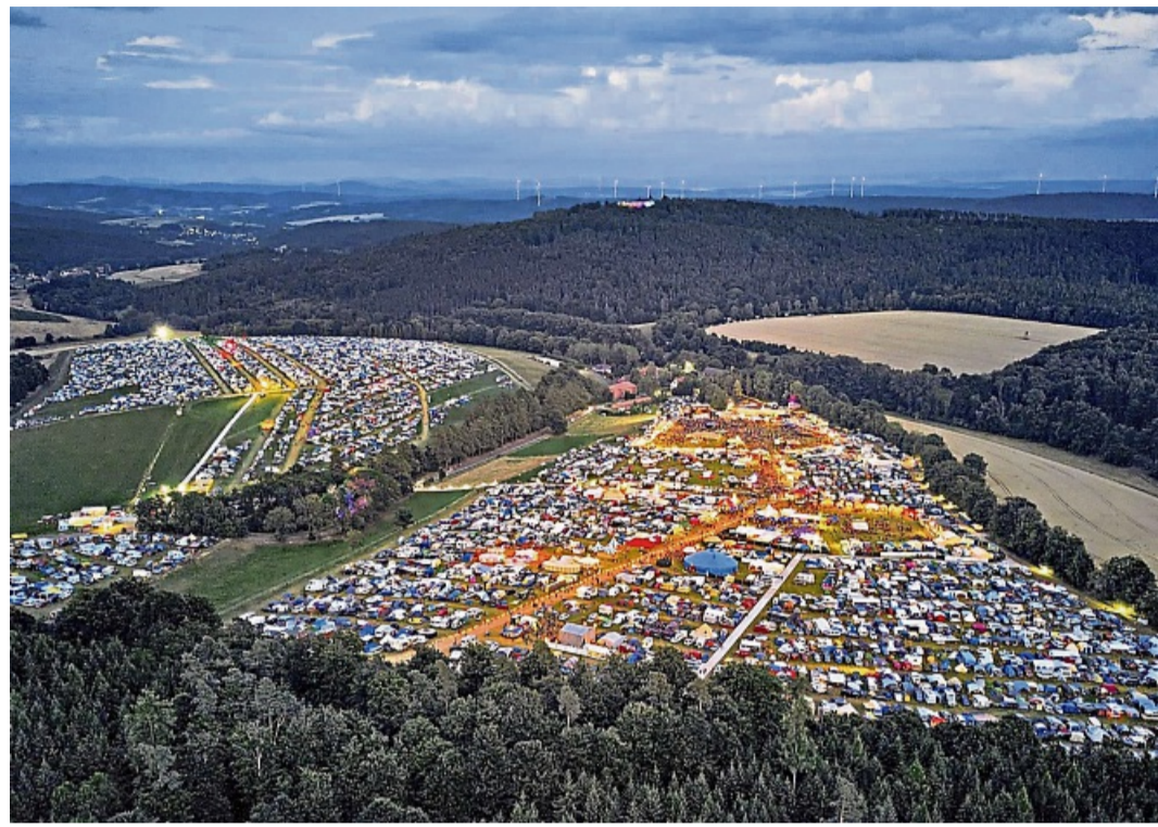
Das Burg-Herzberg-Festival gilt als größtes Hippie-Festival Europas und lockt jeden Sommer mehr als 10.000 Besucherinnen und Besucher an.

Neben den Hauptbühnen gibt es noch viel mehr zu entdecken: Ein weitläufiger Kinderbereich, zahlreiche Workshops, alternative Kleinbühnen, gesellschaftspolitische Infostände sowie ein außergewöhnlicher Fairtrade-Hippiemarkt mit Food und Handwerk aus verschiedenen Kontinenten sorgen für vielfältige Angebote, sodass hier alle auf ihre Kosten kommen. Künstler wie Patti Smith, May-