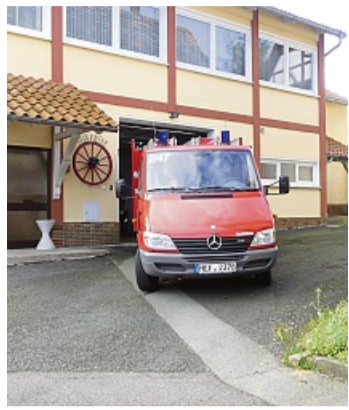
Knifflige Lage: Garage und Ausfahrt der Feuerwehr in Dens sind eine Herausforderung.

Wichtige technische Fortschritte prägten das Jahr: Die Einführung des Infrastrukturkatasters iKAT, die Funk-Nachrüstung des Einsatzleitwagens, Verbesserungen in der Einsatzstellenhygiene sowie die Bestellung eines neuen Hochleistungsflüsters. Gleichzeitig