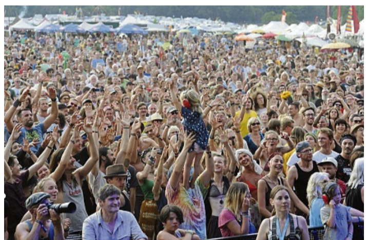
Mehr als 200 Künstlerinnen und Künstler unterschiedlichster Genres werden auf den Bühnen für gute Stimmung sorgen.

kontakt@metzgerei-budesheim.de Für Druckfehler keine Haftung