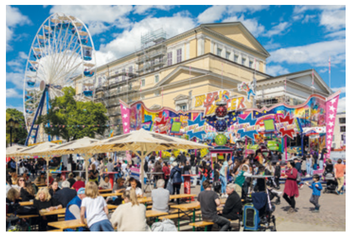
Darmstädter Frühjahrmess

Am Donnerstag, 30. April, von 15 bis 19 Uhr, steht alles im Zeichen der Kindheit: Beim „Kindheitshelden-Tag“ sind unter anderem Bibi & Tina und die Glücksbärchis zu Gast. Alle, die an diesem Tag als „Kindheitsheld“ verkleidet auf die Mess' kommen, erhalten an allen Fahrgeschäften zwei