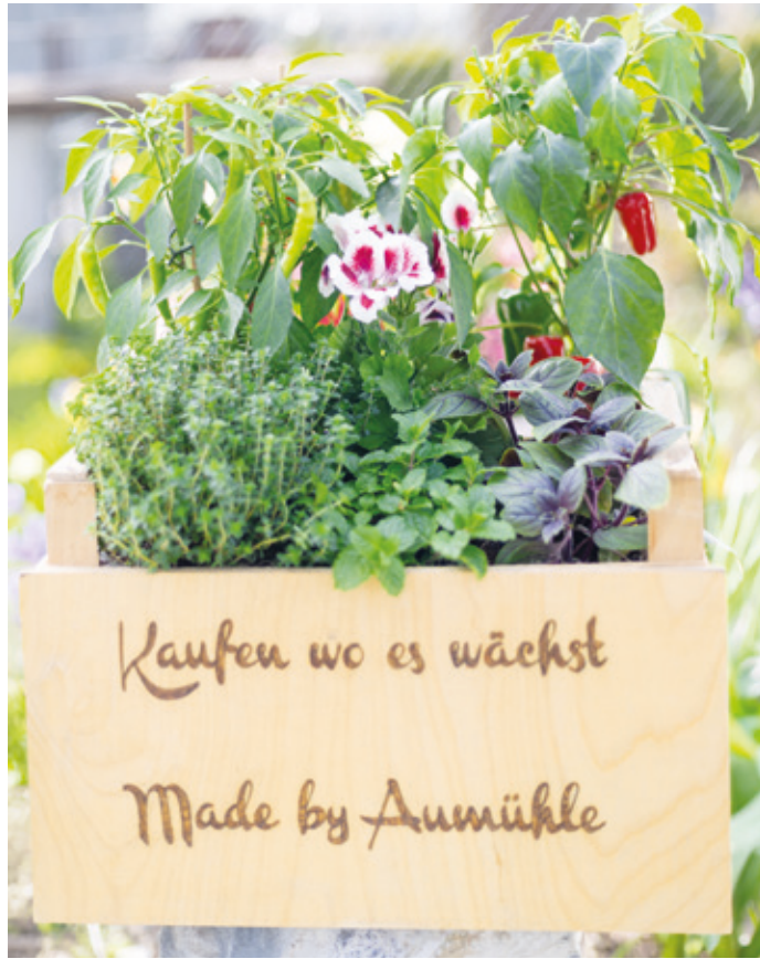
Frisch, gesund, lecker: Kräuter aus der Gärtnerei Aumühle.