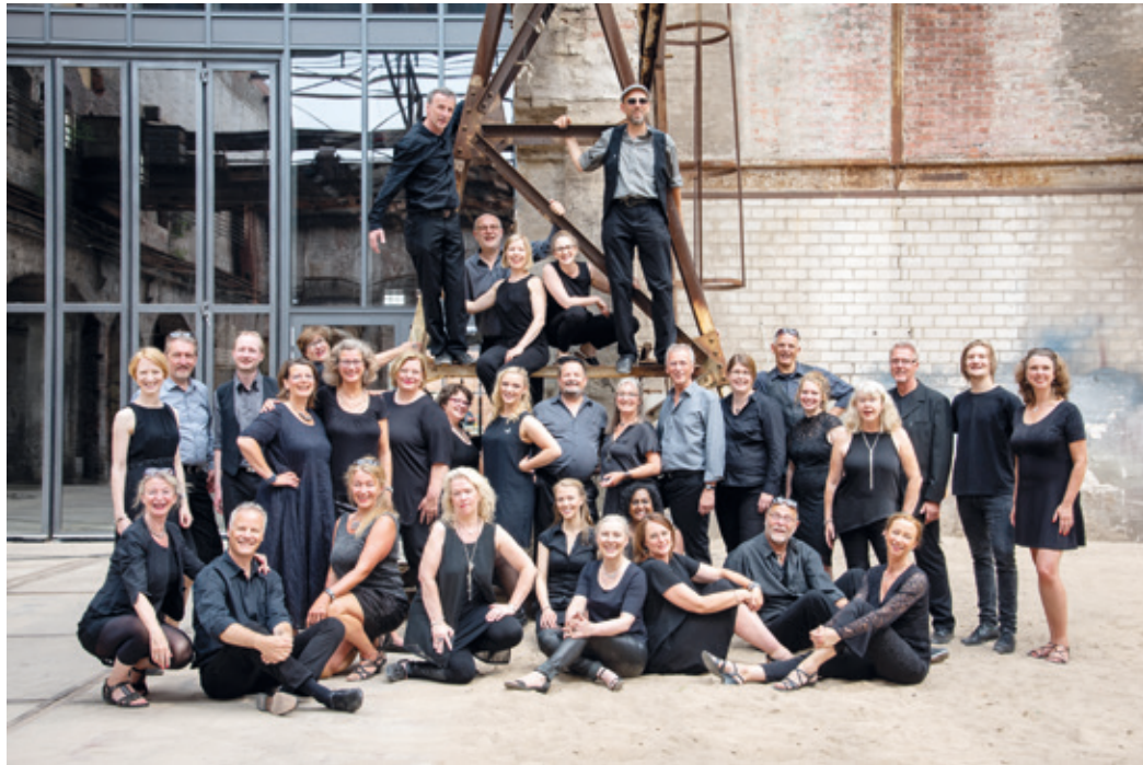
Die Baltic Jazz Singers aus Lübeck.

Wixhausen (cm). Noch keine Karten? Dann wird es nun aber höchste Zeit! Der Chor SurpriSing veranstaltet mit den Baltic Jazz Singers aus Lübeck am Samstag, den 16. Mai, um 19 Uhr im „Saalbau Eigenheim“ in Egelsbach ein großes Gemeinschaftskonzert. Wer herausragenden A-cappella-Gesang hören möchte, sollte diese Gelegenheit nutzen. Zuletzt waren die „Baltics“ 2018 zu Besuch in Darmstadt – gerne erinnern wir uns hier an das gemeinsa-