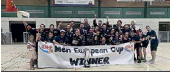
Die Rhein-Main Patriots starten als amtierender Europapokalsieger in die Saison 2026.

Patriots starten am 7. März 2026 in die neue Saison der 1. Bundesliga Skaterhockey