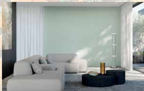
Mit den angesagten Lieblingsfarben erhält das Zuhause eine frische, moderne und gleichzeitig behagliche Ausstrahlung.

Tipps zur Wandgestaltung: Vier neue Lieblingsfarben für das Jahr 2026