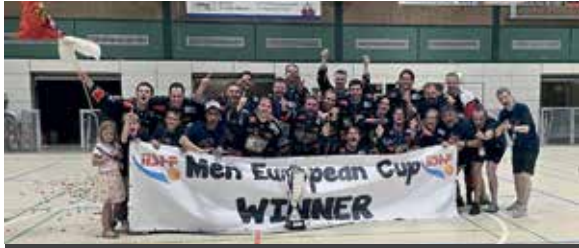
Die Rhein-Main Patriots starten als amtierender Europapokalsieger in die Saison 2026.

Patriots starten am 7. März 2026 in die neue Saison der 1. Bundesliga Skaterhockey