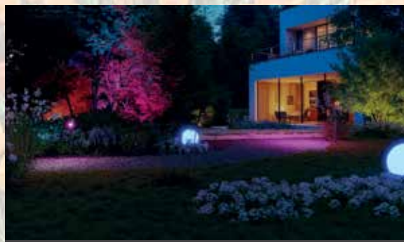
Verschiedene Leuchten und Farben zaubern eine magische Licht-Atmosphäre im eigenen Garten.

24V Garten-Lichtsystem von Steinel. Es besteht aus Steh- und Kugelleuchten sowie verschiedenen Spots für Wege oder Beete, die individuell miteinander kombiniert werden können. Zudem lässt es sich ganz einfach selber installieren. Die oberirdische Verlegung der Kabel und das