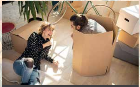
Gemeinsam im neuen Zuhause angekommen.

- Ein bis drei Wochen vorher: Kisten packen und beschriften. Schilder für Halteverbotszonen organisieren.