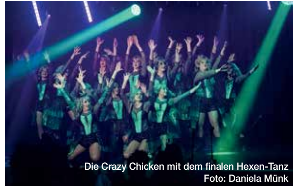
Die Crazy Chickens mit dem finalen Hexen-Tanz

„Hexenkessel“ im Bürgerhaus Nieder-Wöllstadt begeistert mit Show, Tanz und Humor