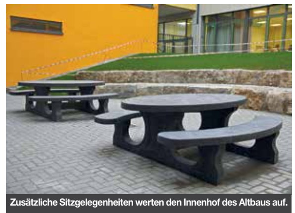
Zusätzliche Sitzgelegenheiten werden den Innenhof des Altbaus auf.

Neue Mitglieder sind willkommen. Der Mindestbeitrag beträgt 24 Euro pro Jahr. Weitere Informationen sind auf der Website der Schule unter www.kssk.de/partnerfoerderer/foerderverein abrufbar.