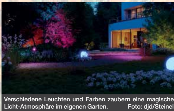
Verschiedene Leuchten und Farben zaubern eine magische Licht-Atmosphäre im eigenen Garten.

besten gelingt das mit einem Lichtsystem wie dem 24V Garten-Lichtsystem von Steinel. Es besteht aus Steh- und Kugelleuchten sowie verschiedenen Spots für Wege oder Beete, die individuell miteinander kombiniert werden können. Zudem lässt es sich ganz einfach selber