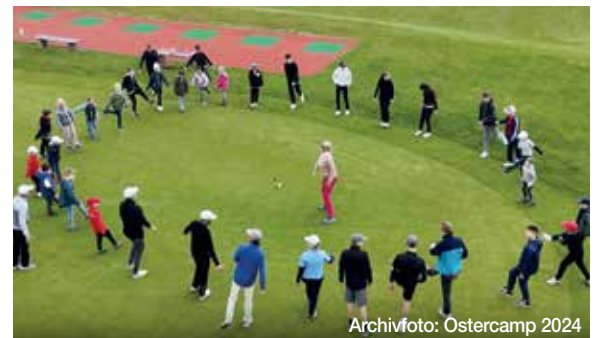
Archivfoto: Ostercamp 2024