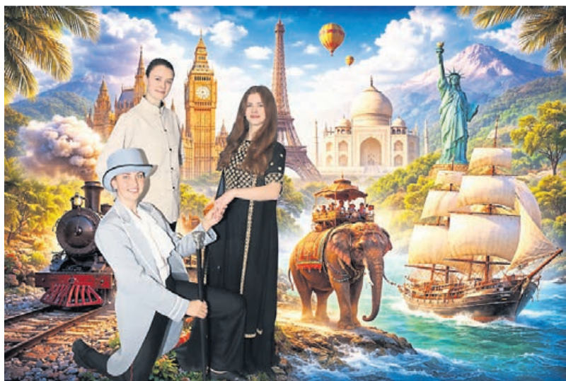
PM Tanzasia 2026 Mr Foggs Reise 1.