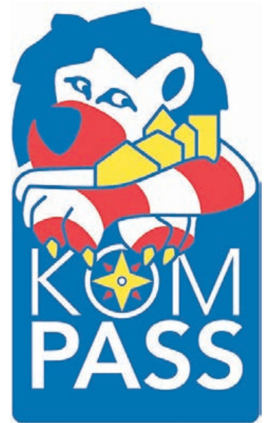
Grafik: Hessisches Ministerium des Innern, für Sicherheit und Heimatschutz

Die Umfrage umfasst verschiedene Themenbereiche, die das Sicherheitsempfinden im Alltag prägen können. Dazu gehö-