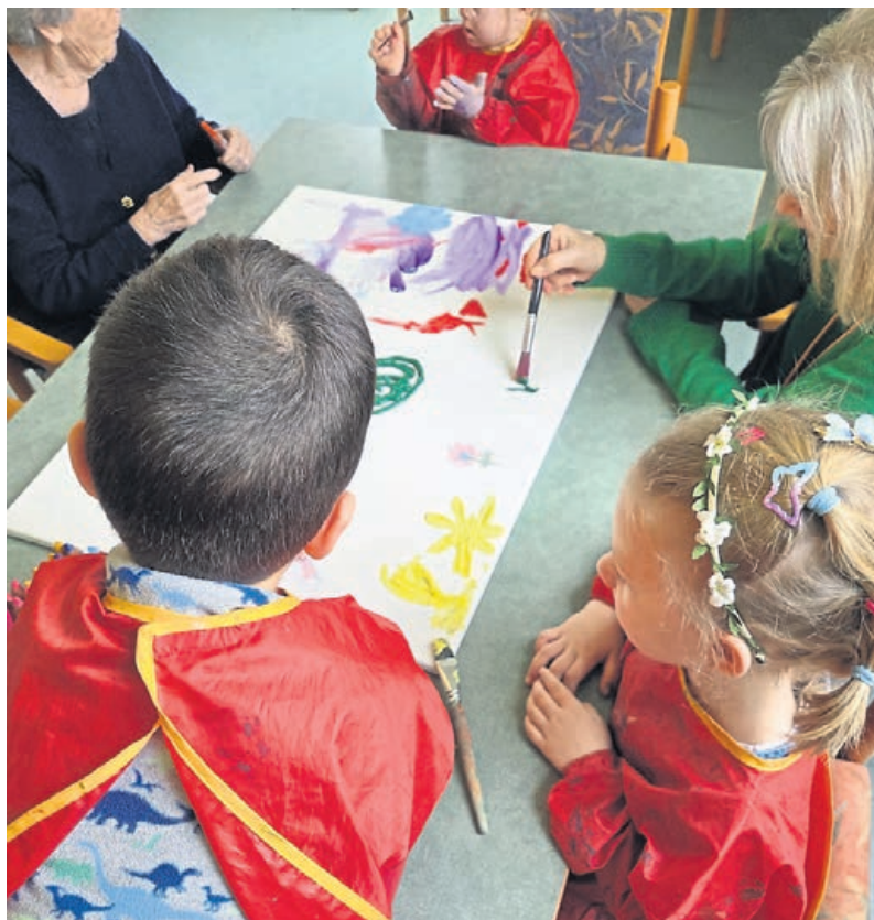
Besuche in Seniorenresidenz

Mit dem neuen Angebot entsteht ein Rahmen, in dem Begegnung, Austausch und gegenseitige Unterstützung im Alltag selbstverständlich werden können.