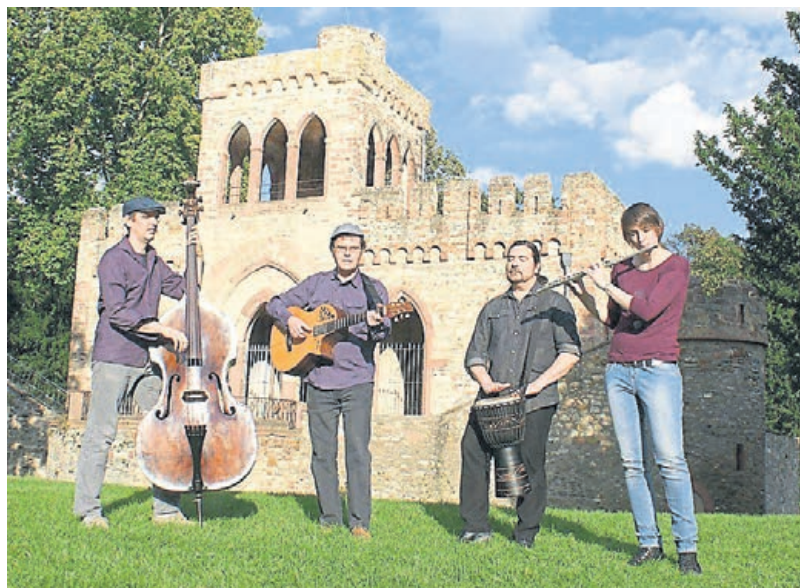
Folk Live Band Tinker's Coin

Tinker's Coin ist am 8. Mai um 20 Uhr (Einlass 19.30 Uhr) im Saal des Pfarrzentrums St. Ferrutius, Bleidenstadt. Mit vielstimmigem Gesang, Querflöte, Gitarre, Akkordeon und Kontrabass sind sie schon lange regional bekannt.