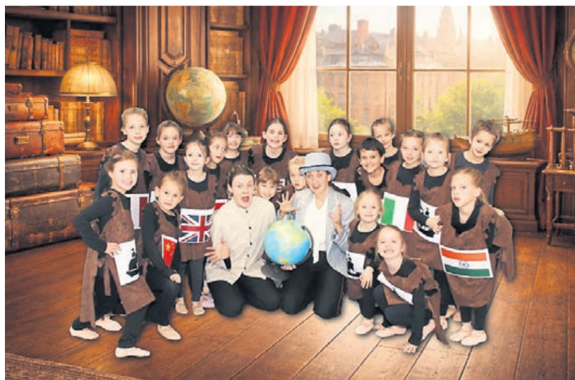
PM Tanzasia 2026 Mr Foggs Reise 2.

Das Showtanz-Ensemble Tanzasia des TV Hahn bringt am Pfingstweekende seine neue Produktion „Mr. Foggs Reise in 80 Tagen“ ins Bürgerhaus Taunus in Taunusstein-Hahn.