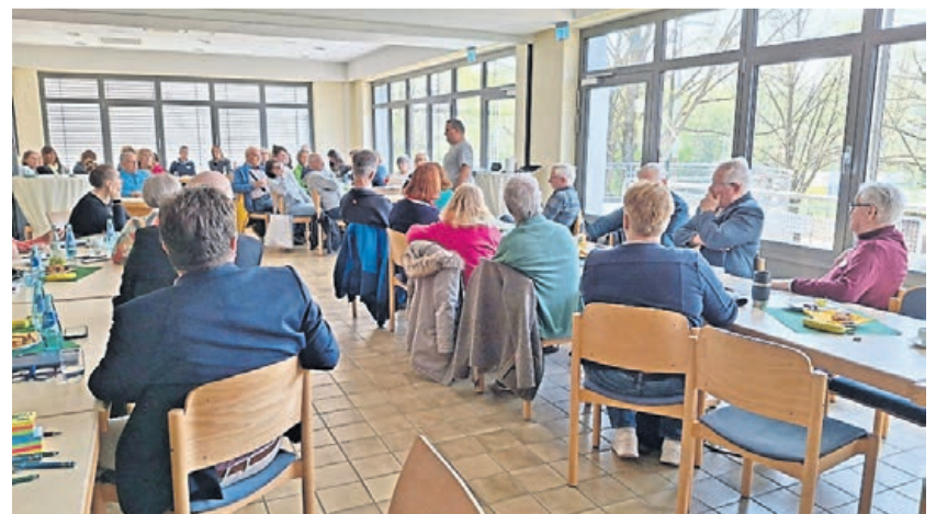
Netzwerktreffen des Netzwerk Wohnen