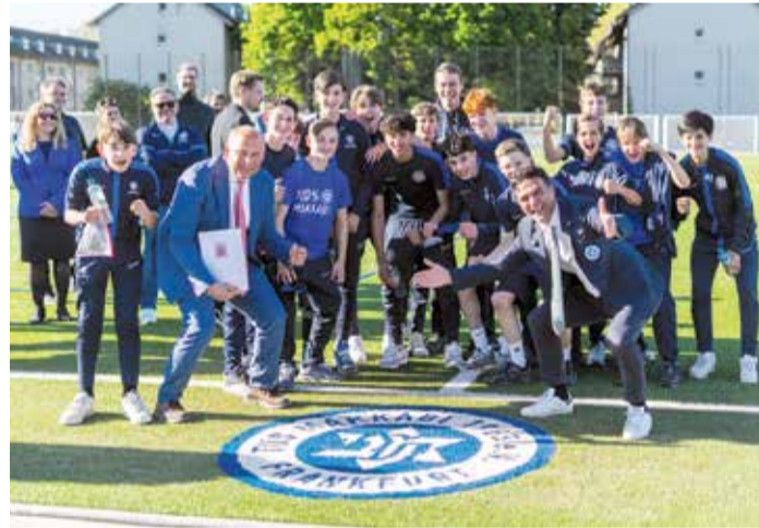
Innenminister Roman Poseck mit Alon Meyer umrahmt von den aktiven und gutgelaunten MAKKABI Vereinsmitgliedern.

über rund 297.600 Euro überreicht. Unterstützt wird der Aufbau eines Bildungs- und Präventionszentrums im Rahmen des Projekts „Zusammen1“. Ziel ist es, Antisemitismus im Sport frühzeitig zu begegnen – durch Workshops, Trainings und konkrete Hilfsangebote für Vereine und Verbände. Das Projekt setzt dabei bewusst auf den Sport als Raum für Begegnung und demokratische Bildung. „Sport verbindet und stärkt unsere Demokratie. Mit der Förderung setzen wir ein klares Zeichen gegen Antisemitismus und für Respekt im hessischen Sport“, betonte Innenminister Roman Poseck.