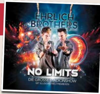
DESIGN: CHRISTIAN SEIDEL

Gewinnspielfrage: Wie heißt die neue Stadionshow der Ehrlich Brothers?