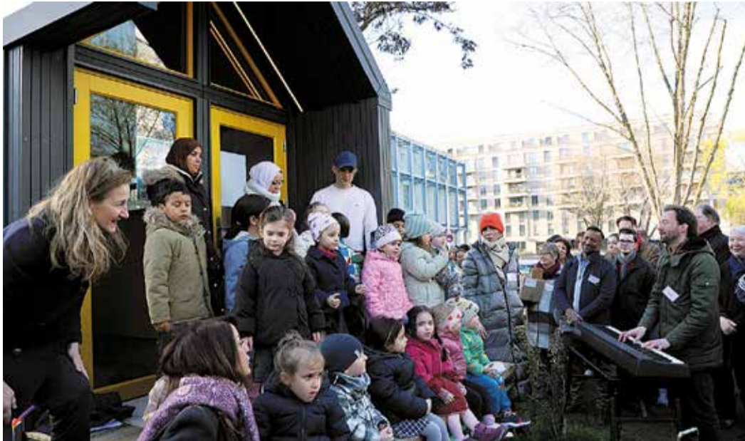
Ein Ständchen durch die Kinder der benachbarten KITA.

Tiny Church in Niederrad eröffnet · Ökumenisches Projekt startet