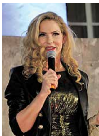
Sonya Kraus als echtes Frankfurter Mädsche ist Botschafterin für die Stadt.