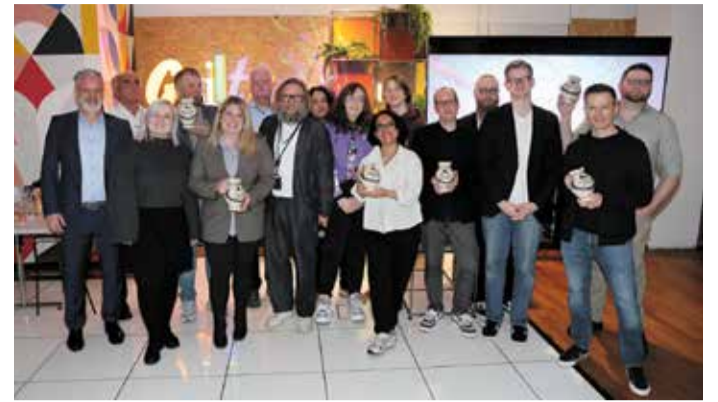
Die Auftaktveranstaltung im Massif Central brachte Wirtschaft und Frankfurter Gaming Entwickler an einem Abend zusammen.

Im Fokus standen neben innovativen Games auch die wirtschaftliche Bedeutung der Branche sowie ihre Rolle als Motor für Kreativität und digitale Entwicklung. Die Veranstaltung machte deutlich, wie vielfältig Gaming heute ist – von Programmierung und Design über Kunst und Musik bis hin zu neuen Anwen-