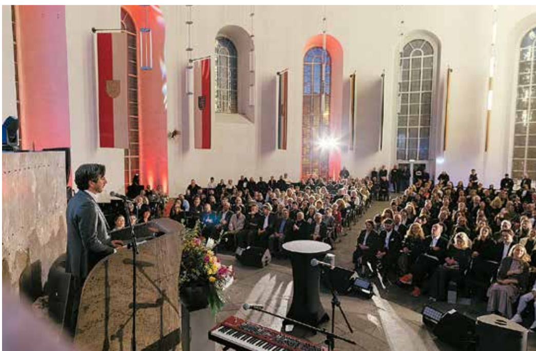
Der Blick in die gut gefüllte Paulskirche, die der Begrüßung lauschte.