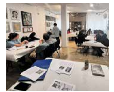
Frankfurt im Wandel: Nach einer thematischen Stadtführung setzten sich Jugendliche in einem Workshop im Günter-Feldmann-Zentrum mit Zuwanderung und der Stadtgeschichte Frankfurts auseinander.

Eskandari-Grünberg betont: „Wir müssen Haltung gegen Rassismus und für mehr Menschenwürde zeigen.“ Die Veranstaltungen leisten dazu einen wichtigen Beitrag und stärken den gesellschaftlichen Zusammenhalt.