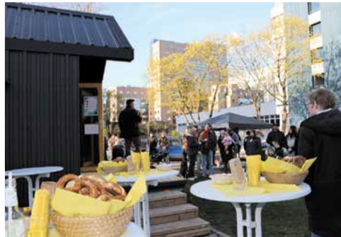
Was ist Heimat? Brezeln und Spundekäs sind typisch für unsere Heimat.

Stadtkirche hob hervor, dass selbst die lange Entstehungszeit Teil des Konzepts gewesen sei: „Ungeduld gehörte zum Projekt – und hat eine starke Gemeinschaft entstehen lassen.“ Auch evangelische und katholische Vertreter betonten die Bedeutung des Projekts für die Ökumene vor Ort. Die Tiny Church zeige, wie Kirche heute funktionieren könne: flexibel, nah an den Menschen und ohne große Bauprojekte. Künftig soll die Tiny Church mit vielfältigen Angeboten bespielt werden – von Begegnungsformaten über kulturelle Veranstaltungen bis hin zu praktischen Aktionen im Quartier. Geplant sind unter anderem regelmäßige Treffen, ein Poetry Slam sowie interkulturelle Angebote. Mit der Tiny Church entsteht im wachsenden Stadtteil Niederrad ein neuer Treffpunkt – klein in der Fläche, aber groß in seiner Idee: ein Ort für Austausch, Gemeinschaft und neue Formen des Miteinanders.