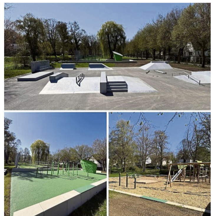
Die neue Skateanlage ist nur einer von sechs Bereichen, der den Korbachern zur Erholung und Freizeitbeschäftigung dienen soll.