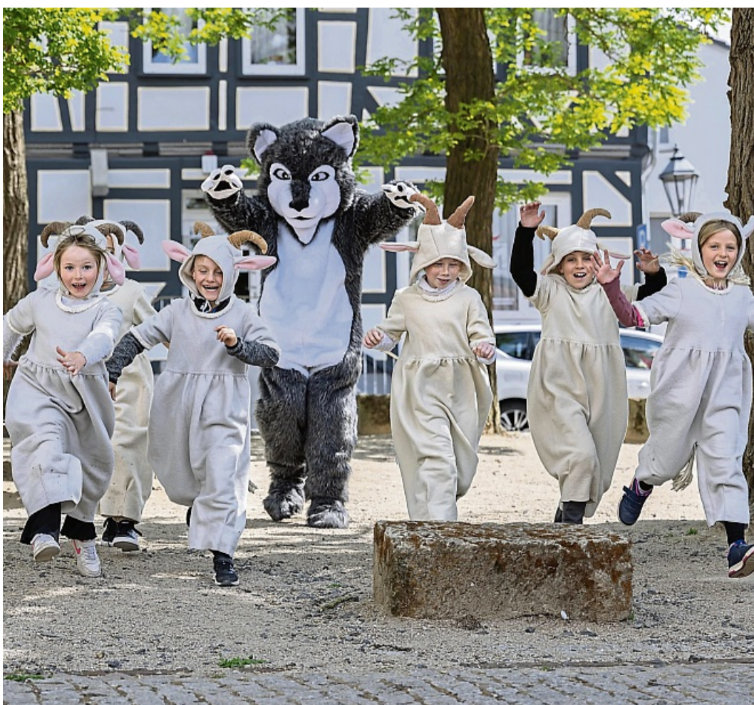
Der Wolf und die Geißlein.

■ CINE K KINO Korbach Billie Eilish - Hit Me Hand an Soft (3D): Di 19.30 h Der Super Mario Galaxy Film (3D): Sa 17.30 u. 19.45 h, So 17.30 u. 20 h, Mo bis Mi 17.15 u. 19.30 h // 2D: Sa u. So 13 u. 15.15 h, Mo bis Mi 15 h Der Teufel trägt Prada: Sa 13, 15.15, 17.30, 20 u. 22 h, So 13, 15.15, 17.45 u. 20.15 h, Mo bis Mi 15, 17.30 u. 20 h Der Wunderweltenbaum: Sa 13 u. 15.15 h, So 13, 15.30 u. 17.45 h, Mo bis Mi 15 u. 17.15 h Die progressiven Nostalgiker: Mi 19.45 h Für immer ein Teil von dir: So u. Mo 19.45 h Hoppers: Sa u. So 13 h Horst Schlämmer sucht das Glück: Tägl. 17.45 h Lee Cronin's The Mummy: Sa 20 u. 22.30 h, So 20 h, Mo bis Mi 19.45 h Met Opera - Eugen Onegin - Tschairowsky: Sa 19 h Michael: Sa u. So 15, 17.15 u. 19.45 h, Sa auch 22.30 h, Mo u. Mi 15, 17 u. 19.30 h, Di 15, 17 u. 19.45 h Shelter: Sa 22.45 h Tom und Jerry - Der verlorene Kompass: Sa u. So 13 u. 15.15 h, Mo bis Mi 15 h