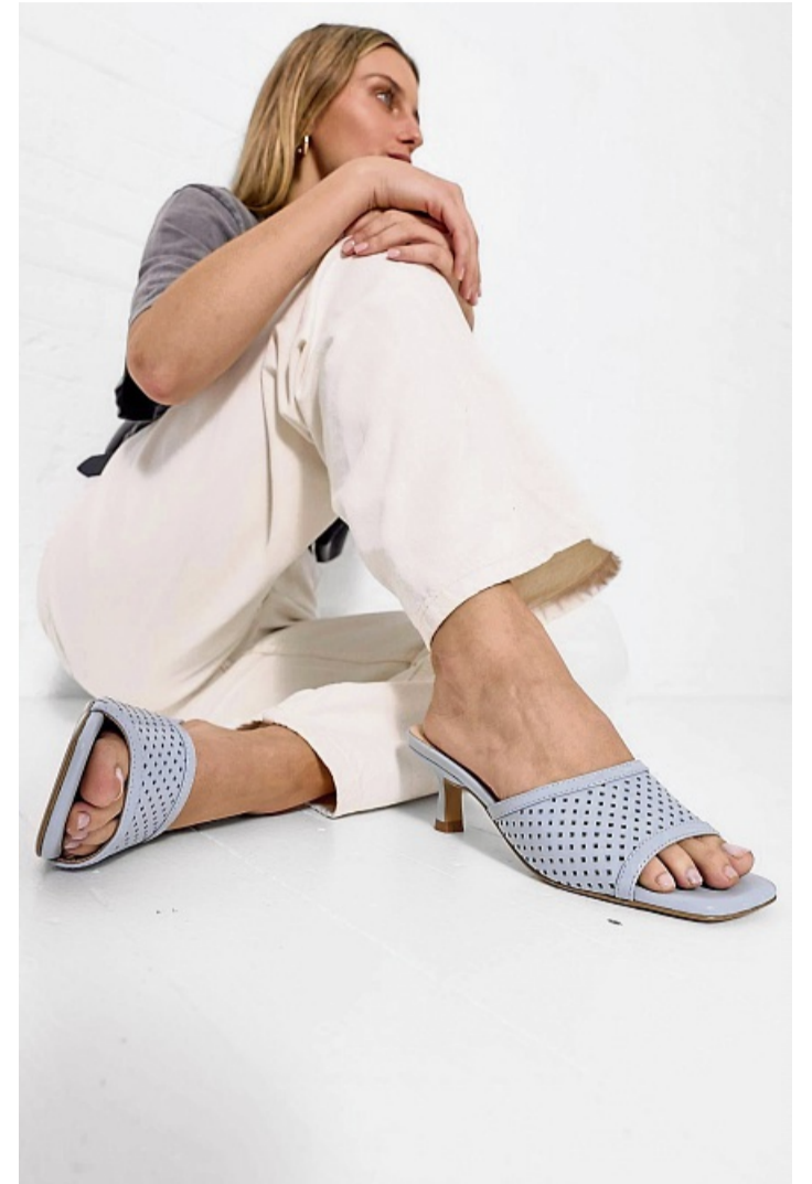
Dünne Absätze machen Sandalen elegant. Hier zu sehen bei einem Modell von Apple of Eden.