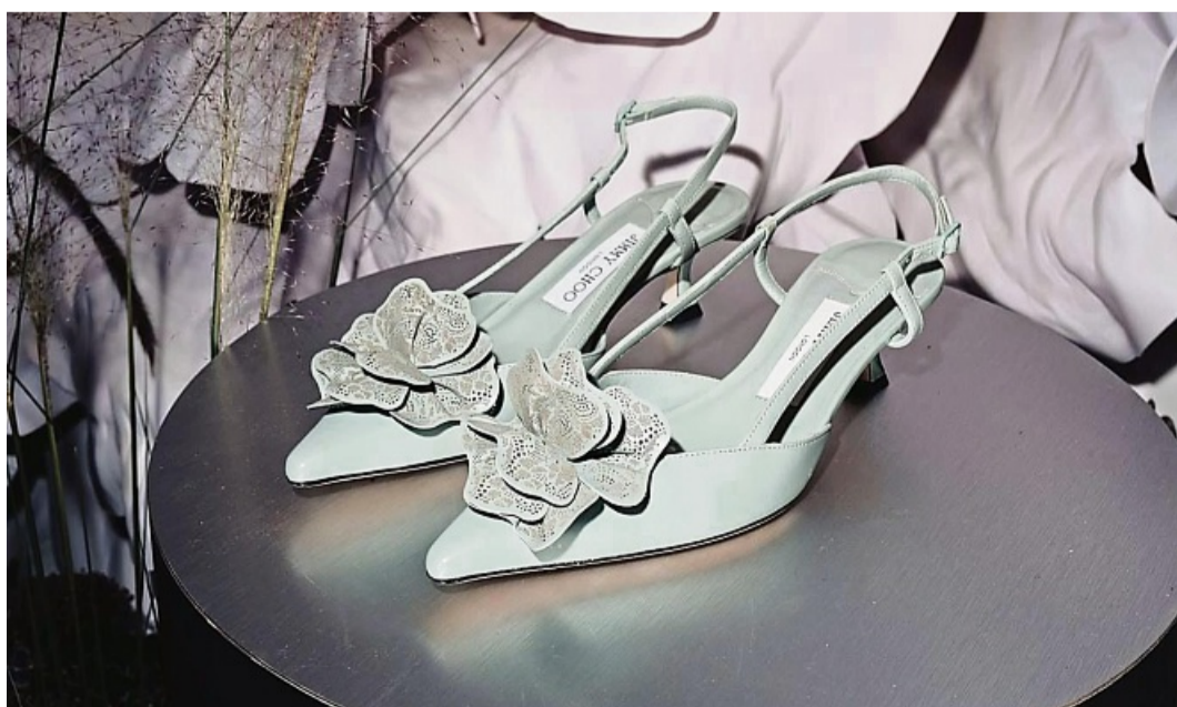
Auffällig und sommerlich floral: Schuhe mit extravaganten 3D-Blütenapplikation liegen voll im Trend.