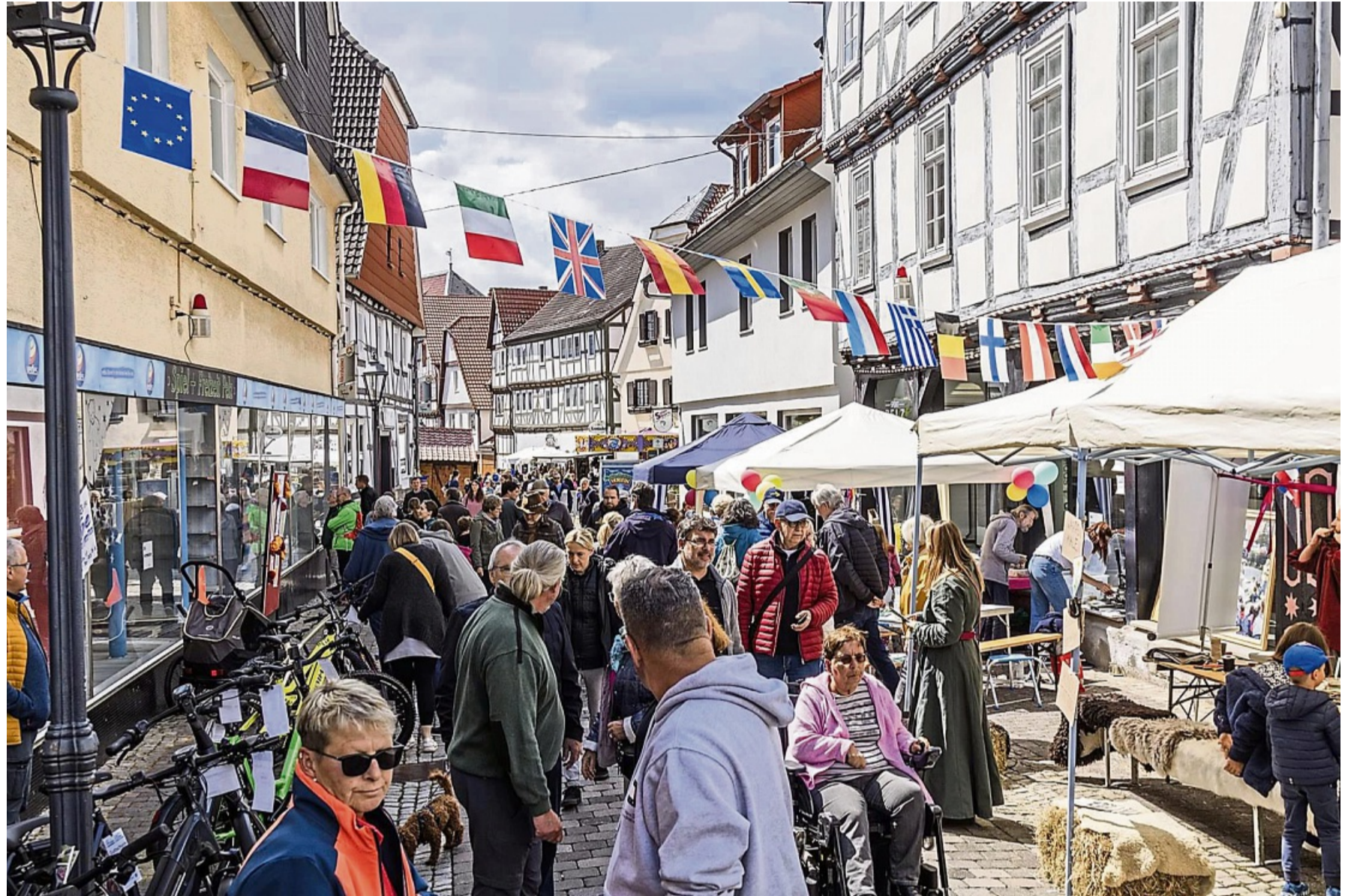
Viele Aktionen laden die Besucher des Wolfhager Stadtfestes zum Mitmachen und Entdecken ein. Hier Trubel in der Mittelstraße im vergangenen Jahr.