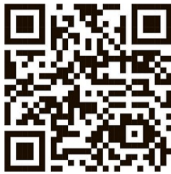
QR-Code Stadtfest Wolfhagen

Das Shanty-Rudel-Singen am Sonntag, ab 14.30 Uhr, verspricht viel Spaß. Der Shantychor „Drunken Sailor“ aus Ippinghausen als „Weidelsburg-Piraten vom Elbestrand“, bringt maritimes Flair an den Hans-Staden-Platz. Mit bekannten deutschen und englischen