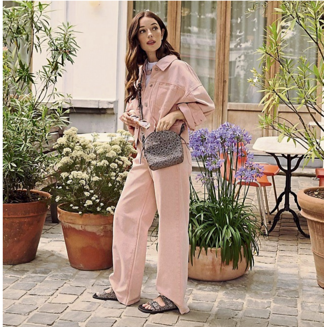
Kein Sommer ohne Sandalen. Auch flache oder derbere Exemplare sind in diesem Sommer häufig zu sehen.

Lederschuhe sind Schulz zufolge das ganze Jahr über eine gute Wahl. „Man kann aber gern auch zu Stoff greifen, also zu natürlichen Materialien wie Leinen und Baumwolle“.