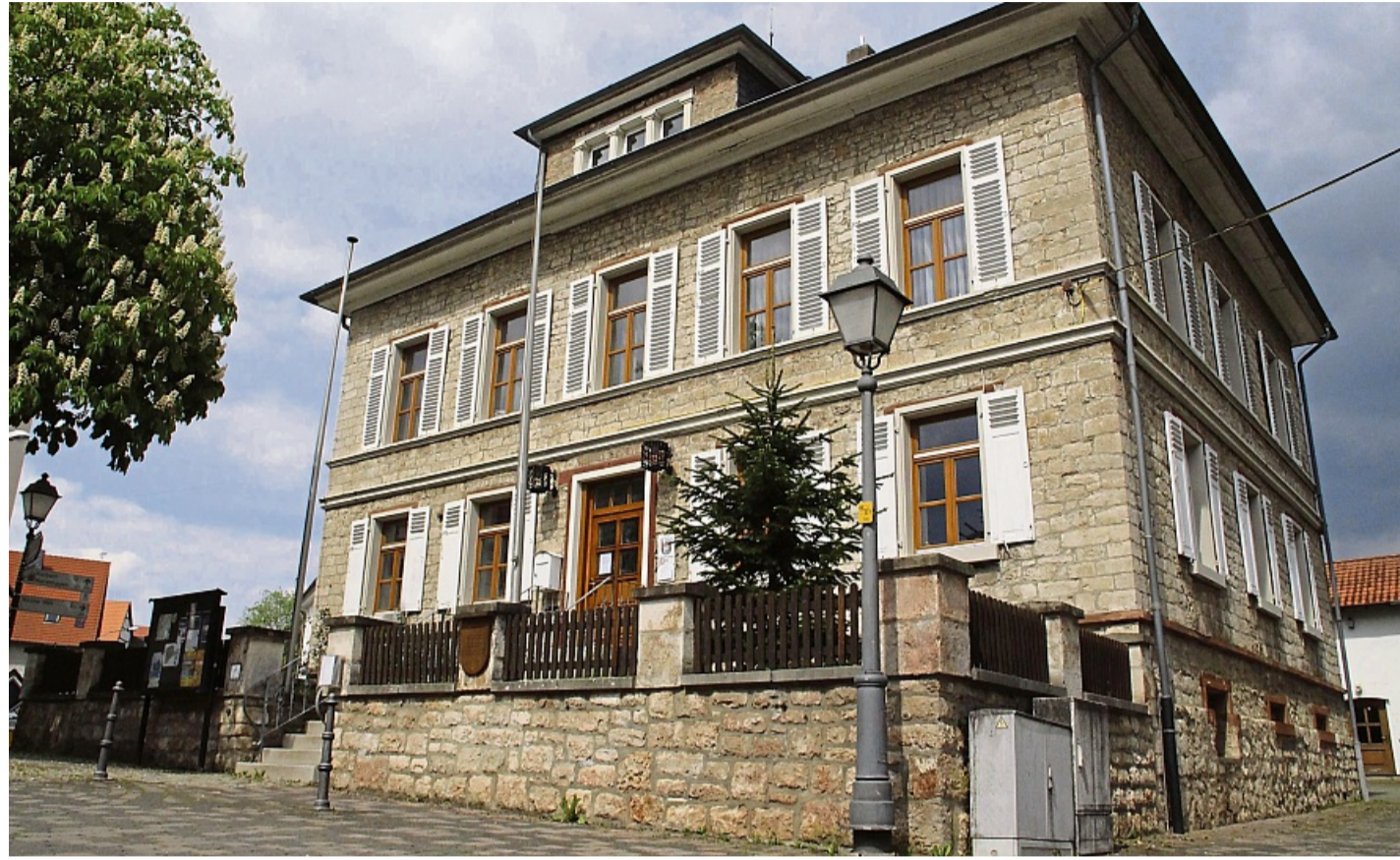
Nicht mehr mitreden kann die FDP im Vöhler Rathaus.