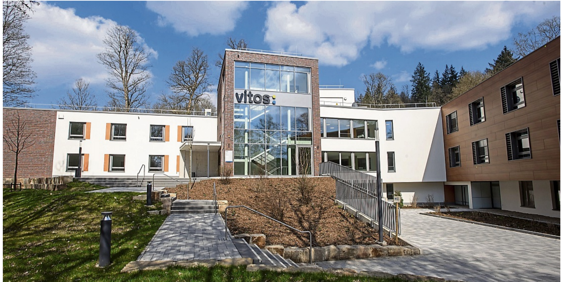
Der Neubau der Vitos Klinik für Psychiatrie und Psychotherapie Haina wird im Mai eröffnet. Am Freitag, 8. Mai, haben alle Interessierten die Möglichkeit, den Neubau zu besichtigen und sich umfassend zu informieren.

Gleichzeitig bleibt der Altbau ein wichtiger Bestandteil des