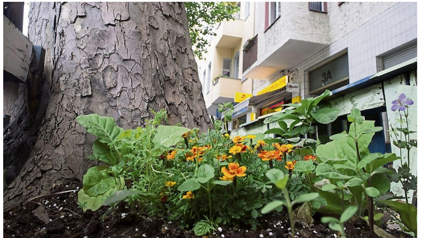
In Großstädten sieht man häufig kleine Beete mit hübschen Blumen um die Straßenbäume herum.

Aber nicht jede Baumart eignet sich dafür. Manche Bäume mögen es laut BUND nicht, wenn die Erde in Wurzelnähe bearbeitet wird. Zudem darf man auch nicht in jedem Bezirk einfach loslegen. Bevor man so ein Projekt startet, also am bes-