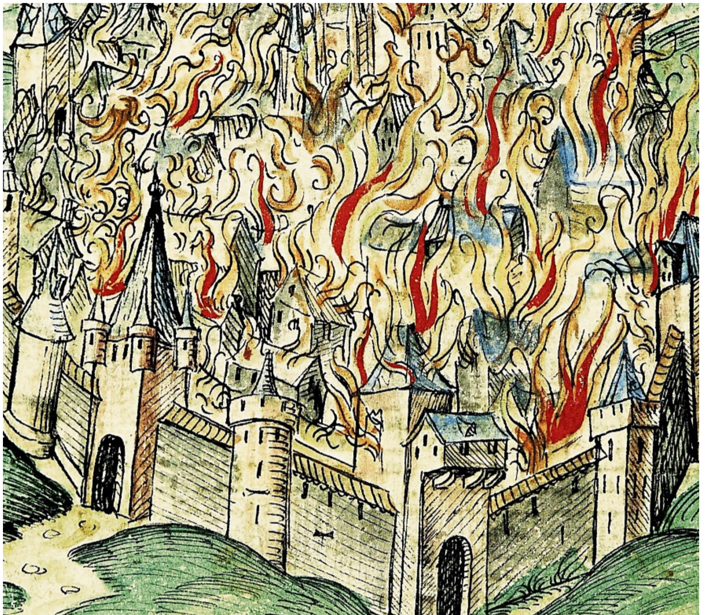
Ein verheerendes Flammenmeer: So bildete der Illustrator in Wigand Gerstenbergs Stadtchronik den Großbrand der Altstadt vom 9. Mai 1476 ab. Deutlich zu erkennen sind die Liebfrauenkirche und im Hintergrund die Türme der Burg.

Beide Veranstaltungen des Geschichtsvereins am Freitag 8. Mai, 17 Uhr, Philipp-Soldan-Forum, und Samstag 9. Mai, 15 Uhr, Rathaus Obermarkt, sind öffentlich und kostenlos. zve