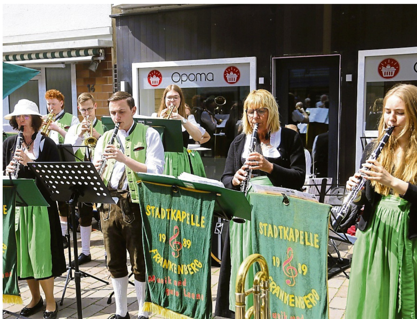
Die Stadtkapelle Frankenberg gehört zu den Stammgästen bei den Frankenger Stadtfesten.

Ein besonderer Höhepunkt feiert in diesem Jahr Premiere: An beiden Tagen findet ab 11 Uhr ein Spielzeugflohmarkt für Kinder statt. Hier dreht sich alles um Spielsachen – verkauft werden darf ausschließlich,