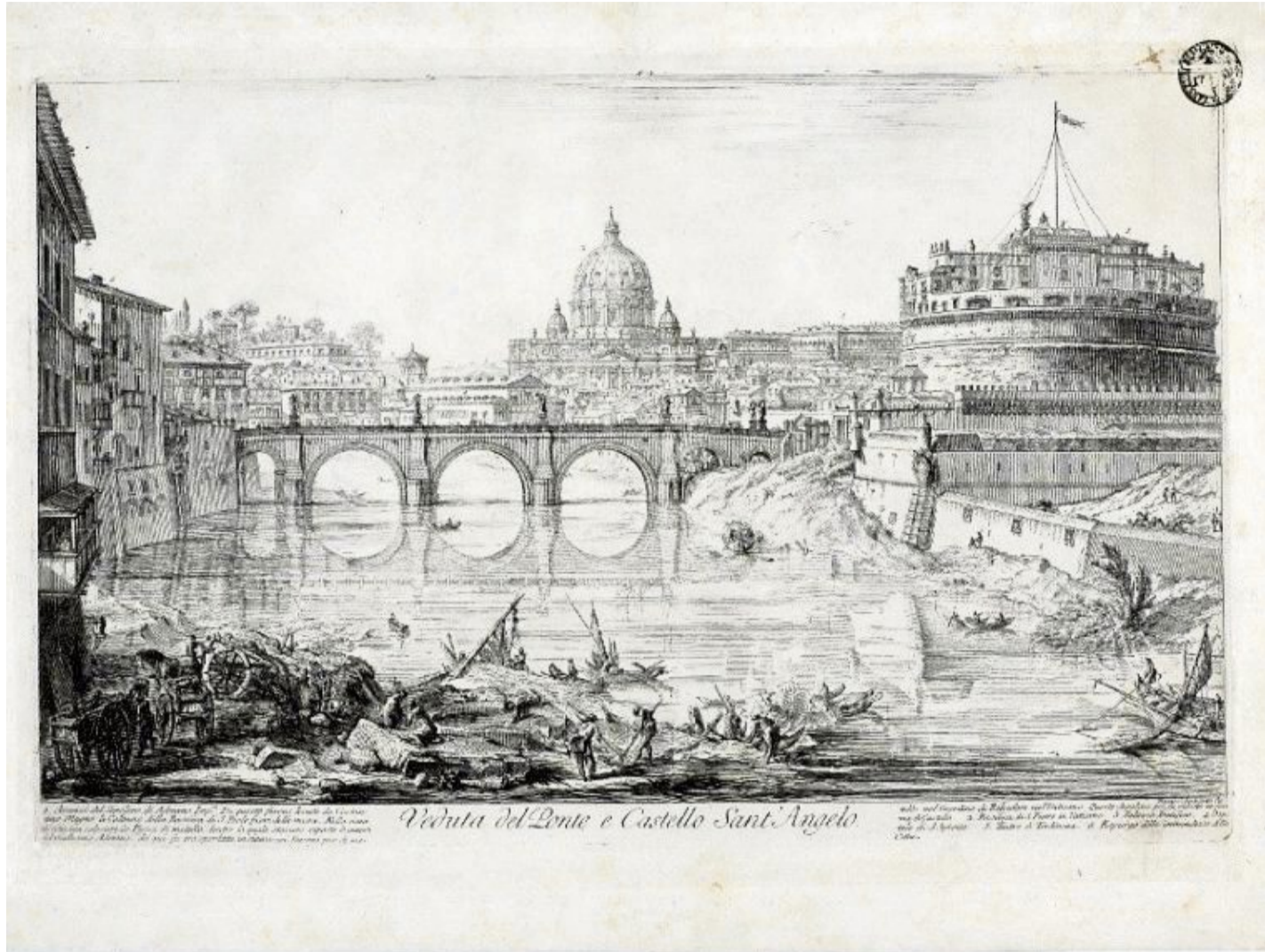
Sehnsuchtsort: Aktuell zeigt der Frankenberger Kunsttreff Ansichten von Rom, im Bild Petersdom, Engelsburg und Engelsbrücke von Piranesi.