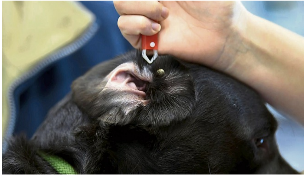
Zecken mögen weiche, gut durchblutete Körperstellen – so auch die Ohren.

Besonders gerne mögen Zecken weiche, gut durchblutete Körperstellen, etwa den Achsel- und Lendenbereich sowie die Ohren. Häufig setzen sich Zecken auch im Hals- oder Kopfbereich, etwa auf der Schnauze fest. Wer eine Zecke auf der Haut oder im Fell seines Vierbeiners entdeckt, sollte sie möglichst schnell entfernen. Denn manche Krankheitserreger werden über den Speichel der Zecken erst nach und nach übertragen. Mit Blick auf den Menschen schreibt das Robert Koch-Institut etwa: Nach einem Einstich dauert es ein bis zwei