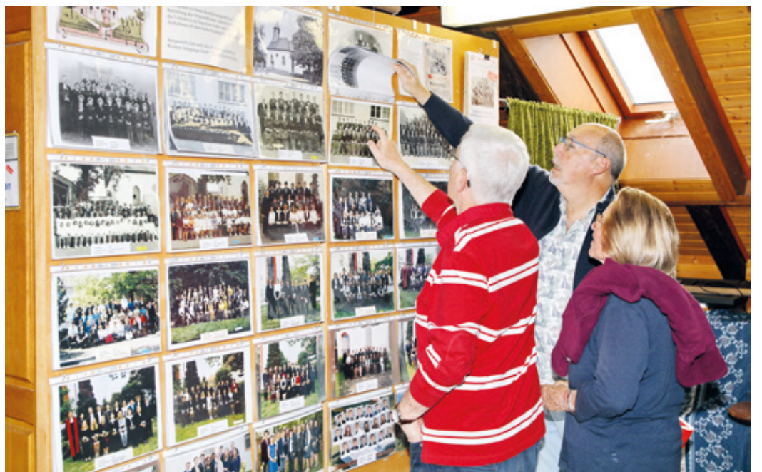
Die Sammlung der Konfirmations-Bilder aus über 120 Jahren ist immer wieder ein Anziehungspunkt für die Besucher des Dorfmuseums.

Erzhausen (gw). An jedem ersten Sonntag im Monat öffnet das Museum Erzhausen von 14-17 Uhr seine Türen. Wer Lust hat, die vielfältigen Schätze des Dorfmuseums in aller Ruhe zu entdecken – auf Wunsch auch im Rahmen einer kleinen Führung durch Mitglieder des Ortskundlichen Arbeitskreises – ist herzlich eingeladen, die alte Schillerschule in der Hauptstr. 12 zu besuchen und ganz entspannt durch die Ausstellungsräume zu schlendern. Dabei gibt es viel zu entdecken: Neben historischen landwirtschaftlichen Geräten erwarten die