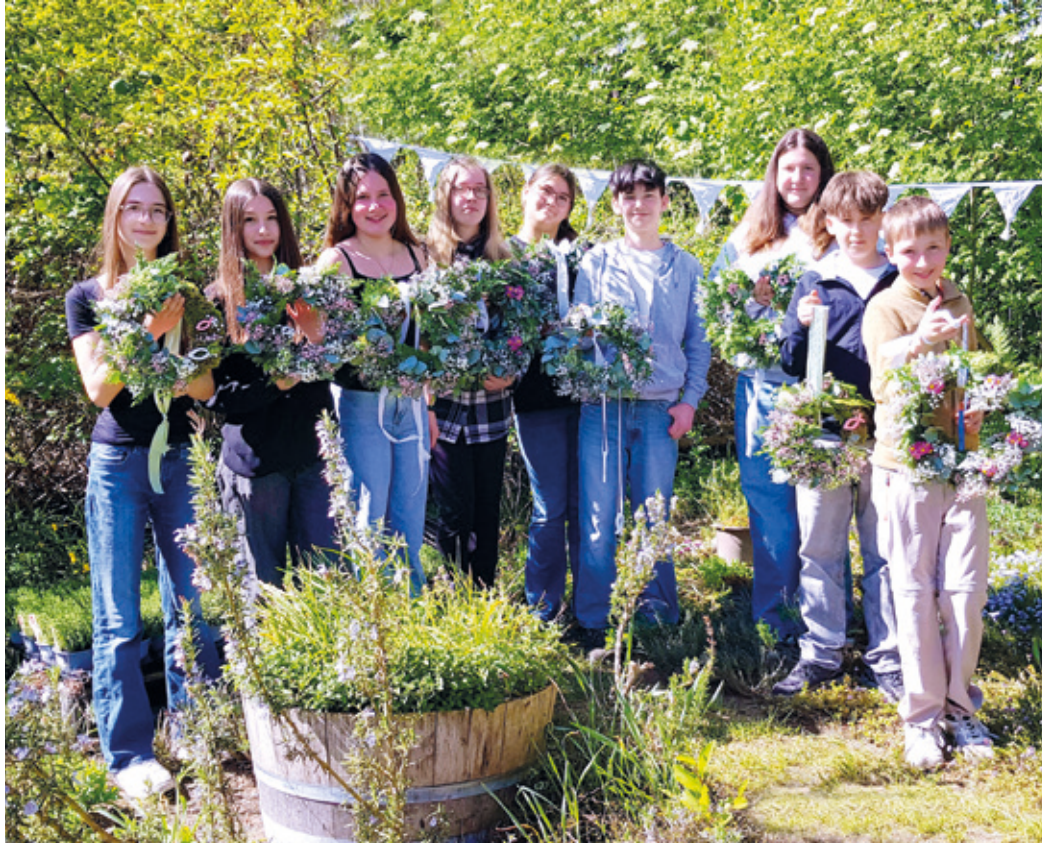
Zum Abschluss stellten sich die Konfirmand*innen mit ihren Kränzen zu einem gemeinsamen Foto auf ein wunderbares, sommerliches Bild!

Erzhausen (gw). Gemeinsam mit der Evangelischen Kirchengemeinde hat der Ortskundliche Arbeitskreis einen alten Brauch wiederbelebt: das Binden von Konfirmationskränzen, die traditionell am Haus aufgehängt werden. Während der Coronapandemie musste diese Tradition einige Jahre pausieren, konnte aber inzwischen erfolgreich wiederaufgenommen werden.