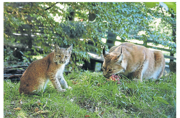
Ein junger Luchs und seine Mutter sind im Tiergarten Weilburg zu beobachten.

Kontakt: Tiergartenstraße, 35781 Weilburg, Telefon 06471-626284, www.hessen-forst.de/freizeit/tiergarten-weilburg