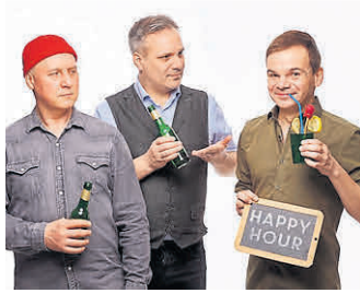
Die Band „Glas-Blas-Sing“.

(red). Auf dem Lindenhof in Weilburg-Hasselbach gibt es am Samstag, den 23. Mai, 20 Uhr feinstes Kabarett mit René Sydow: „Sie dürfen sich wieder setzen!“ Hingerissen von Sprache und hergerissen von den politischen Entwicklungen sucht René Sydow in seinem neuen Programm nach Antworten auf die großen Fragen unserer Zeit: Was ist passiert?