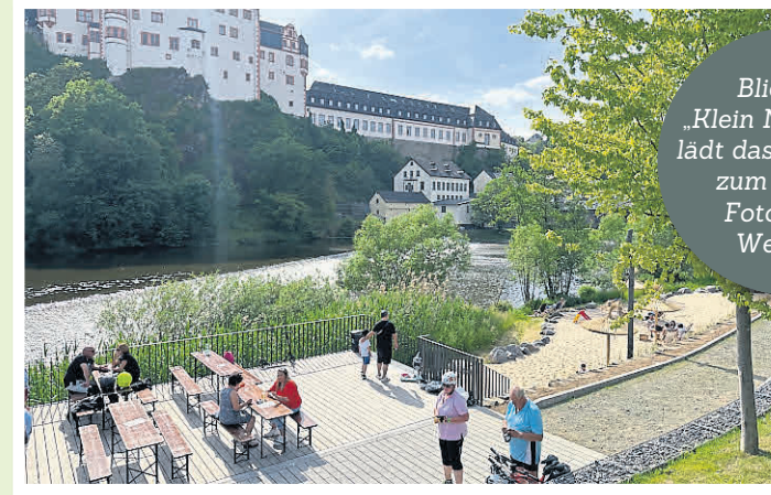
Blick auf „Klein Nizza“, hier lädt das Strandgut zum Besuch.

Umfangreiche Speisekarte mit köstlichen Gerichten aus italienischer und internationaler Küche, immer frisch und delikater zubereitet. Im Sommer auch mit Außengastronomie. Weilburger Straße 2, 35781 Weilburg-Odersbach, Telefon 06471-1396.