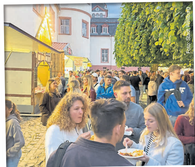
Geselligkeit und kulinarisches Genießen gehören zum Weinfest dazu.