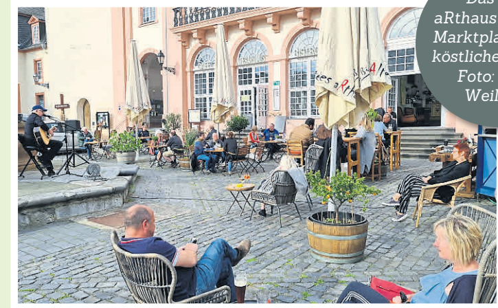
Das Alte aRthaus auf dem Marktplatz bietet köstliche Speisen.

Köstliche Eisspezialitäten und italienischer Kaffee in charmantem Ambiente in der Stadtmitte. Im Sommer mit Außenbestuhlung. Neugasse 3, 35781 Weilburg, Telefon 06471-2594.