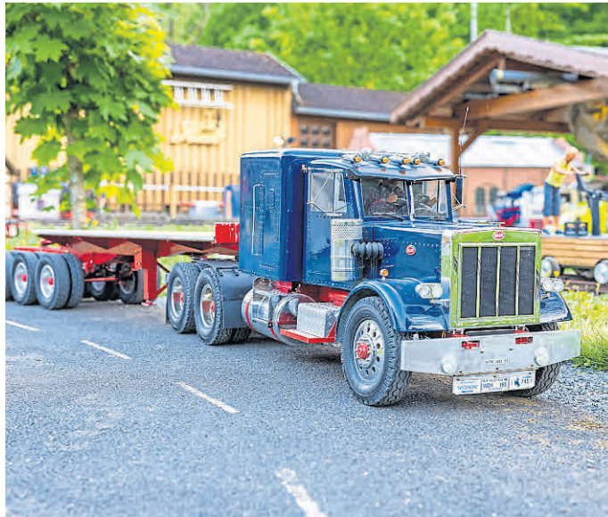
Eines der vielen interessanten Fahrzeuge im Maßstab 1:8 gibt es im Modellbaupark zu erleben.

(red). Der Modellbaupark in Weilburg öffnet erstmalig am Samstag, den 9. Mai, von 13 bis 22 Uhr und am Sonntag, den 10. Mai, von 10 bis 17 Uhr seine Tore. Die Besucher erwartet am Samstag ein einzigartiges Erlebnis: bis 22 Uhr findet eine stimmungsvolle Nachtfahrt mit beleuchteten Modellfahrzeugen und Miniaturwelten statt.