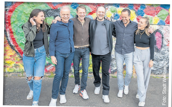
Die Band Purple Banana sorgt am Samstag Abend für Stimmung und Tanzmusik.