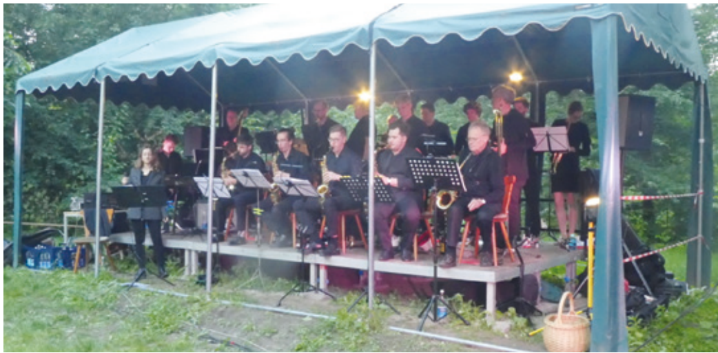
TU Bigband.

Egelsbach (re). Am Samstag, den 30. Mai 2026, erwartet die Gäste ein besonderer musikalischer Genuss auf der Bühne am Naturfreundehaus Egelsbach. Die Bigband der TU-Darmstadt wird ein unterhaltsames Konzert geben.