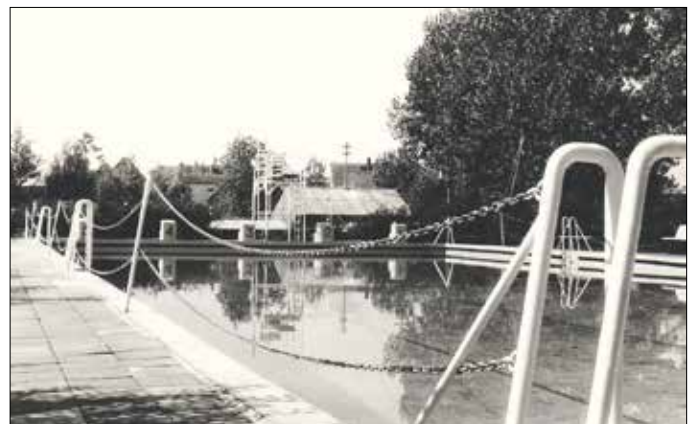
Das Schwimmerbecken in der Anfangszeit des Bades.

Seit 2020 wurde die Anlage umfassend erneuert. Dazu zählen moderne Technik, eine Photovoltaik- und Thermosolaranlage sowie die Neugestaltung des Nichtschwimmerbeckens.