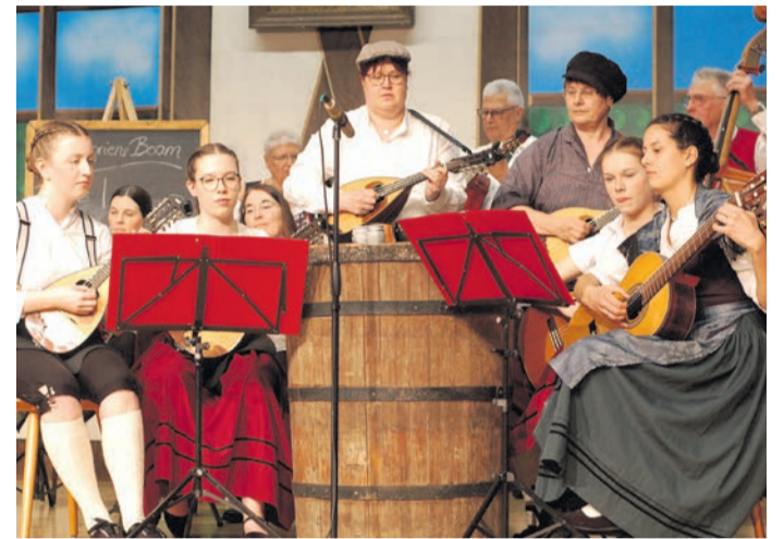
Der OWK Eppertshausen machte beim Heimatabend in der Bürgerhalle den Anfang mit seinen Darbietungen.

dig, die breite Seite über der Stirn verriet vergeben - für manche Spötter auch „Brett vorm Kopf“. Da in allen drei OWK-Ortsgruppen getanzt wird, machten die Tanzdarbietungen einen Schwerpunkt im Programm aus. Wenngleich nicht direkt sichtbar, haben die Vereine „neuzzeitliche“ Herausforderungen: In Eppertshausen fehlen die Männer, in Groß-Umstadt vermisst man seit Corona eine Jugendabteilung. Um Defizite in der Stärke auszugleichen, mischten sich beim Heimatabend die Gruppen ein wenig durch. Die größte Bühnenpräsenz versprühte der OWK Reichelsheim, dessen Aktive sogar einmal in Holzschuhen auftraten. Alleine die Trachtengruppe umfasst rund 70 Mitglieder, inklusive einer Musikkapelle, die sämtliche Tänze des Abends mit zünftigen Klängen untermalte. In Sachen Musik musste sich der