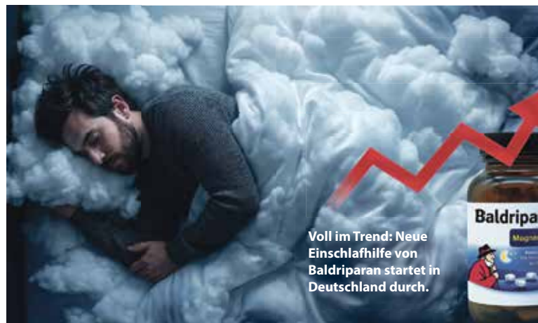
Voll im Trend: Neue Einschlafhilfe von Baldriparan startet in Deutschland durch.

Magnesium als Einschlafhelfer ist in den USA längst ein Megatrend. Nun sorgt ein deutsches Präparat auch hierzulande für Furore: Baldriparan Magnesium PLUS wurde als eines der erfolgreichsten Neuprodukte 2025 im renommierten Online-Apotheken-Ranking 3 ausgezeichnet. Profitieren Sie jetzt von diesem Boom: Viele Probleme im Schlaf könnten mit Magnesiummangel in Verbindung stehen. Die bekannte Schlafmarke setzt auf die optimale Kombination der Inhaltsstoffe. Wir decken auf, welche Rolle Magnesium und Melatonin beim Einschlafen spielen können.