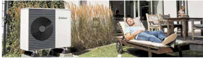
Entspannt zurücklehnen und von Einsparungen bei den Heizkosten profitieren: Moderne Energiemanagementsysteme für die Wärmepumpe machen es möglich.

(DJD). Smart vernetzt ermöglichen Wärmepumpensysteme eine nachhaltige und vor allem kostensparende Wärmeversorgung im Neubau und bei der Modernisierung im Bestand. Durch ein intelligentes Energiemanagement lässt sich der Betrieb optimieren, um Energiekosten zu senken. Der digitale Service EnergiePLUS etwa funktioniert mit allen Vaillant Wärmepumpen, die über ein Inter-