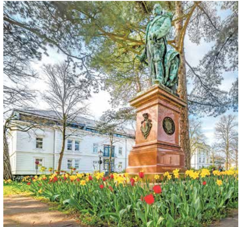
Der Adalbertplatz in Wilhelmshaven: Eine blühende Oase inmitten der Innenstadt.

Rund die Hälfte des gesamten Stadtgebiets besteht aus weitläufigen Gärten und Parks. Zu den schönsten Rückzugsorten zählt der Stadtpark mit altem Baumbestand, geschwungenen Wegen und stillen Wasserflächen. Nicht