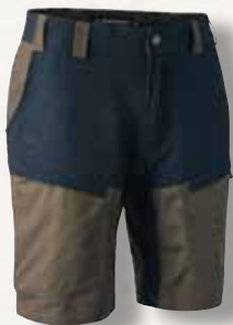
Strike kurze Hose

Strike Shorts bestehen aus Vier-Wege-Stretch für gute Beweglichkeit und Komfort.