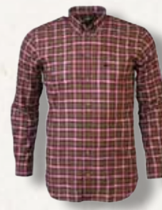
Hemd Karo Rot Button-Down

Flanellhemd in Ganzjahresqualität, samtweicher Griff und angenehmes Tragegefühl, eine Brusttasche mit Knopf.