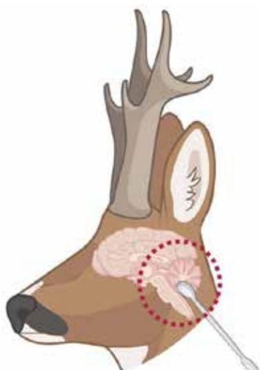
Gehirnprobenentnahme beim Rehwild (illustriert mit Biorender.com)

Die Gehirnprobe wird bevorzugt für die CWD-Untersuchung verwendet!