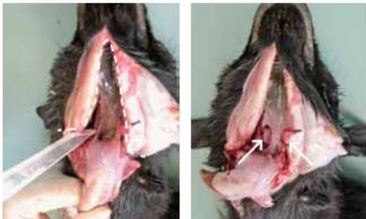
Blick auf die tiefen Halslymphknoten nach Entfernen des Gescheides (Siehe: https://www.sg.ch )