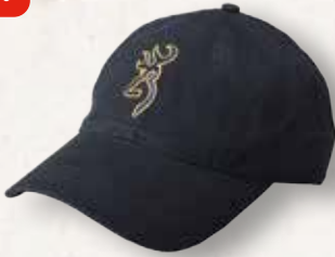
Browning Kappe „Gold Buck Blue“

Größe passt sie sich bequem an. Für den Einsatz bei Jagd & Outdoor-Aktivitäten. Best.Nr.: AK89413000 €24,95 €10,99