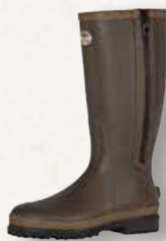
Tracker Comfort Neopren

Gefütterte Tracker Comfort Neopren Gummistiefel in Braun, wasserdicht, bis -25 °C, mit Reißverschluss.