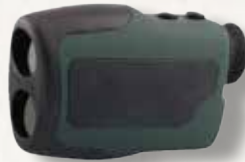
AKAH LRF 600

Passiver Gehörschutz nach EN 352-1 für Jagd und Schießsport. Best.Nr.: AK37616 €29,90 €24,99