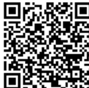
Video: Probenentnahme beim Reh

3. Probenmaterial in Probengefäß überführen und bis zum Versand tiefgefroren lagern