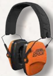
Isotunes Sport Defy Slim Passive Gehörschutz

Futtermal für Waffen mit aufgesetzter Optik und Schalldämpfer geeignet. Best.Nr.: AK63367 €33,00 €22,99