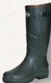
Tracker Neopren Gummistiefel

Tracker Neopren-Gummistiefel in Dark Olive. Neoprenfutter, selbstreinigender Profilschuh und hoher Kälteresistenz.