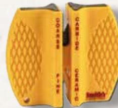
Smith Messerschärfer CCKS

Kompakter monokulare Laser-Entfernungsmesser zeigt per Knopfdruck exakt wie weit das anvisierte Ziel entfernt ist. Best.Nr.: AK50090000 €199,00 €179,99