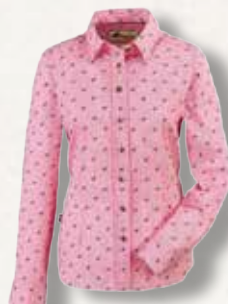
Skogen Damenbluse Hirsch

Stilvolle Skogen Langarm-Damenbluse: Hirschmuster, kariert, in frischem Pink. Zeitlose Eleganz für jeden Anlass.