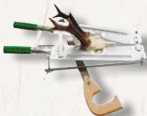
Gehörsäge für Reh

Handliche Aufbrechsäge. Best.Nr.: AK69929 Rot 6 cm : €39,90 €30,99 Gelb 8,5 cm : €40,50 €36,99