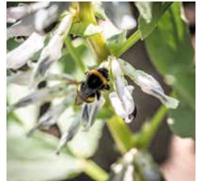
Hülsenfrüchte, wie hier die Ackerbohne, sind nicht nur für die Ernährung gut, sie tragen auch zu einer nachhaltigen Landwirtschaft bei.

Ernährungswissenschaftlerinnen und -wissenschaftler empfehlen, Hülsenfrüchte im Rahmen einer gesunden, pflanzenbetonten Ernährungsweise regelmäßig auf den Speiseplan zu setzen: Sie liefern nicht nur viel Eiweiß, sondern machen lange satt und können dazu beitragen, den Blutzuckerspiegel stabil zu halten. Und natürlich lassen sich Körnererbsen, Ackerbohnen, Süßlupinen und Sojabohnen