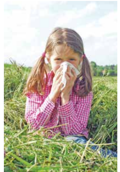
Niesanfälle und Augenjucken können Kindern das Toben im Freien verleiden.

So lassen sich Frühling und Sommer wieder aktiver und entspannter genießen – trotz Pollenflug.