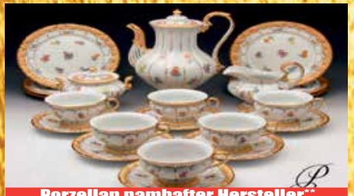
Porzellan namhafter Hersteller**