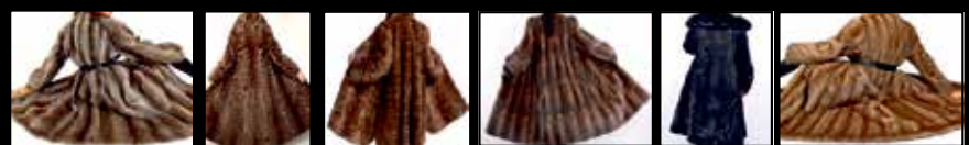
Bisam • Persianer • Fuchspelze aller Art • Zobel • Nerze • Nutria • Chincilla