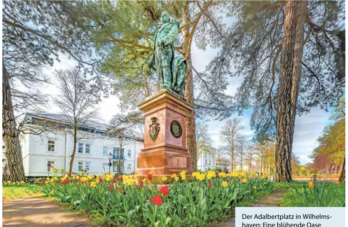
Der Adalbertplatz in Wilhelmshaven: Eine blühende Oase inmitten der Innenstadt.

Rund die Hälfte des gesamten Stadtgebiets besteht aus weitläufigen Gärten und Parks. Zu den schönsten Rückzugsorten zählt der Stadtpark mit altem Baumbestand, geschwungenen Wegen und stillen Wasserflächen. Nicht weit entfernt lädt der Kurpark mit seinen üppigen Wiesen, Teichen und kleinen Veranstaltungen in der Musikmuschel zum Entspannen und Träumen ein. Wer tiefer eintauchen möchte, steuert den Botanischen Garten an: Duft- und Sinnesgärten, Wildblumenwiesen und thematisch gestaltete Bereiche zeigen die Vielfalt der Pflanzenwelt. Ein besonderes Kleinod ist das Rosarium. Mehr als 5000 Rosen in über 500 Sorten verwandeln die Anlage in den Sommermonaten in ein farbenprächtiges, duftendes Blütenmeer.