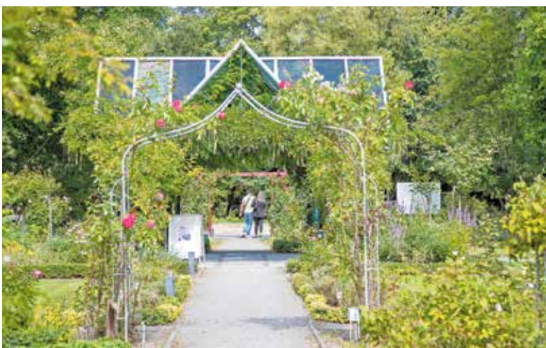
Ein blühendes Highlight der Küstenstadt ist das Rosarium mit mehr als 5000 Rosen in schönster Pracht.

die entschleunigt unterwegs sein möchten. Und während draußen Natur und Meer den Rhythmus bestimmen, arbeitet die Stadt im Hintergrund an ihrer Zukunft: Mit dem JadeWeserPort als modernem Tiefwasserhafen und Projekten rund um neue Energien entwickelt sich Wilhelmshaven zunehmend zu einem wichtigen Standort für nachhaltige grüne Wirtschaft.