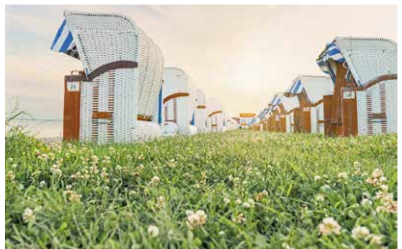
Zwischen Klee und saftigem Gras können Besuchende in gemütlichen Strandkörben am Deich entspannen.