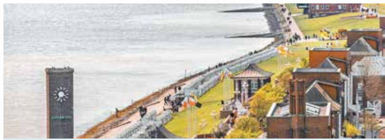
Neben dem grasbewachsenen Deich erstreckt sich weit das Wattenmeer, während sich auf der anderen Seite eine überraschend grüne Natur erhebt. Mehr auf Seite 2.