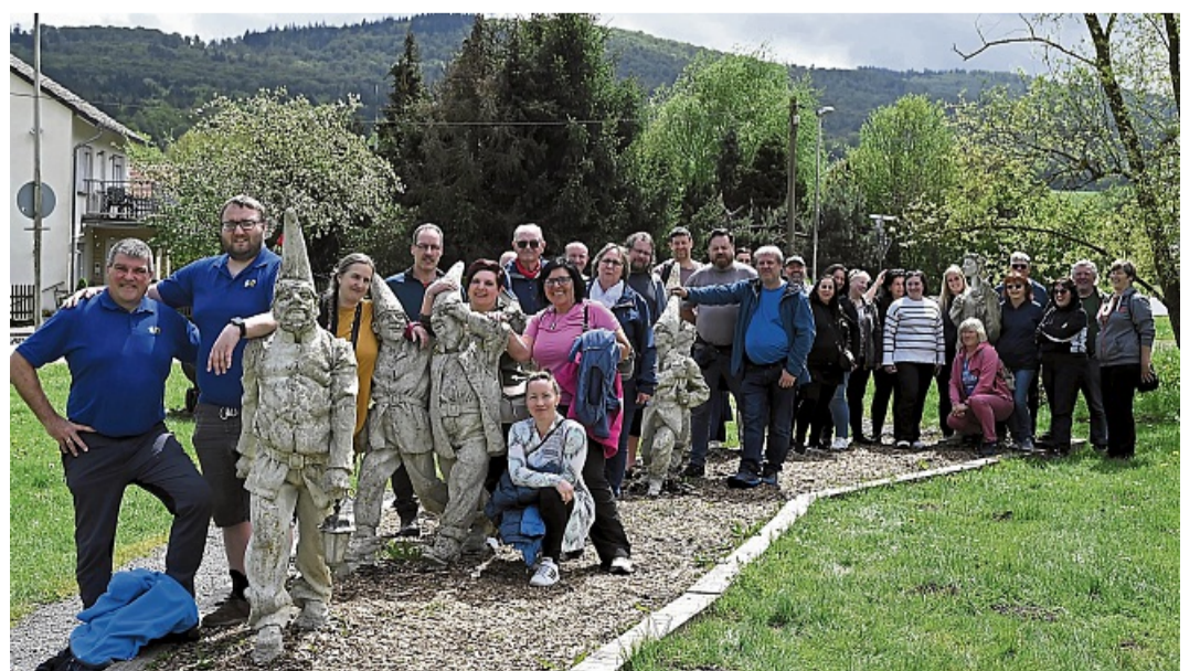
Gemeinsamer Besuch der Edertaler und Tschechen im Schneewittchendorf Bergfreiheit.

34414 Scherfede Tel. 05642 98950 www.tuschen-kuechen.de