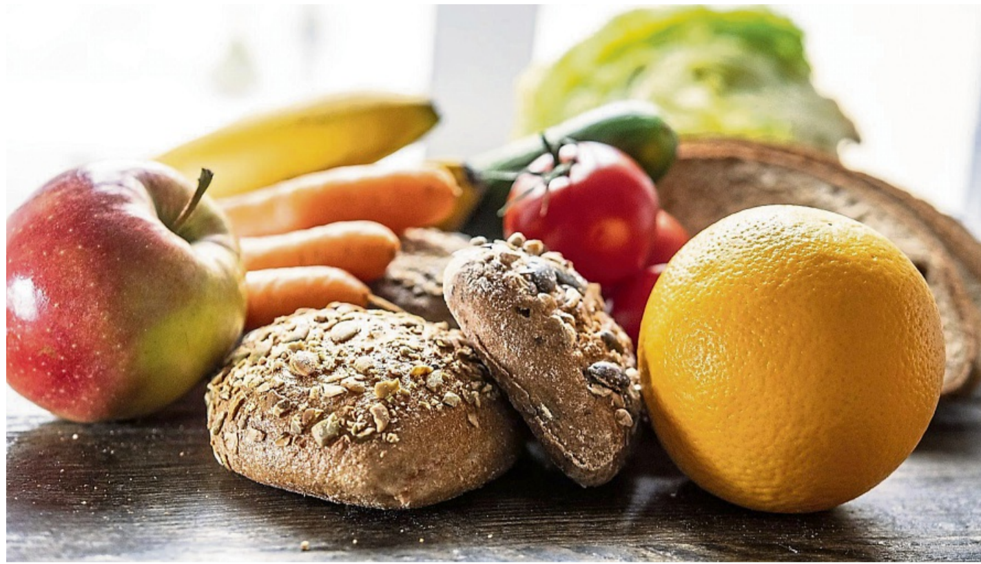
Viel Gemüse, viel Obst, viel Vollkorn: Wer so seine Ernährung gestaltet, nimmt viele Ballaststoffe zu sich.

Durch ihre gelartige Struktur unterstützen lösliche Ballaststoffe die Darmgesundheit und