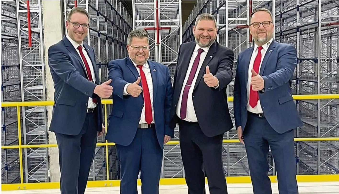
Die Bürgermeister Nordwaldecks werben gemeinsam für die Ausbildungsbörse in Bad Arolsen.

Ausbildungsbörse „Nachwuchs für Nordwaldeck“ mit 60 Betrieben