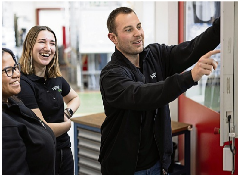
Lernen mit viel Spaß bei HEWI.

Info www.hewi-azubis.de und auf Instagram.