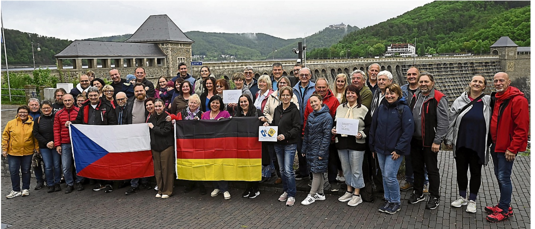
Die tschechische Gemeinde Horní Čermná erneut zu Besuch im Edertal.

21 Jahre Partnerschaft zwischen Edertal und Horní Čermná – Delegation war zu Besuch