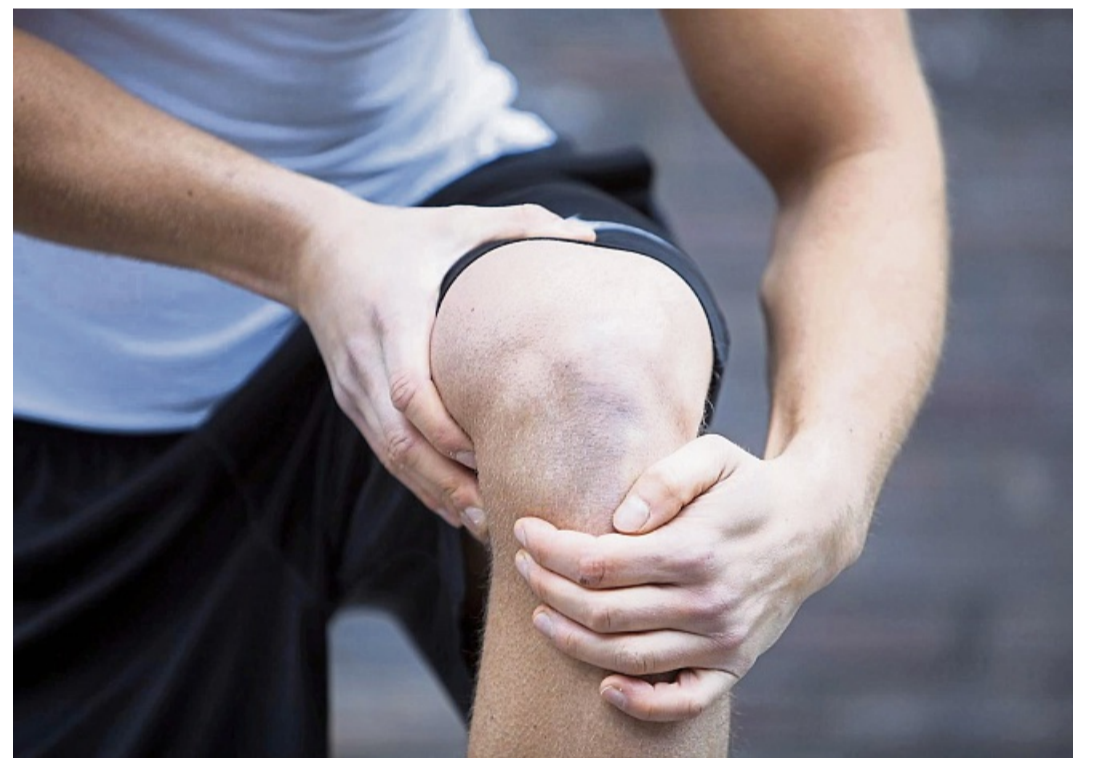
Oft macht sich eine Kniescheiben-Arthrose beim Knieen oder in der Hockstellung bemerkbar.

Wichtig sei eine frühzeitige Behandlung, um ein Übergrei-