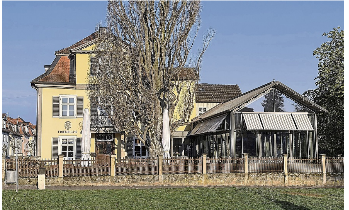
Blick auf das Restaurant „Friedrichs“, ehemals „Domanium“, in der Schloßstraße, unmittelbar am Residenzschloss. Das Gebäude ist Eigentum der Waldeckischen Domänialverwaltung.

„Wir bedanken uns ausdrücklich bei dem gesamten Team sowie unseren Gästen, Partnern und Unterstützern, die das ‚Friedrichs‘ über die Jahre hinweg begleitet und mit Leben gefüllt haben. Ein besonderer Dank gilt der Waldeckischen Domänialverwaltung für die gute und vertrauensvolle Zusammenarbeit auf ganzem We-