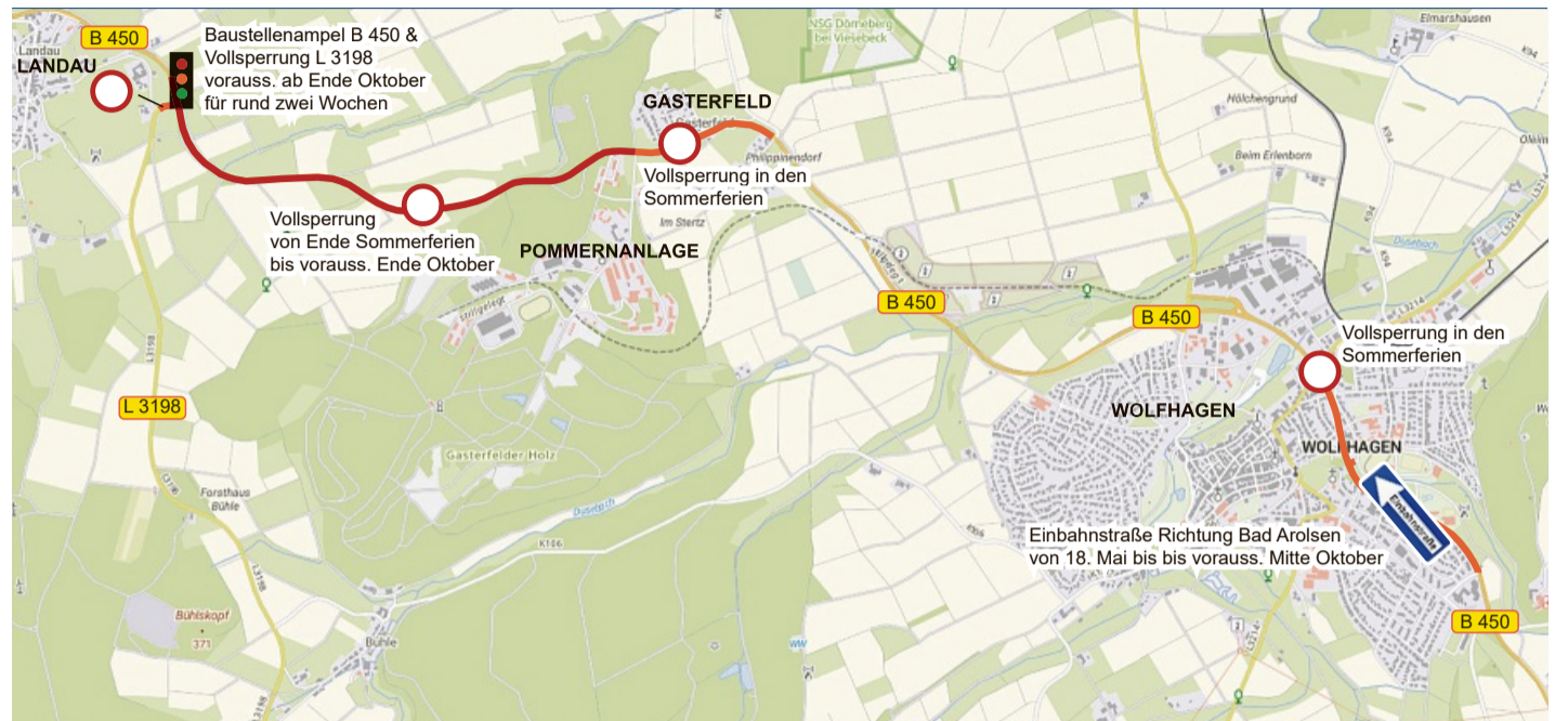
Übersichtskarte Hessenmobil zur Fahrbahnerneuerung B 450 zwischen Wolfhagen und Landau GRAFIK: HESSEN-MOBIL

Der Knotenpunkt mit Landesstraße (L 3298) nach Freienhagen wird ab voraussichtlich Ende Oktober für rund zwei Wochen saniert. Auf der B 450 steht nur eine Fahrspur zur Verfügung. Die Durchfahrt ist in beide Richtungen möglich. Ei-