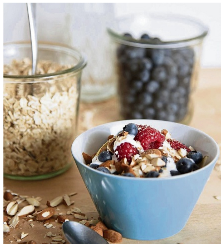
Am besten mit dem Frühstück starten: Haferflocken und Beeren bringen eine Extra-Portion Ballaststoffe in den Morgen.