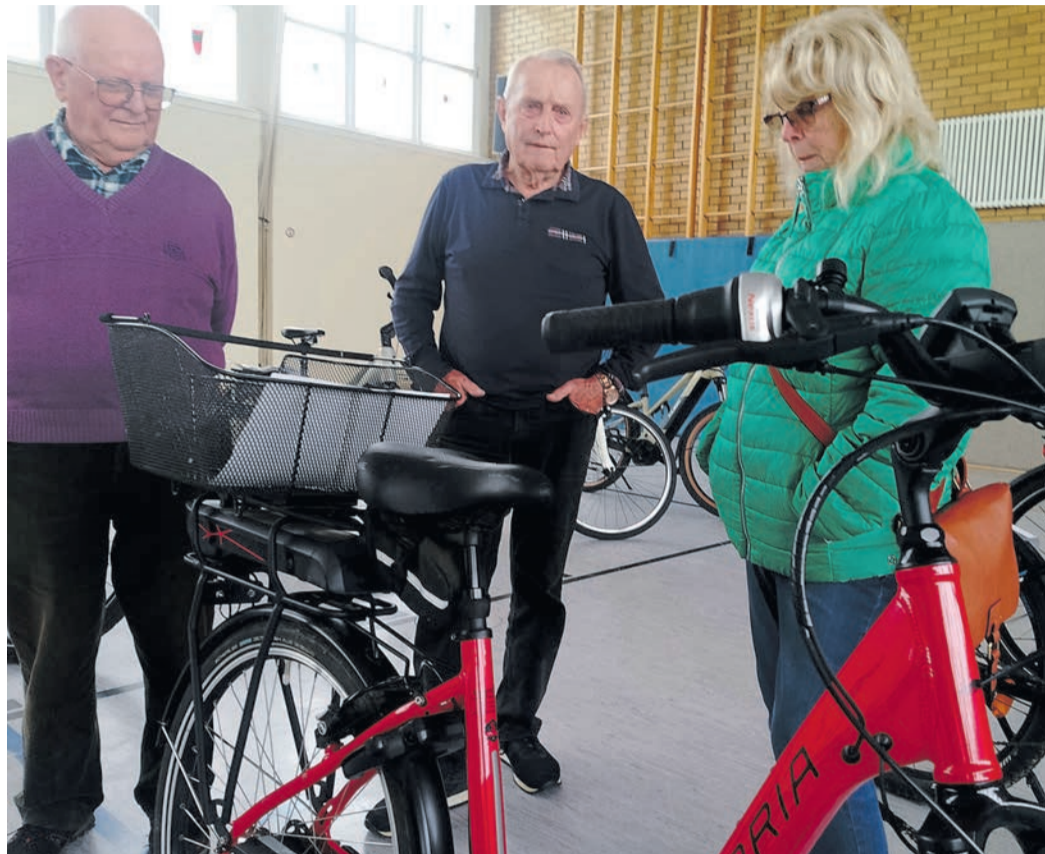
Eine ganze Reihe schöner E-Bikes waren beim Fahrradbasar zu haben. In die Kategorie „Schnäppchen“ fielen diese mit teilweise 1800 oder 2100 Euro aber nicht.

Für Aufmerksamkeit sorgte die Parade von rund einem Dutzend E-Bikes, deren Preise von bis zu 2.200 Euro nicht ganz zu einem „Basar“ passte. Hier kam die Frage auf, ob potenti-