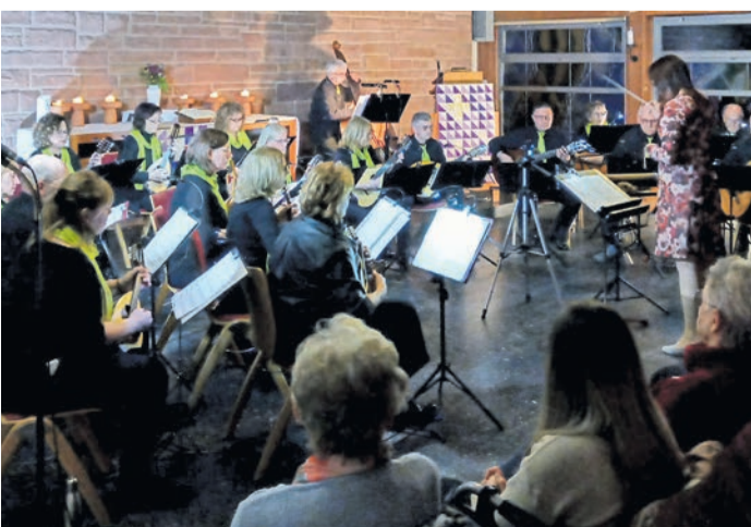
Zum Frühlingkonzert lud das Mandolinenorchester der Wandergesellschaft “Frisch Auf” Münster in die evangelische Kirche. Die filigran gezupften Musikstücke sind nicht jedes Jahr zu hören.