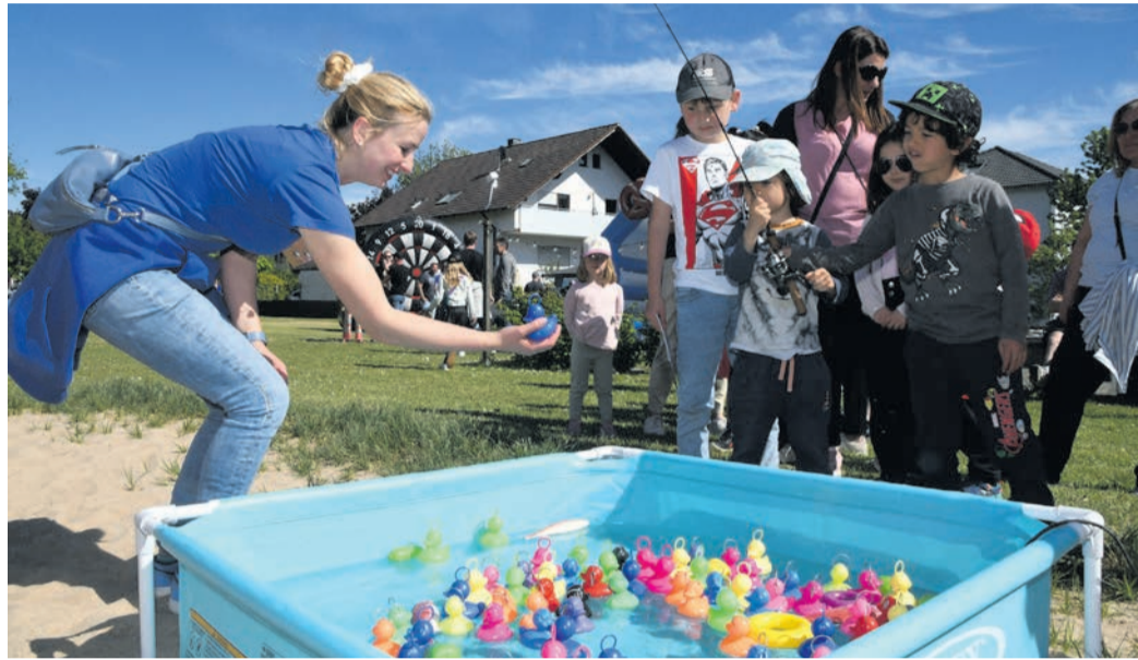
Auch der Angelsportverein betreibt in Münster Jugendarbeit und hat sich am Sonntag am ersten „Tag der Kinderrechte“ auf dem DJK-Gelände beteiligt. Hoch im Kurs: das Entenangeln.

„Im Kindergarten werden Kinderrechte immer mehr thematisiert“, freut sich Hardt und schaut bei schönstem Frühlingswetter über das Gewimmel an den verschiedenen Stationen, die die Vereine aufgebaut haben. Im Lehrplan der Schulen vermisst sie das Thema hingegen noch. In den Vereinen nimmt die Bedeutung des Kinderschutzes derweil zu, doch hinsichtlich Gewalt und Missbrauch im oft engen Vertrauensverhältnis zwischen Kindern und Jugendlichen auf