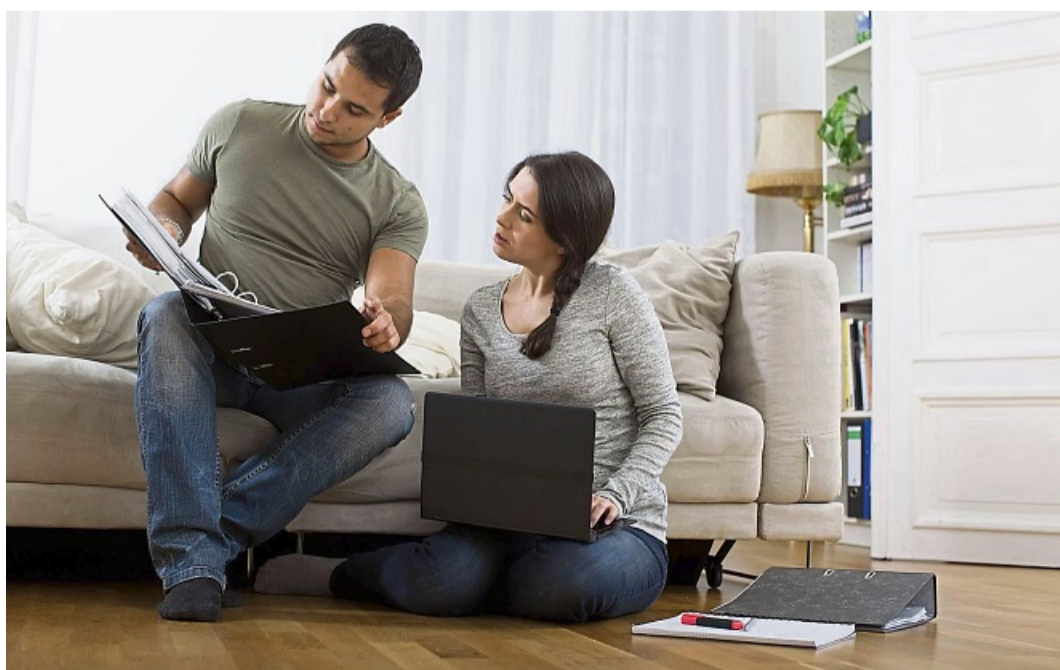
Will gut überlegt sein – und zur jeweiligen Lebenssituation passen: der Einzug in eine geerbte Immobilie.