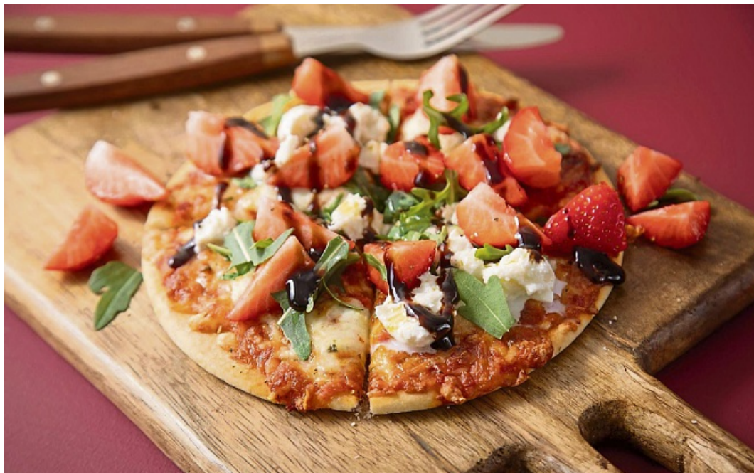
Erdbeeren auf die Pizza Margherita? Klar doch! Sie werden allerdings erst zusammen mit dem Rucola nach dem Backen aufgelegt.