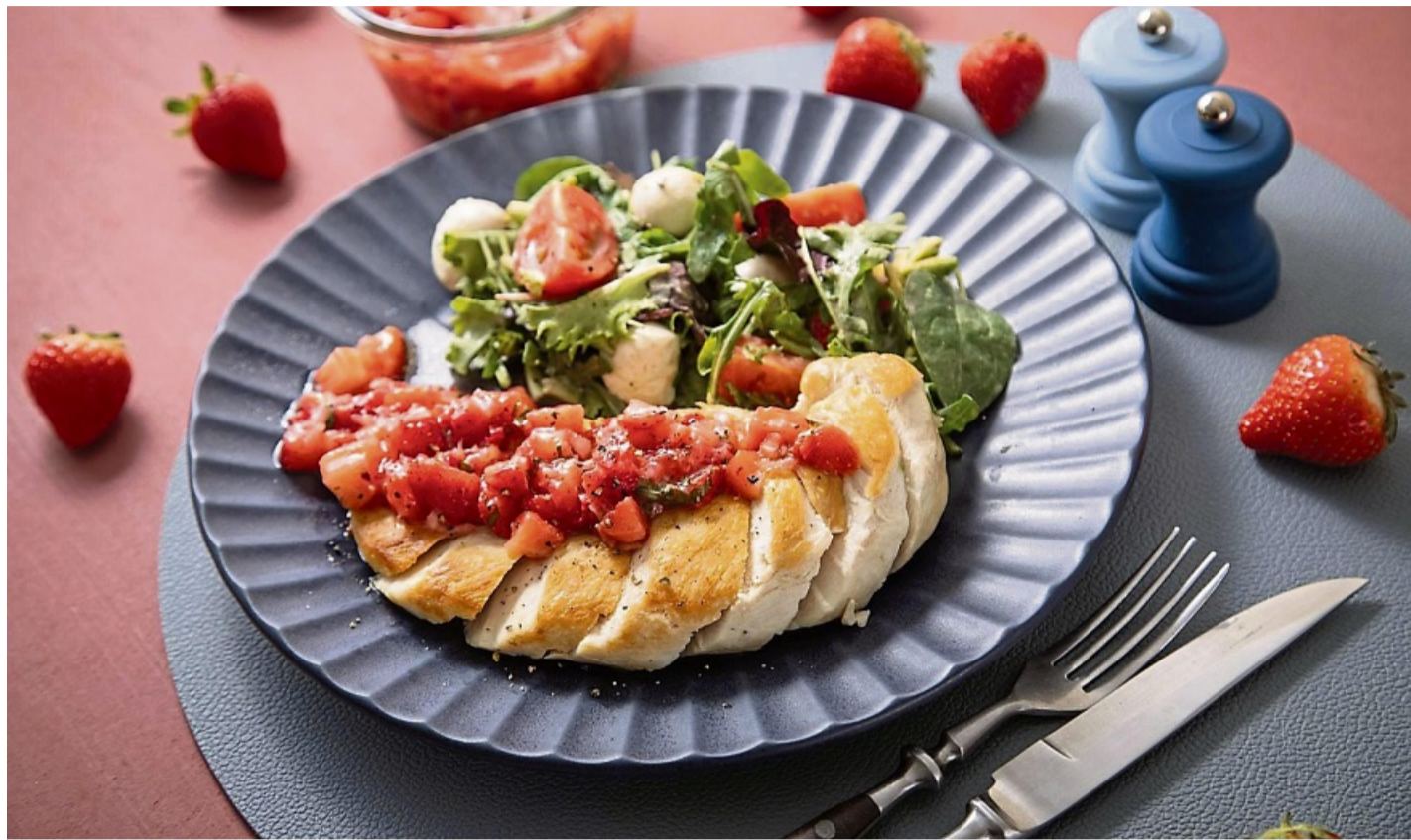
Eine fruchtige Idee für den Grillabend: Erdbeersalsa aus frischen Erdbeeren, Chilischote, Kräutern und roter Zwiebel passt gut zu einer gebratenen Hühnerbrust mit Salat.

Frisch machen sich die saftigen Früchte zum Beispiel gut