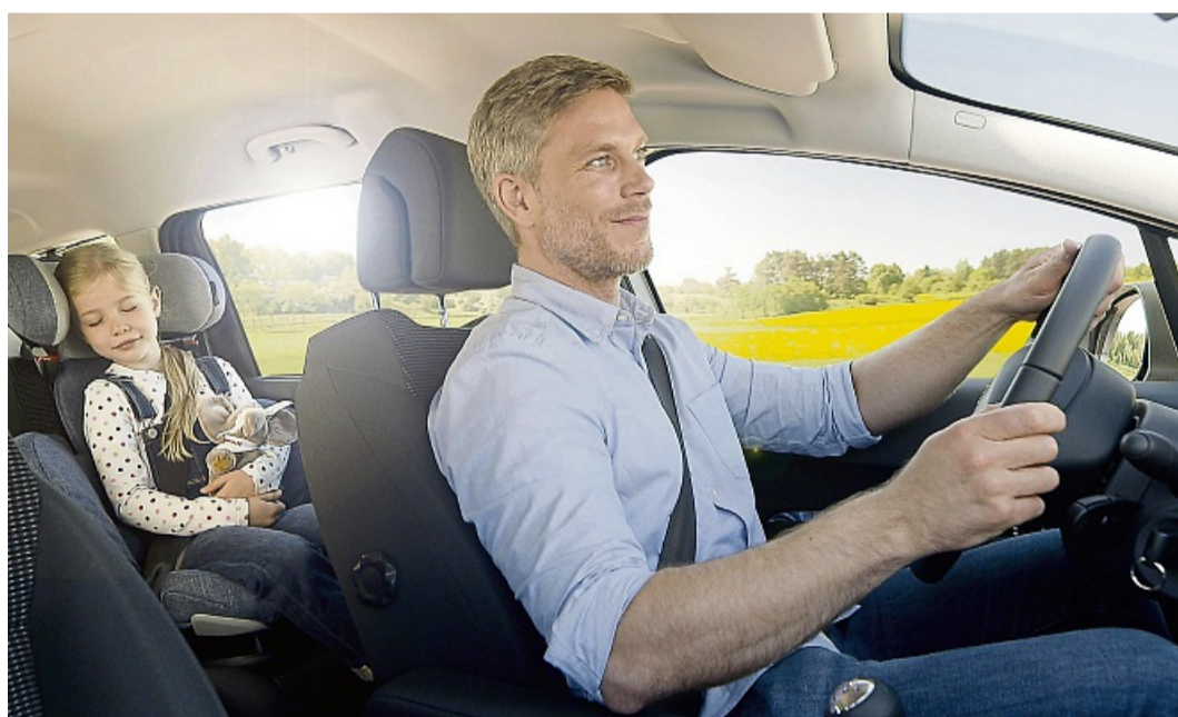
Durchatmen bei frischer Luft: Der Innenraumfilter trägt zu hygienischen Bedingungen im Auto bei. Das fördert nicht nur den Komfort, sondern auch die Sicherheit am Steuer.