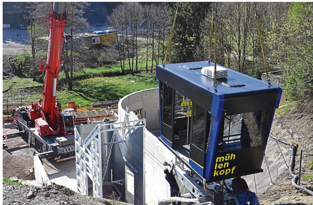
Der Mühlenkopfliner ist auf seinen Schienen angekommen.

Die Kabine wird aus ihrer Ski-Club-blauen Folie befreit, bevor die Ketten des Krans am Dach befestigt werden. Das Umheben zum Fahrwerk dauert kaum fünf Minuten: Da hat das Montageteam schon seine Hände an der Kabine. Sie zu befestigen, benötigt weniger als zwanzig Minuten – die letzte Herausforderung ist, auf sie zu steigen und die Ketten wieder zu lösen: Am Hang dauert es, die Leiter si-