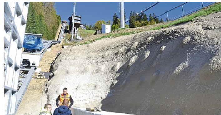
16 Meter Betonwand sind zur Hangabsicherung nötig – die letzten sieben davon unter der Erde: Wegen der Barrierefreiheit liegen die Schienen tief.