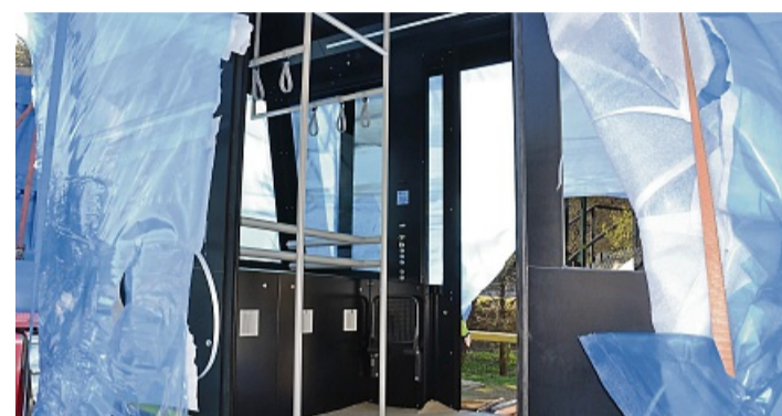
Der frisch ausgepackte Mühlenkopfliner ermöglicht einen Blick in die Kabine.

Für den vollständig elektrisch betriebenen Aufzug war ein Umbau der Energieinfrastruktur durch die EWF an der Schanze nötig. Der Antrieb braucht bergauf 80 Kilowatt, beim Start sogar 100. Auf der Rückfahrt speist er hingegen bis zu 50 Kilowatt wieder ein. Und auf der Bergstation entsteht eine Photovoltaikanlage mit Spitzenleistung von 22,25 Kilowatt.