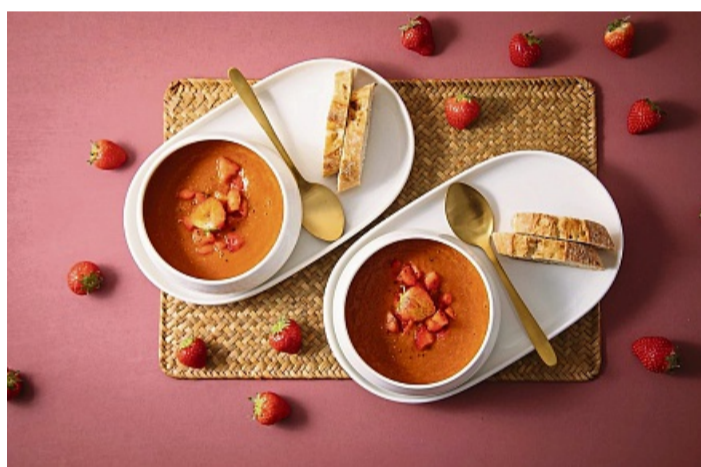
Die Erdbeer-Tomatensuppe besteht zu drei Teilen Tomaten und einem Teil Erdbeeren. Die Früchte werden gekocht, püriert und mit Curry gewürzt.

im Salat oder auf Spießen. Kombiniert mit Zutaten nach persönlichem Gusto, bringen sie je nach Sorte eine süße oder leicht säuerliche Note ins Essen – und mit ihrem Rot noch dazu einen fröhlichen Farbtupfer.