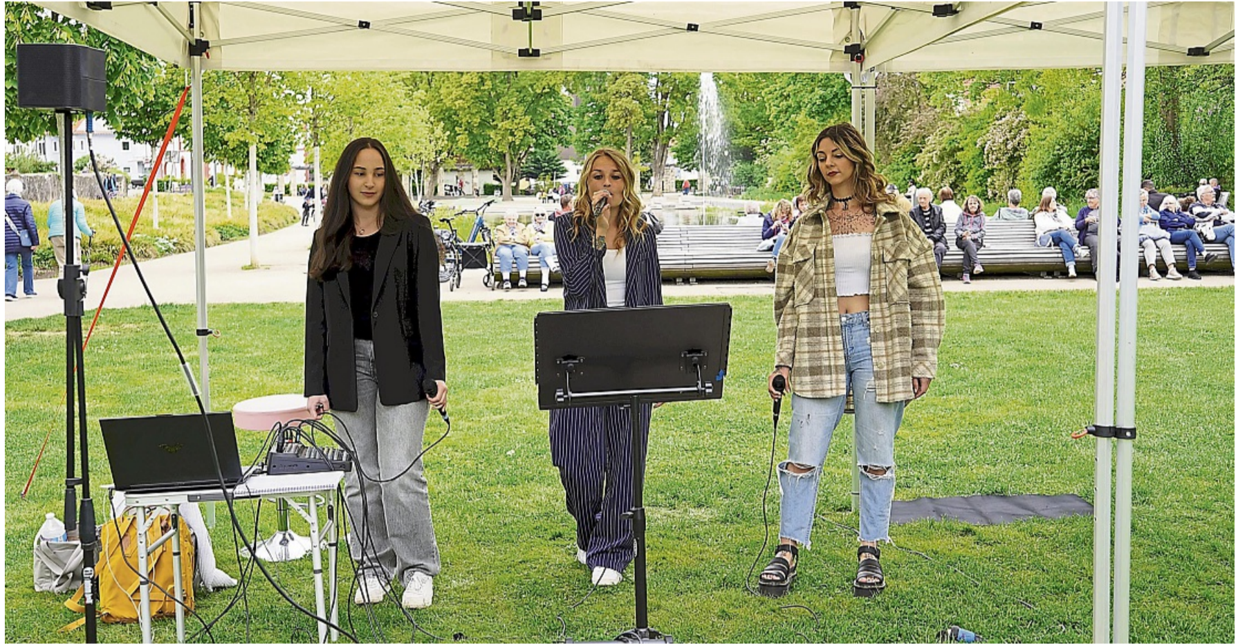
Das Trio „Le Sorelle“ unterhielt im vergangenen Jahr das Publikum bei „Musik im Park“ bestens mit Melodien ganz unterschiedlicher Genres.

Als weiteres Sommerhighlight ist vom Freitag, 14. August,