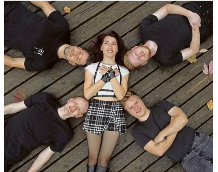
Die Rockoons, eine fünfköpfige Rock-Coverband aus Kassel, sind beim City Rock Festival Bad Arolsen dabei.