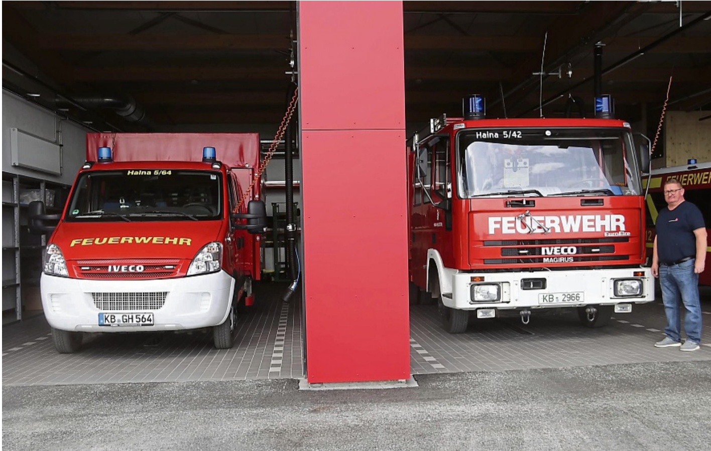
Große Fahrzeughalle: Auf 240 Quadratmetern ist dort Platz für vier Feuerwehrfahrzeuge.