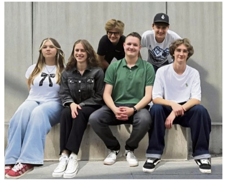
Die Nachwuchsband Golden Sound ist aus den Workshops der Barock AG hervorgegangen.