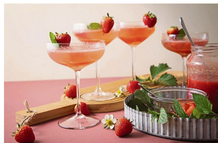
Diese Rezept-Idee nennt sich „Feuerkuss“. Dazu Champagner oder Rosé-Sekt mit eiskaltem Erdbeer-Vanille-Chili-Püree und Minze in der Champagnerschale servieren.

Am besten eine Pizza Margherita im Nachhinein mit Rucola und Erdbeeren belegen. Dazu kommen etwas Basilikum und Thymian. „Thymian ist ein gu-