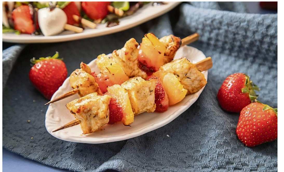
Fleischspieße mit karibischem Touch: Hähnchenbrust vor dem Braten mit Sojasoße und Curry würzen. Einzelne Stücke davon abwechselnd mit Erdbeeren und Ananas aufspießen.