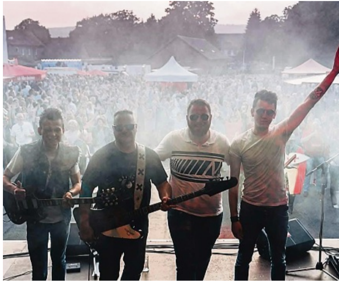
Headliner des City Rock Festivals in Arolsen ist die Band Attixx aus Höxter.

Für einen anderen, ruhigeren Zugang zur Rockmusik sorgt PAWO. Stilistisch bewegt sich der Künstler zwischen Akustik-Rock, Folk und Singer-Songwriter. Seine eigenen Songs sind persönliche Momentaufnahmen – ehrlich, nahbar und authentisch. Ergänzt wird das Programm durch ausgewählte Coverstücke, die er mit viel Gefühl und einer ganz eigenen Note interpretiert. Das City Rock Festival 2026 verspricht damit einen abwechslungsreichen Abend mit kraftvollem Rock, gefühlvollen Momenten und viel Leidenschaft für Live-Musik. red/es