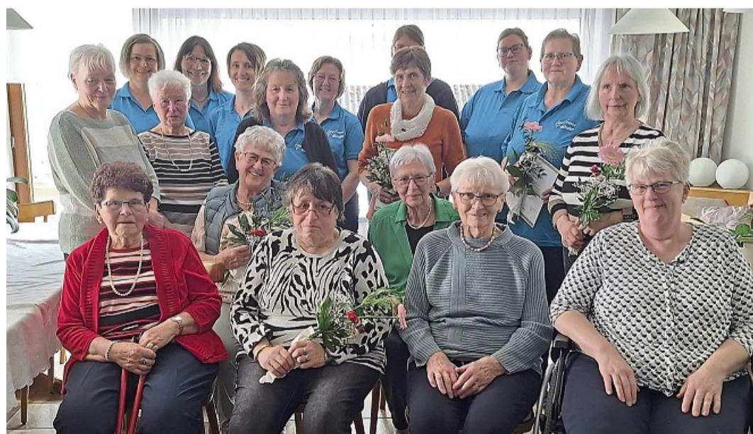
Beim Ü70-Treffen kamen zahlreiche ältere Mitglieder sowie Gründungsmitglieder der Mündener Landfrauen zusammen.

Im Jahr ihres 40-jährigen Bestehens planen die Landfrauen neben einer gemeinsamen Vereinsfahrt als Höhepunkt auch wieder ein abwechslungsreiches Programm mit verschiedenen Veranstaltungen über das gesamte Jahr hinweg und das bewusst für alle Generationen. Mit dem neuen Vorstand bleibt der Verein dabei aktiv und gut vernetzt.