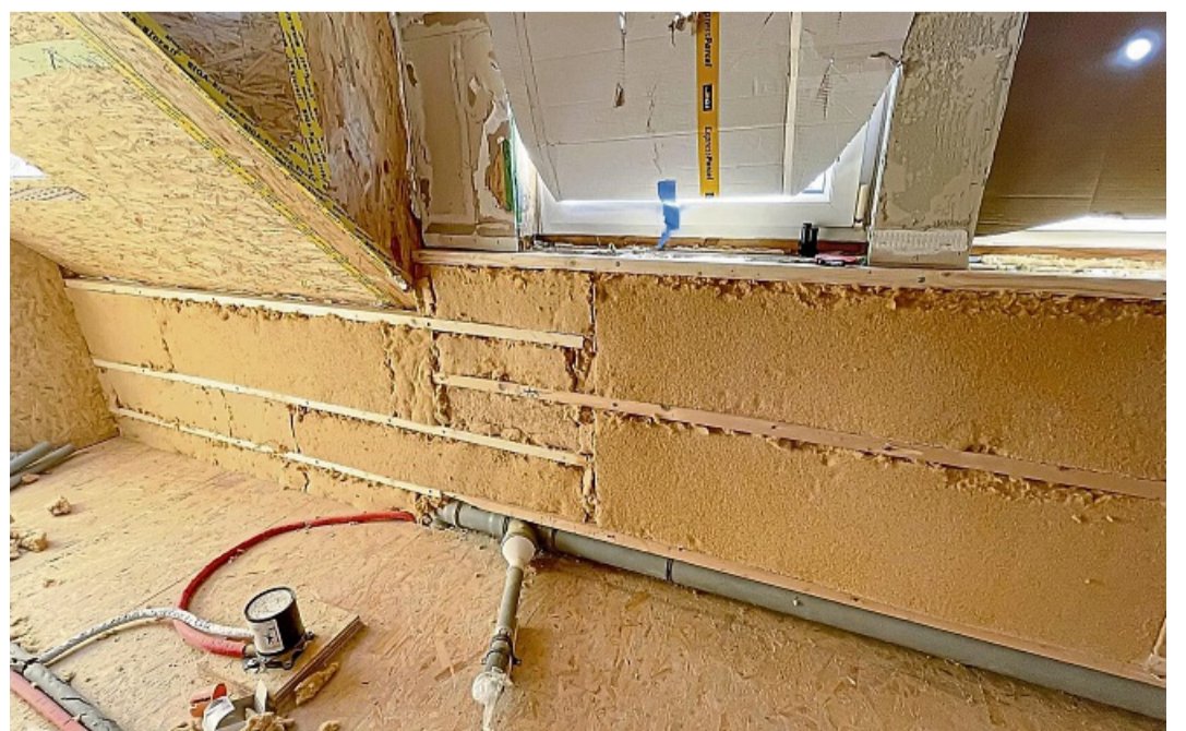
Gut gedämmt? Wer eine alte Immobilie übernimmt, muss gegebenenfalls energetische Maßnahmen nachholen.