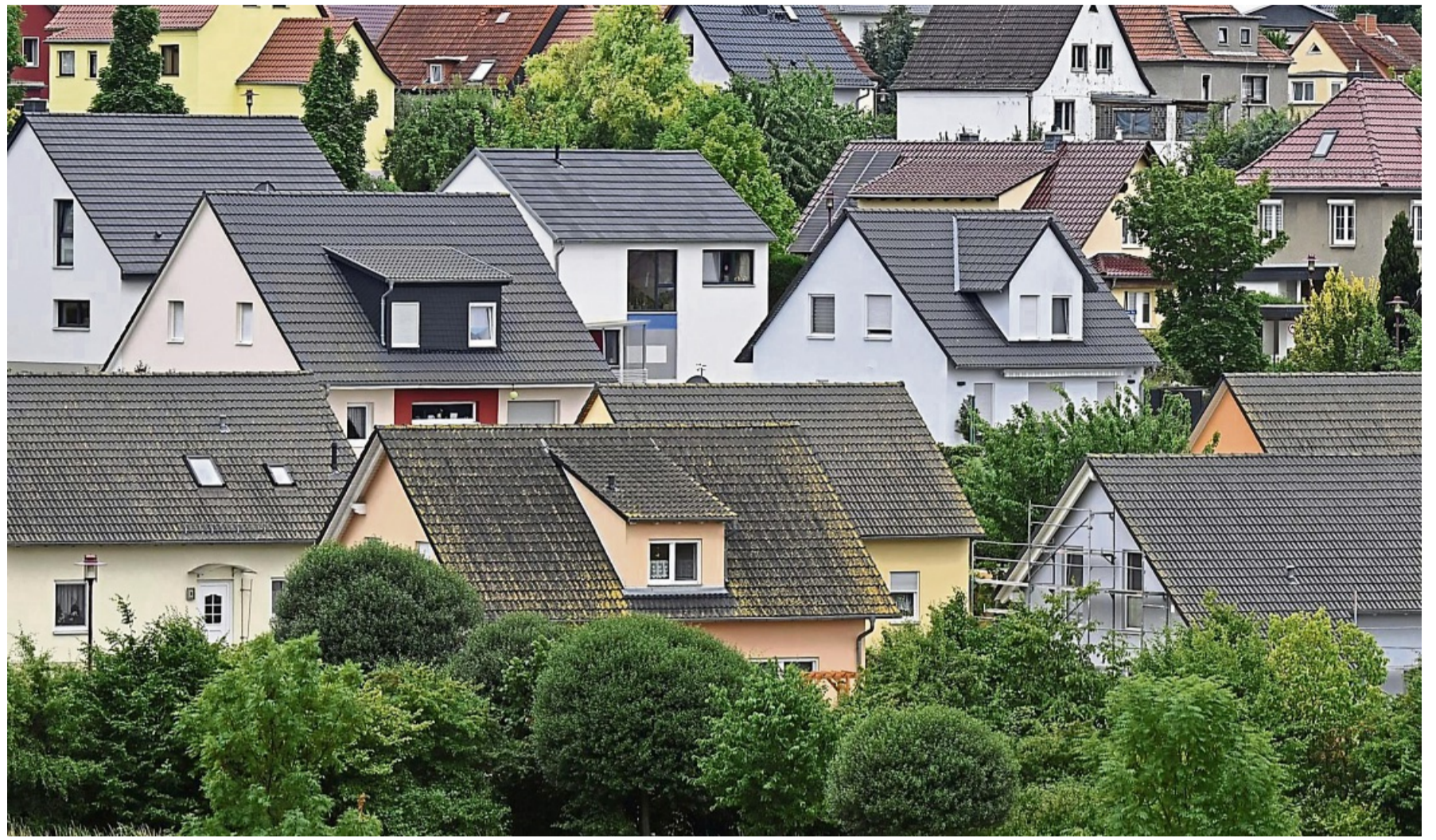
Bei der Übernahme einer Immobilie kommt es auch auf die umliegende Infrastruktur an.

Wer Hunderte Kilometer entfernt lebt und arbeitet, wird das Haus eher verkaufen, als seinen gesamten Lebensplan zu ändern. Wer aber ohnehin in der alten Heimat geblieben ist, für den kann die Modernisierung