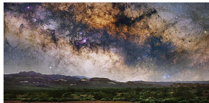
Die Milchstraße mit Vordergrund: Bei Fotos achtet Sophie Paulin auf eine angemessene Bildgestaltung.

Astrofotografin Sophie Paulin reist um die Welt und gewinnt Preise