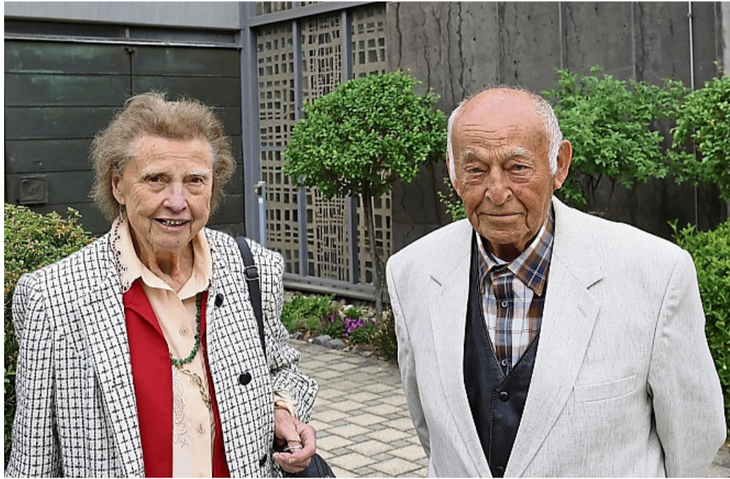
Vor 80 Jahren kamen die ersten Vertriebenen aus dem Sudetenland in Melsungen an: Vor 80 Jahren kamen die ersten Vertriebenen aus dem Sudetenland in Melsungen an.

nem Vortrag. Nach dem Zweiten Weltkrieg wurden die Sudetendeutschen als Nazisympathisanten eingestuft und es folgten Enteignung, Vertreibung und Heimatverlust. Ihnen blieb nur das Überleben. Sie wurden wie gehetztes Wild aus den Häusern geholt und vertrieben, berichtete Wagner weiter. Mord, Vergewaltigung und Raub waren an der Tagesordnung. So kam es zu den Transporten der Sudetendeutschen. In Mies, im Sudetenland, wurden Sammellager errichtet. In