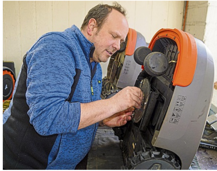
Hier wird Service großgeschrieben: Döring-Gartentechnik bietet auch unterschiedliche Service-Pakete an.

Genau hier setzen die neuen Allradmodelle an – allen voran die X4-Serie. Sie ist ausgelegt für größere Flächen, arbeitet mit deutlich breiterem Mähdeck, mehreren Kameras und einem komplexen Sensorsystem – und schafft Steigungen,