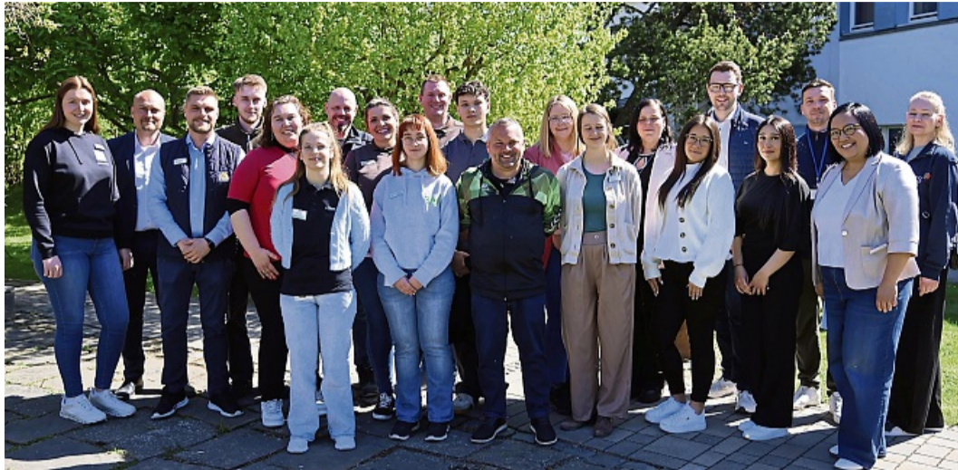
Es ging um die Zukunft: Die Vertreter der am Speed-Dating beteiligten Firmen mit den in die Veranstaltung involvierten Mitarbeitern der Jugendwerkstatt.

Bei dem Speed-Dating in Felsberg waren neun Unternehmen aus der Region vertreten. Dabei waren B.Braun SE, Schwälmer Brotladen, Lidl, WKS Print Partner GmbH (Druckerei Strube), Spedition Kordel, Newcare Home, EAM, Bundeswehr und das Hotel Kloster Haydau. Die Vertreter dieser Unternehmen stellten in kurzen Präsentationen ihre Unternehmen vor. Welche Produkte werden hergestellt, was macht das Unternehmen, welche Ausbildungsberufe gibt es dort und welche Chancen bieten Ausbildung oder Tätigkeit in dem jeweiligen Unternehmen? Auch auf welchem Wege die Bewerbungen bei den Unternehmen eingehen müssen, wurde erläutert, denn viele Unternehmen