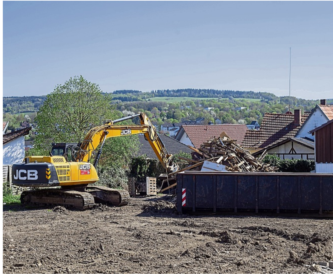
Die Baustelle beim Quartier Freiheit: Die letzten Reste des Bauschutts der abgerissenen Häuser.

Das Objekt mit den Nummern 5/6 an der Mauer gehört auch der Stadt. „Dieses bleibt bestehen, wird unterhalten und entwickelt“, erklärt Chris-