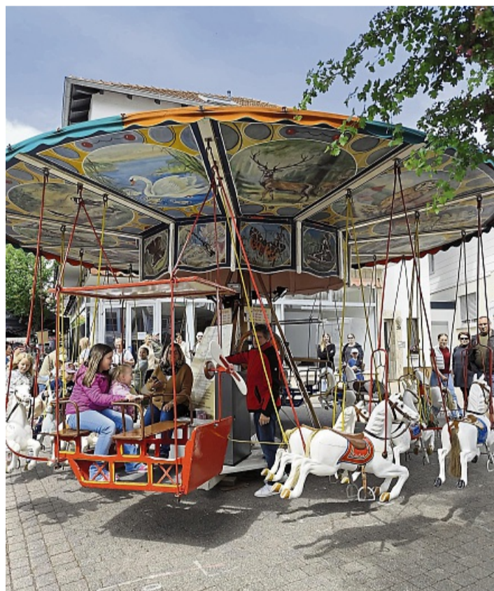
Das nostalgische Kinderkarussell gehört zu den beliebten Klassikern des Himmelfahrtsmarktes.