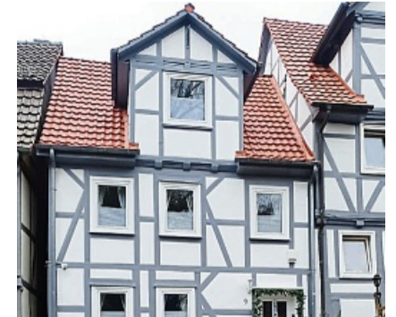
Auch Fachwerkhäuser sind bei uns in guten Händen.