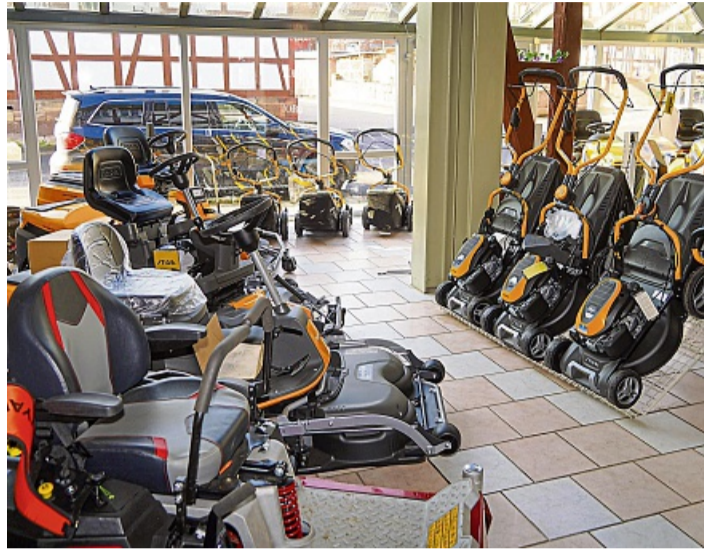
Eine große Auswahl an Gartengeräten gibt es bei Döring-Gartentechnik.

Die neue H-Serie kommt inzwischen mit fest integrierter Kamera und einer technischen Ausstattung, die laut Döring „alles umfasst, was man im zivilen Bereich aktuell bekommen kann“. Entscheidender noch: Die Geräte benötigen keine eigene Korrekturantenne mehr. Stattdessen holen sie sich ihre Positionsdaten über das Mobilfunknetz – automatisch, stabil und ohne Zusatzkosten. Selbst in ländlichen Lagen funktioniert das erstaunlich zuverlässig, weil die Systeme parallel