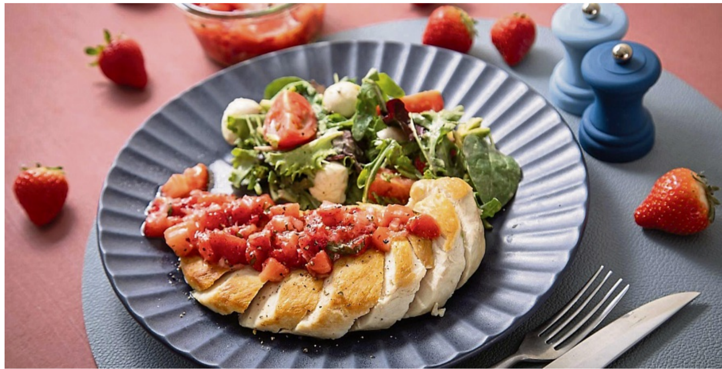
Eine fruchtige Idee für den Grillabend: Erdbeersalsa aus frischen Erdbeeren, Chilischote, Kräutern und roter Zwiebel passt gut zu einer gebratenen Hühnerbrust mit Salat.

besten frisch schmecken, ist Marmelade nur ein Beispiel, dass die saftigen Früchte auch gekocht werden können. So schwärmt Simon Schumacher vom Verband Süddeutscher Spargel- und Erdbeeranbauer (VSSE) von einer einfachen Erdbeer-Tomatensuppe.