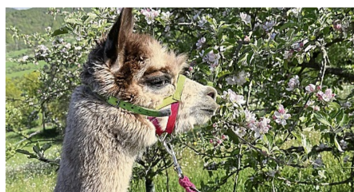
Neugierig, aber zurückhaltend: Erst nach einiger Zeit fassen die Tiere Vertrauen. Dann darf man ihnen auch näher kommen.

kontrolliert und bei Bedarf gekürzt. Die Herde von Ludolf und Eisfeld umfasst Tiere im Alter von sechs Monaten bis 20 Jahren. Alpakas können durch-