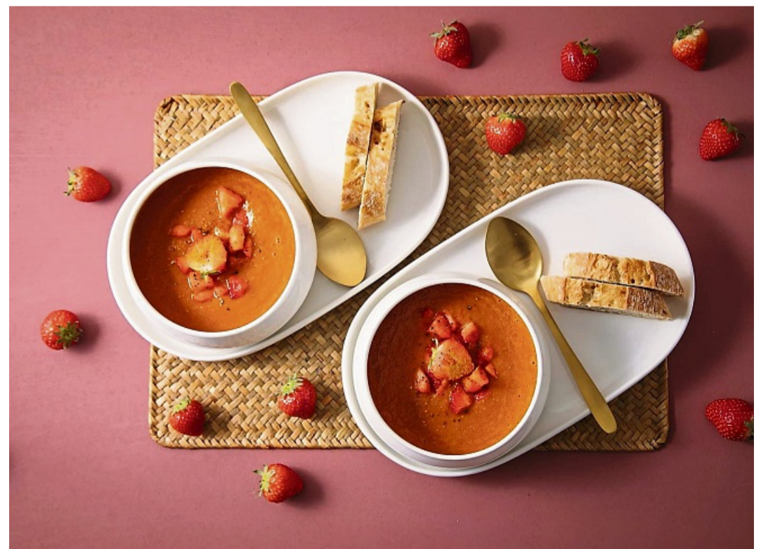
Die Erdbeer-Tomatensuppe besteht zu drei Teilen Tomaten und einem Teil Erdbeeren. Die Früchte werden gekocht, püriert und mit Curry gewürzt.

www.die-zusteller.de · Tel. 0561 203-1175