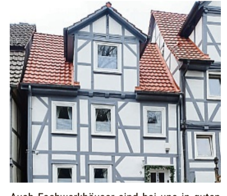
Auch Fachwerkhäuser sind bei uns in guten Händen.

AUFGEPASST!!! Werbewochen bei Firma Stieb – Kassel