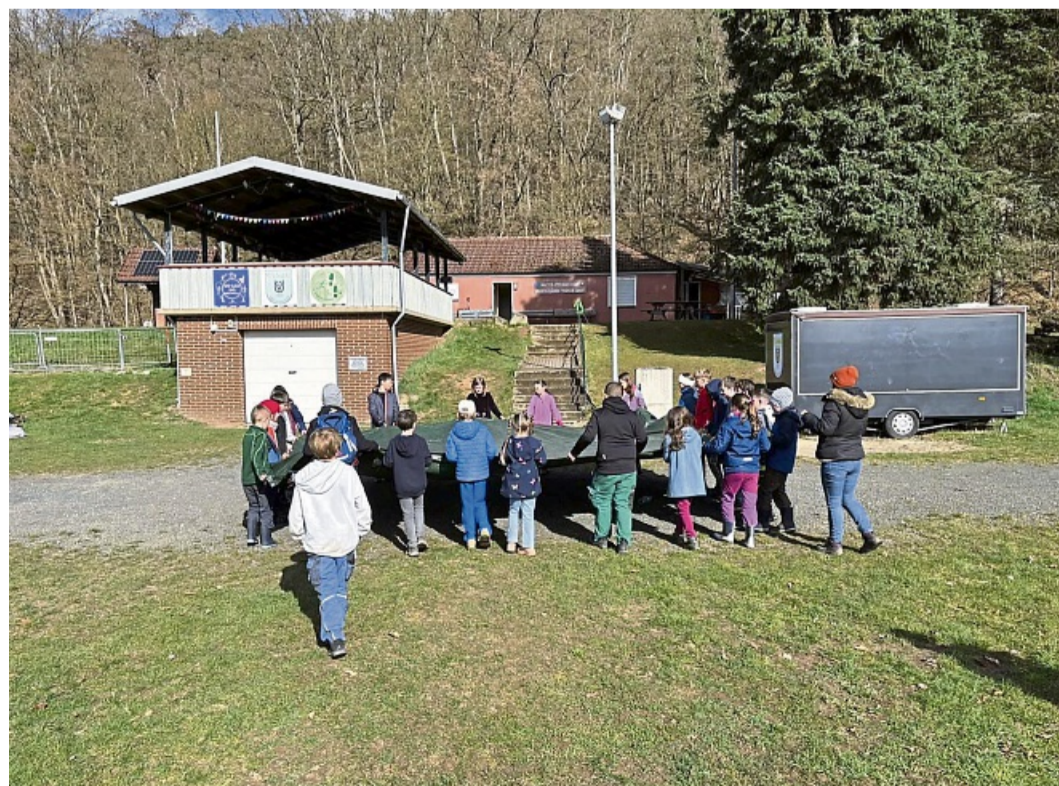
Spiel und Spaß: Ab dem 11. Mai kann man sich wieder für das Herbstferiencamp beim Mehrgenerationenhaus anmelden.

Umzüge zum Festpreis, Haushaltsauflösungen, Seniorenzüge ☎ 05 61-89 99 90