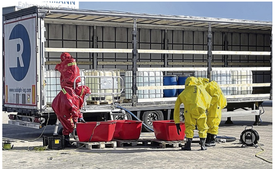
Das Umpumpen: Die Einsatzkräfte füllen die Chemikalien aus dem Anhänger in die roten Wannen. Sämtliche Behältnisse sind dabei geerdet, um eine elektrische Aufladung zu verhindern.