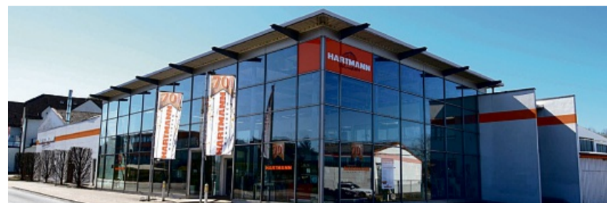
über 5.000 qm Ausstellungsfläche

Ob Polstermöbel in Stoff oder Leder, Einbauküchen, Wohnwände, Schlafzimmer, Essgruppen, Couchtische, Matratzen, Boxspringbetten, Anrichten/Vitrinen, oder echten Orientteppichen – alles wirklich alles ist jetzt drastisch im Preis reduziert. Kein Wunder also, dass man sich in Eschwege für den Ansturm der Kunden gewappnet hat. Wir müssen unseren kompletten Warenbestand in Millionenhöhe binnen kürzester Zeit restlos verwerten, hört man von der Geschäftsleitung und das ist nur mit gnadenlosen Preisnachlässen zu schaffen. Rücksicht auf Verluste kann da nicht genommen werden – ganz zum Vorteil der Kunden. Wer zuerst kommt macht natürlich die besten Schnäppchen.