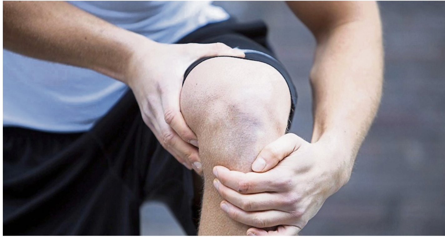
Oft macht sich eine Kniescheiben-Arthrose beim Knieen oder in der Hockstellung bemerkbar.

Viele Menschen ab 50 Jahren haben Kniescheiben-Arthrose – insbesondere wer schwere Lasten tragen oder beruflich häufig kniend arbeiten muss. Oft sind die Kniescheiben dabei erheblichem Druck ausgesetzt, wodurch Gelenkknorpel immer stärker abgetragen wird.