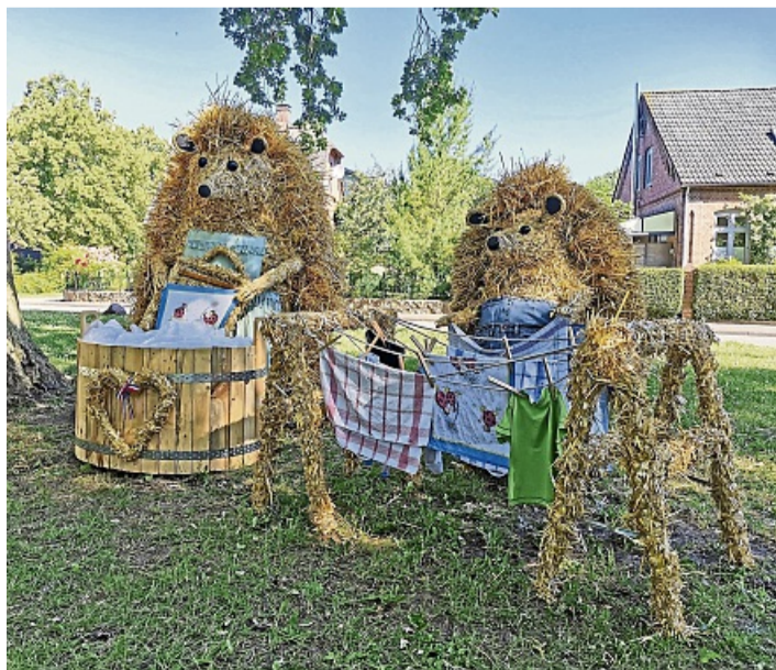
Familie Igel beim großen Waschtage – diese fantasievollen Strohfiguren konnte man im vergangenen Jahr in Fiefbergen bewundern.