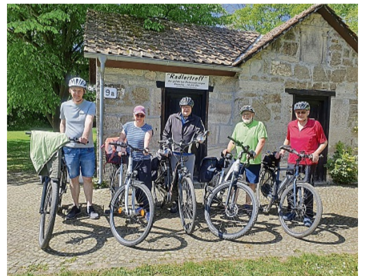
Auftakt am Radlertreff: In Bad Sooden-Allendorf beginnt ebenfalls die Saison der geführten Radwanderungen mit einer Tour entlang des Werratalradwegs – inklusive kleiner Stärkung für unterwegs.

Auch die Donnerstagstouren in Witzenhausen führen bis in den Herbst hinein auf wechselnden Routen durch die Region. ELVAN POLAT