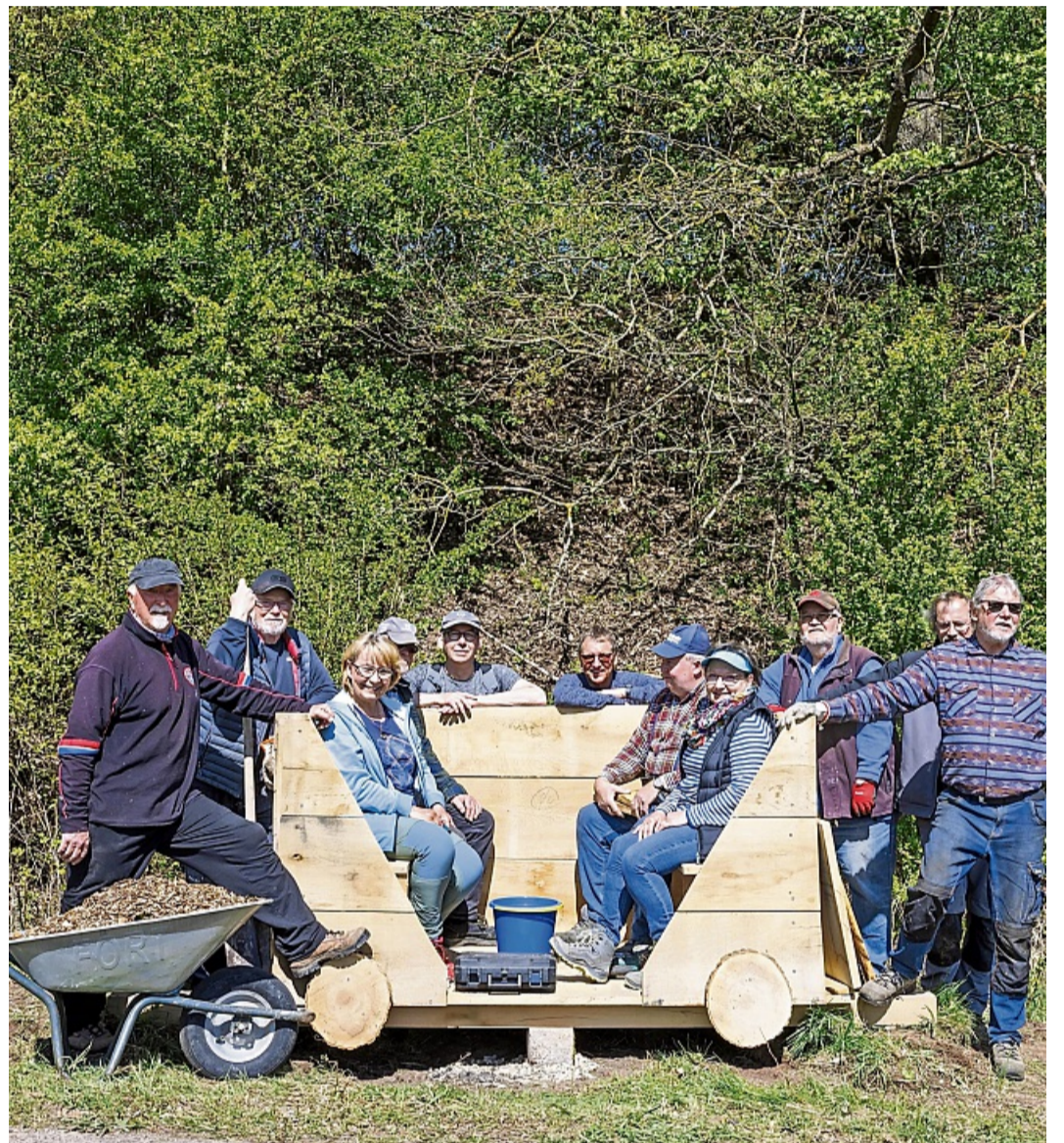
Bald folgt die Eröffnung: Der Verein „Natur und Umwelt Schedetal“ hatte die Idee für den Kunst- und Kulturpfad.