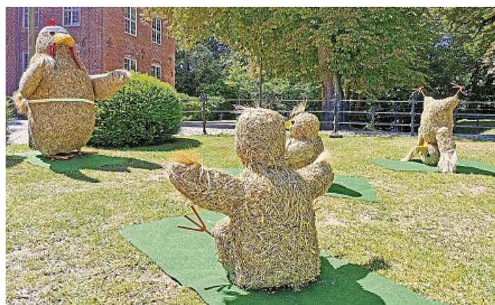
So sieht es aus, wenn Hühner Yoga machen: Zu bestaunen war das Federvieh bei den Probsteier Korntagen des vergangenen Jahres in der Gemeinde Probsteierhagen.