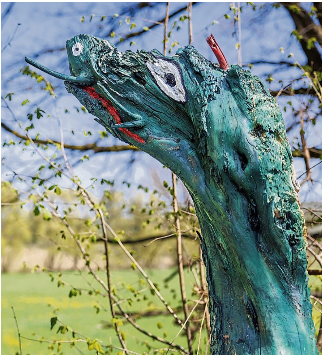
Mystisch: Wenn der abgebrochene Baum zum Baumdrachen oder Drachenbaum wird.

Kunst- und Kulturpfad in Scheden eröffnet am 31. Mai