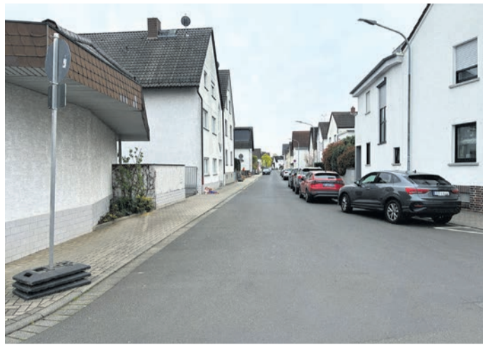
Auch in der Rhönstraße ist der Parkraum nun neu angeordnet.

„In einigen Straßen haben wir zur Verdeutlichung Halteverbotszonen eingerichtet, die kenntlich machen, an welcher Straßenseite man parken kann - nur eben nicht auf dem Gehweg. In anderen Straßen setzen wir auf die Eigenverantwortung der Bürgerinnen und Bürger,