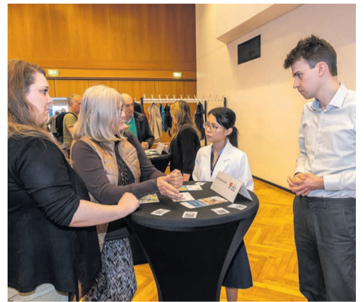
Nach der Informationsveranstaltung gab es noch die Möglichkeit, sich bei den Fachleuten zu informieren.

in Rodgau. Er zeige auf, in welchen Gebieten beispielsweise ein Anschluss an ein Wärmenetz sinnvoll sein könnte – und wo eher individuelle Lösungen wie Wärmepumpen gefragt sind. Gleichzeitig betonten die Verantwortlichen, dass niemand kurzfristig zum Handeln gezwungen werde: Bestehende Heizungen können weiter betrieben und auch modernisiert werden, solange gesetzliche Vorgaben eingehalten werden. Der aktuelle Stand: Die Datenerhebung und erste Analy-